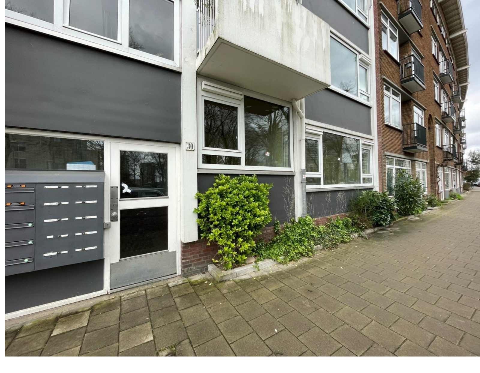
President Kennedylaan 30-huis

Redenering van Stadgenoot is blijkbaar: we hebben gewoon kapitaal nodig, dus hebben geen boodschap aan de zogenaamde afspraken die inderdaad geen afspraken zijn.