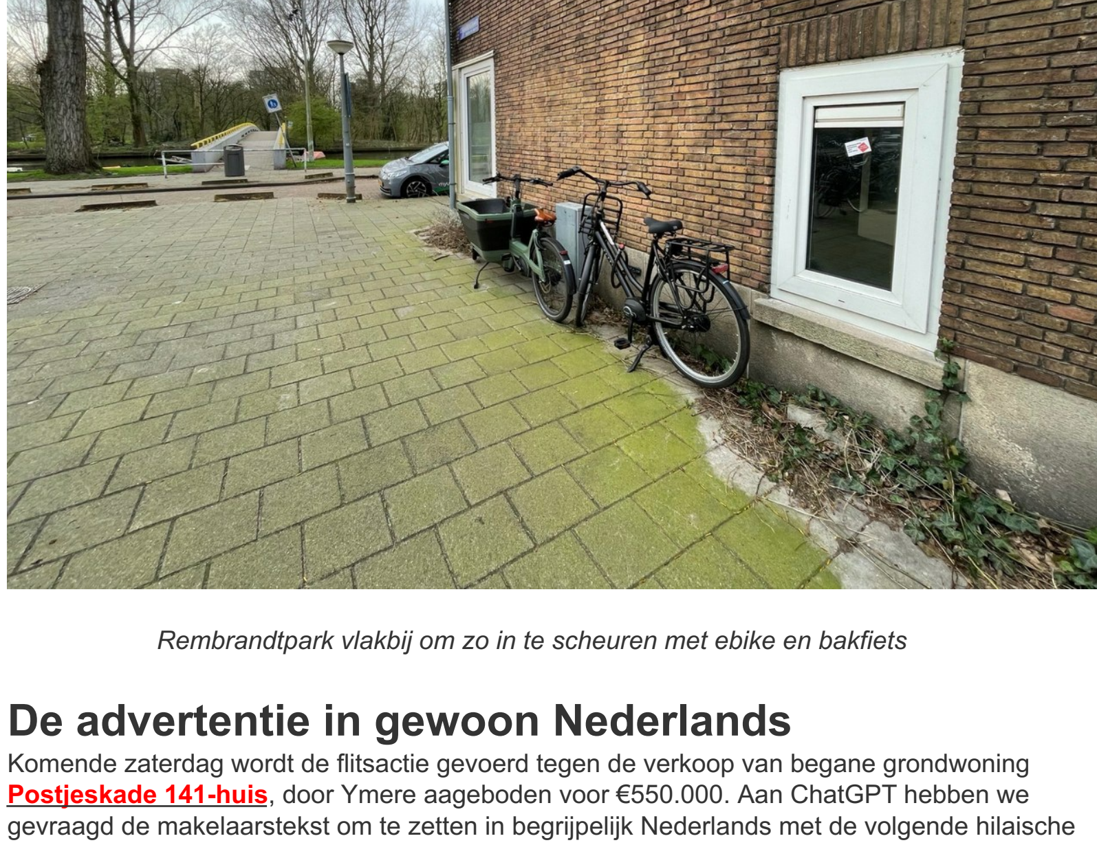
Rembrandtpark vlakbij om zo in te scheuren met ebike en bakfiets