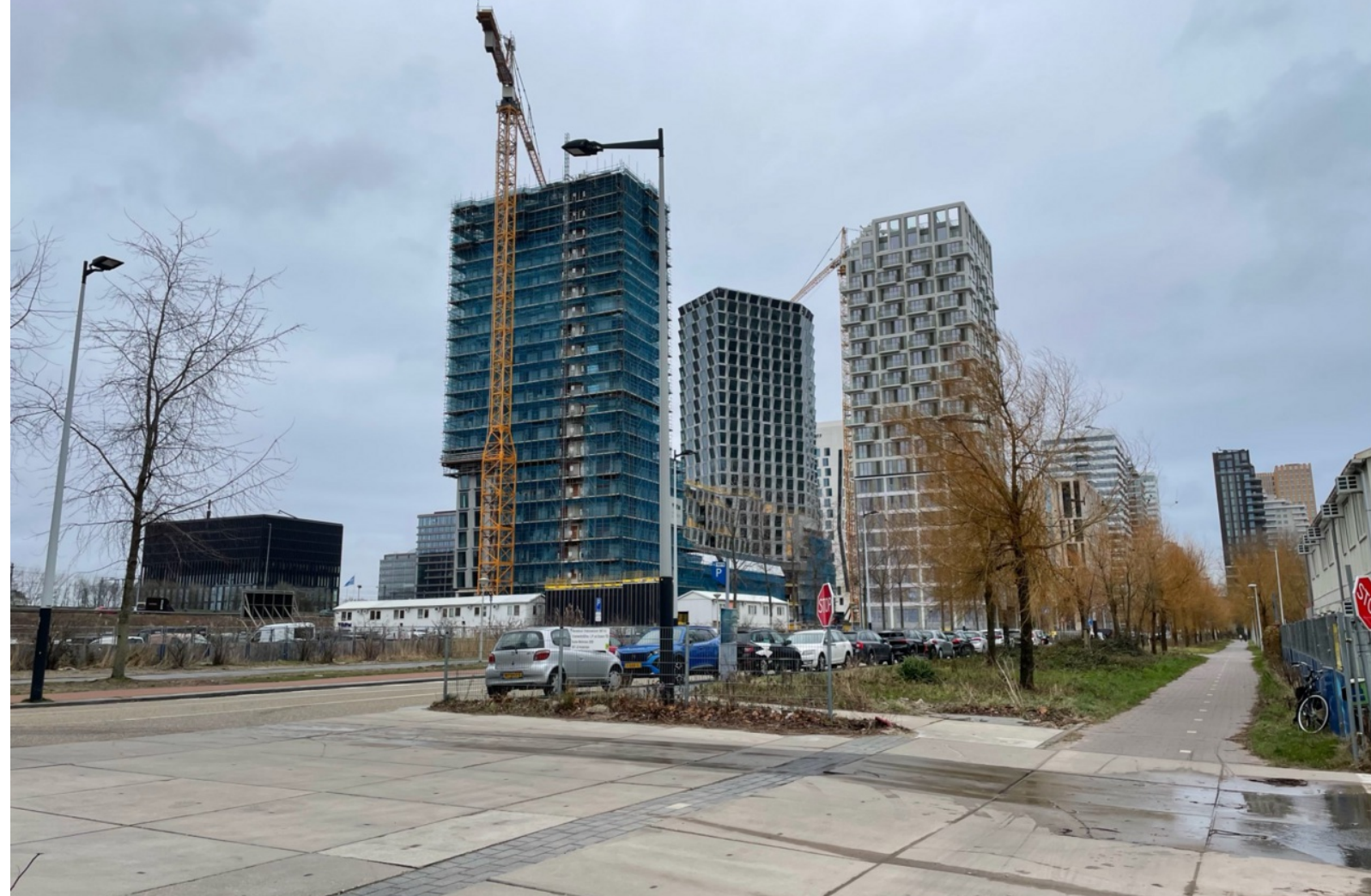
Het hoge blok rechts Stepstone, ingeklemd tussen de A10 en de Vrije Universiteit.

De toevoeging van woningen in Zuid bestaat uit de kazerne Stepstone: 216 studio's voor jongeren die er vijf jaar mogen wonen. "Step by step" verdwijnen de échte sociale woningen van de Key uit Zuid.