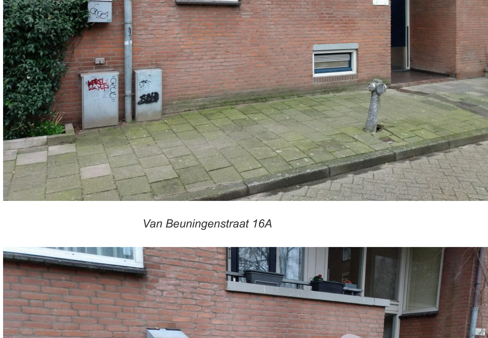
Van Beuningestraat 16A

Haar 164ste flitsactie richt actiegroep Niet Te Koop op de verkoop door Rochdale van benedenwoning Van Beuningestraat 16A voor liefst €435.000. Weer een woning die verloren gaat voor de sociale voorraad. Die gelabeld had kunnen worden als seniorenwoning, laat staan voor de gemeentelijke regeling Van Hoog Naar Laag . Een regeling die de doorstroming bevordert: ouderen verhuizen naar beneden waardoor bovenwoningen vrijkomen, maar waar corporaties slechts met lippendienst aan meewerken. Immers, zo raken ze hun gemengde complexen niet kwijt én het is voor hen zeer bewerkelijk. Een uitgewoende woning kun je natuurlijk niet aanbieden aan een oudere huurder.