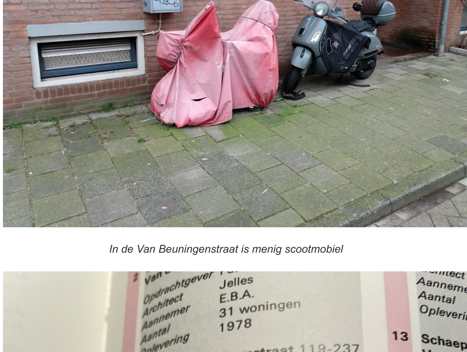
In de Van Beuningestraat is menig scootmobiel