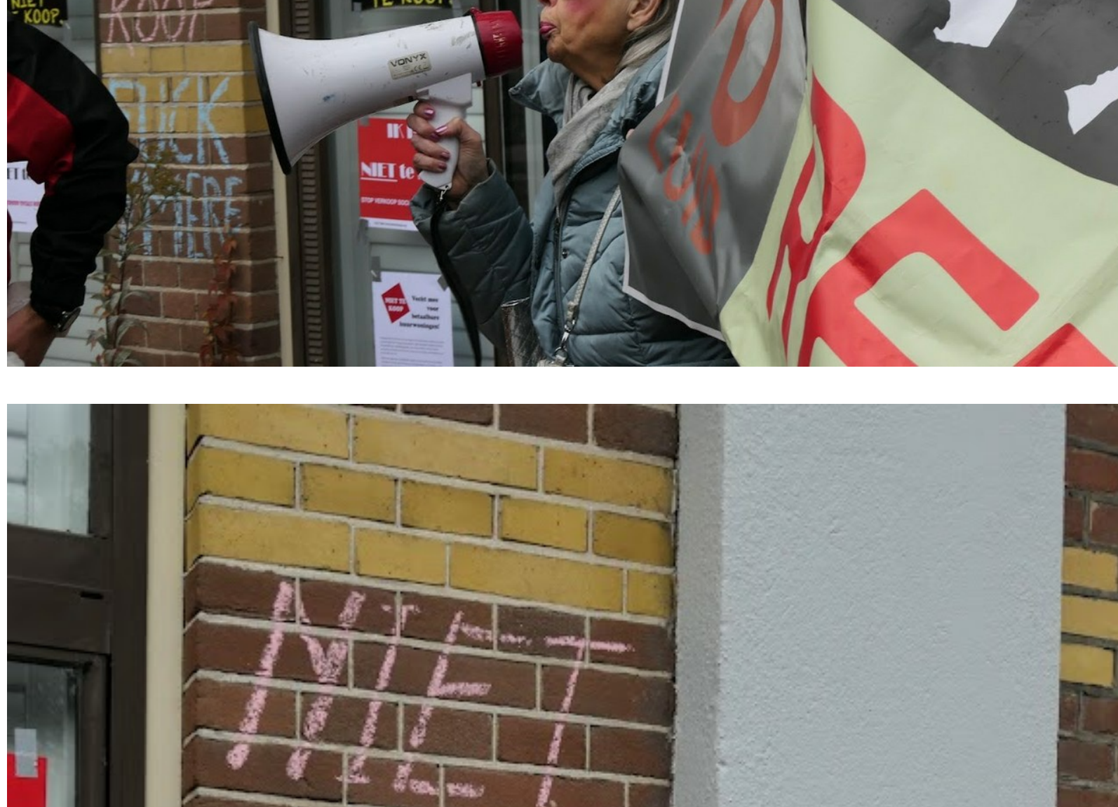
Onze 150ste actie!