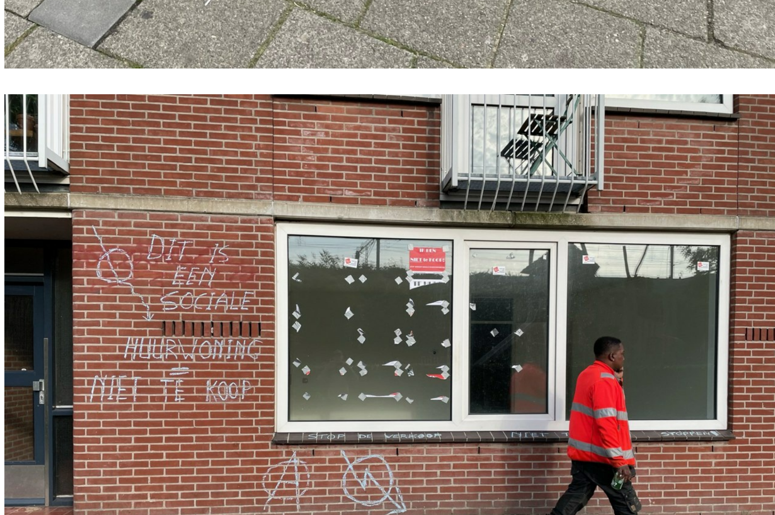
Twee dagen later is bijna al het plakwerk weg. Maar bij stoepkrijt gaat dat niet zo gemakkelijk.