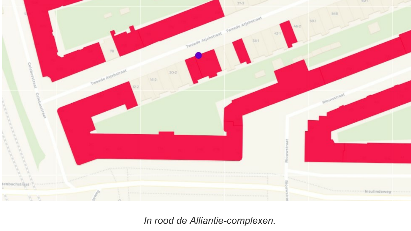
In rood de Alliantie-complexen.

Bij de vorige flitsactie spraken wij een huurster die nog woont op nummer 24. Ondanks dat het pand al in 2008 is gesplitst woonden er tot voor kort louter huurders. Daar is nu tot haar leedwezen een einde aan gekomen. Kopers kunnen ook heel aardige mensen zijn, maar zijn tegelijk een voorbode van misschien niet zo prettige veranderingen. Kopers die snel weer vertrekken om de woning te verhuren aan expats, om de zoveel tijd weer anderen. Kopers die een totaal andere leefwijze erop nahouden, zo in zichzelf gekeerd met airpods dat ze je nooit opmerken op de trap of voor de deur. Kopers die vinden dat de gemeenschappelijke trap '... van de VVE is' en waar je dus als huurder niets mag neerzetten.