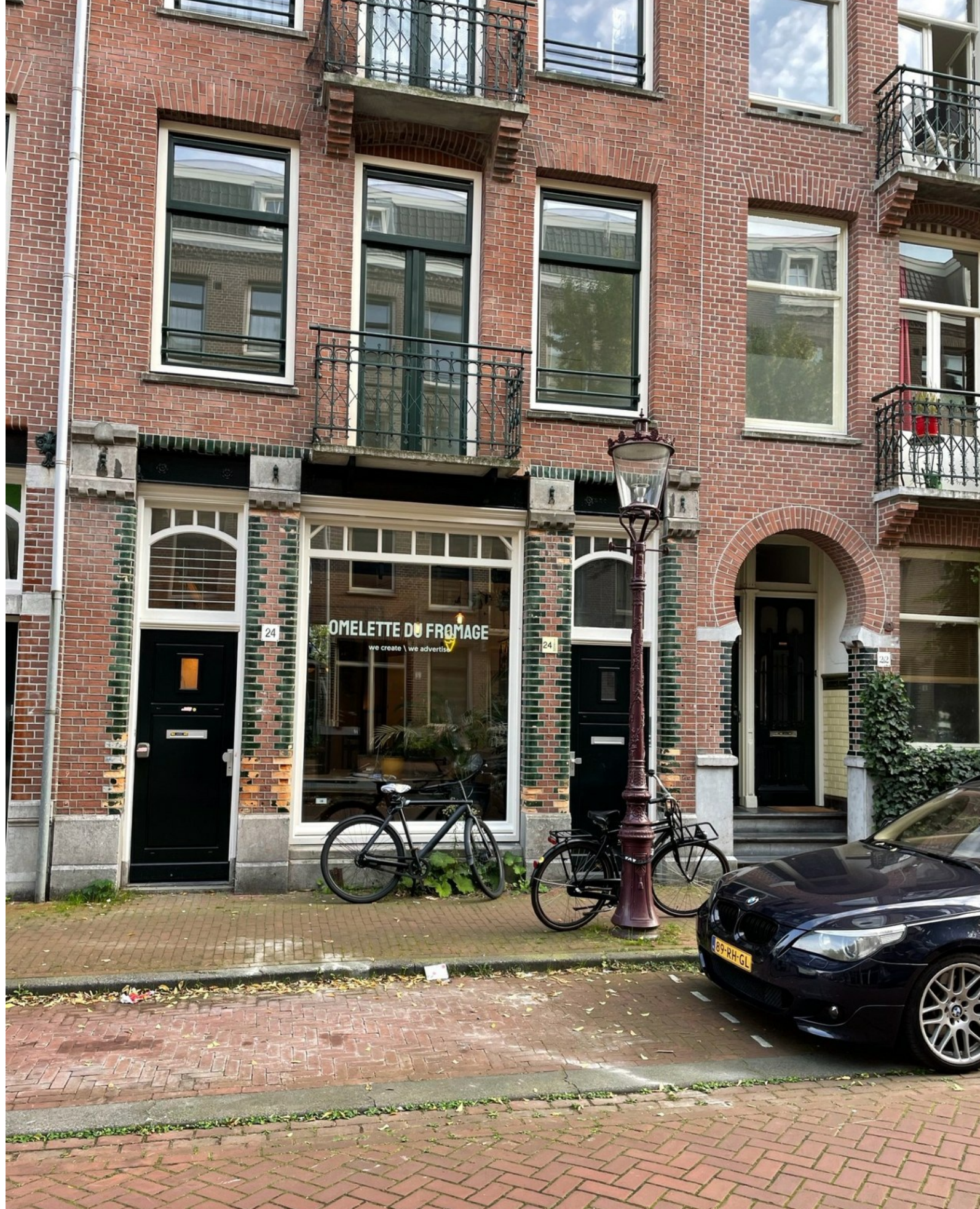
Tweede Atjehstraat 24-1