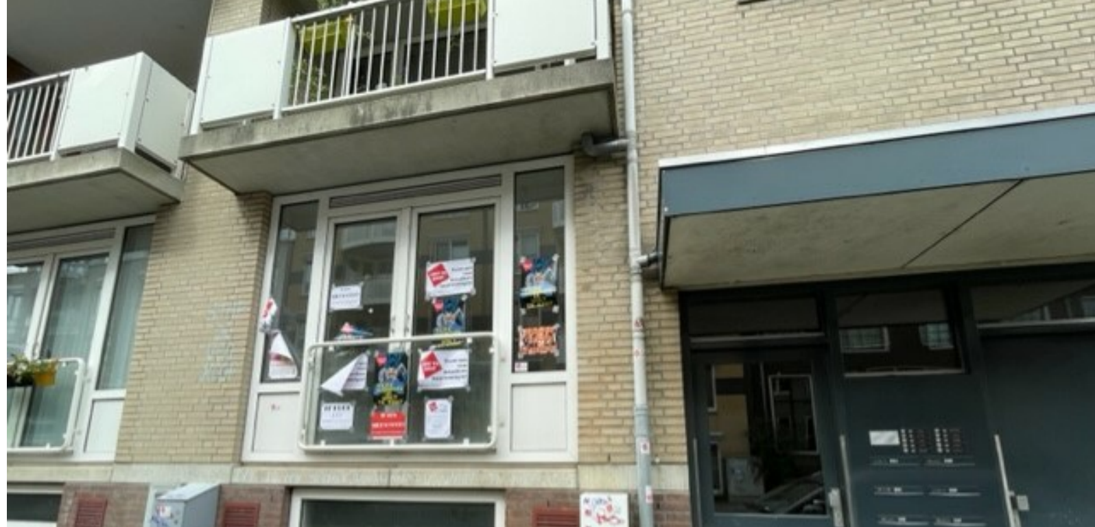
Twee weken geleden was de flitsactie (actie 139) op de Hoogte Kadijk. Donderdag 10 augustus hingen de affiches er nog altijd. Heel goed voor de publiciteit. Er fietsen daar heel wat mensen langs.