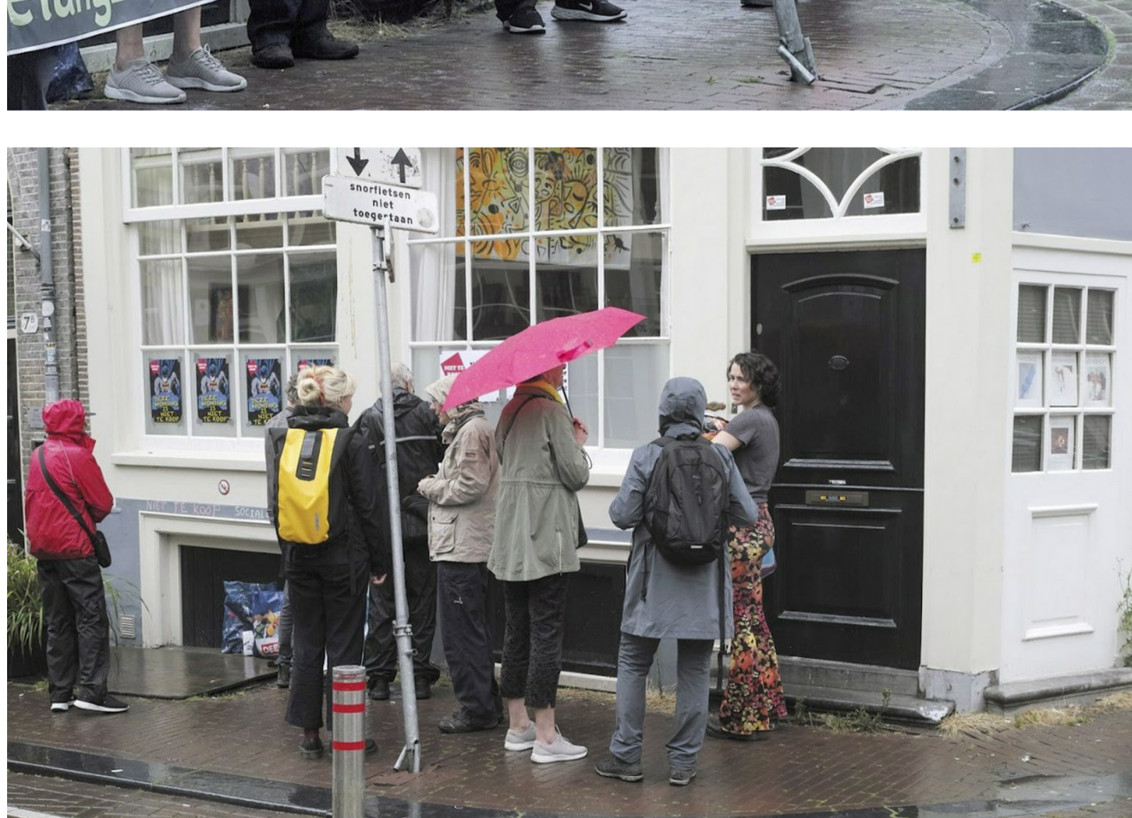
In gesprek met de er wonende anti-kraakster