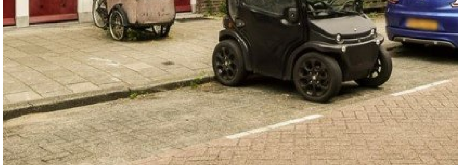
Op Funda is deze foto van Herculesstraat 46 geplaatst

Toegegeven: het gaat langzaam, maar wel gestaag.