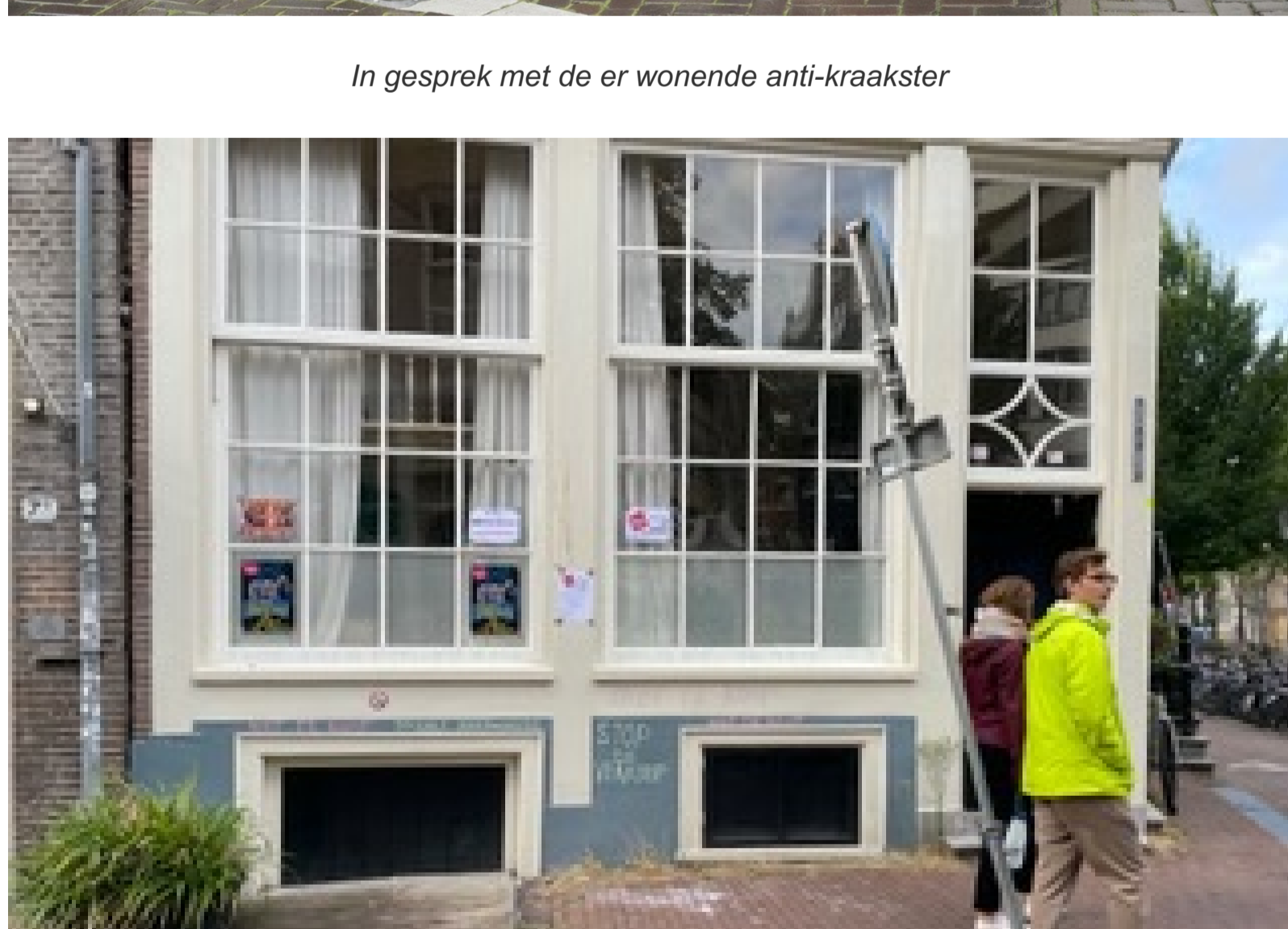
Een dag na de flitsactie zijn de meeste affiches verwijderd. Toch heeft de anti-kraakster wat laten zitten. Hulde!