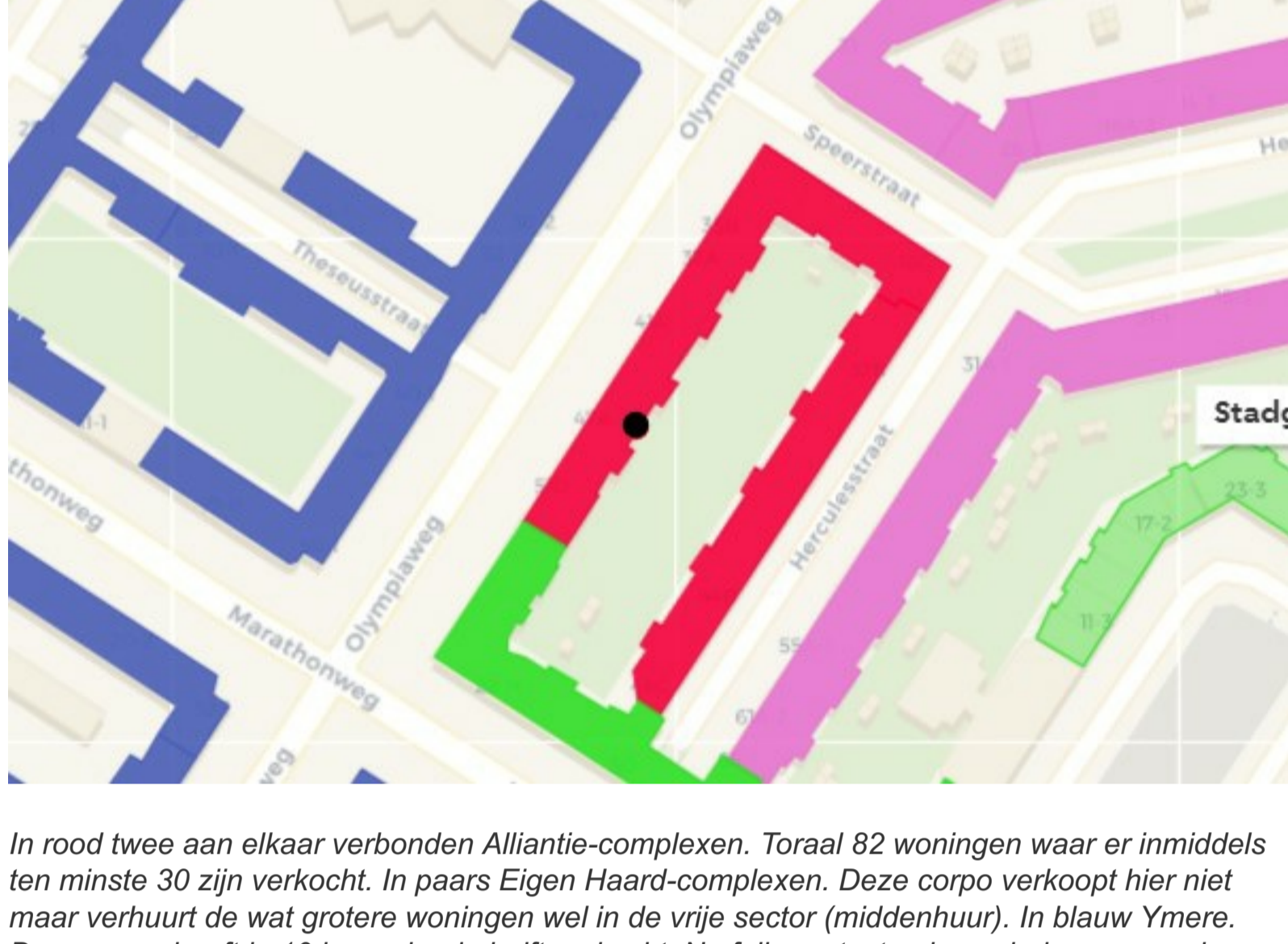
In rood twee aan elkaar verbonden Alliantie-complexen. Totaal 82 woningen waar er inmiddels ten minste 30 zijn verkocht. In paars Eigen Haard-complexen. Deze corpo verkoopt hier niet maar verhuurt de wat grotere woningen wel in de vrije sector (middenhuur). In blauw Ymere. Deze corpo heeft in 10 jaar ruim de helft verkocht. Na felle protesten is er sinds een paar jaar een verkoopstop. Alleen Stadgenoot (groen), verkoopt hier niet.

Leek het er even op dat de verkoopprijzen zouden inzakken en de woningen niet meer te slijfen, dit dipje is alweer voorbij. Huizen staan slechts enkele weken te koop, steeds vaker zie je de volgende tekst: "VANWEGE ENORME BELANGSTELLING IS HET MOMENTEEL NIET MOGELIJK OM EEN BEZICHTIGING IN TE PLANNEN. HET IS NOG WEL MOGELIJK OM OP DE RESERVELIJST GEZOEKT TE WORDEN (DOOR EEN ONLINE BEZICHTIGINGSVERZOEK TE DOEN), WE NEMEN DAN CONTACT OP ZODRA ER EEN PLEK VRIJ IS GEKOMEN."