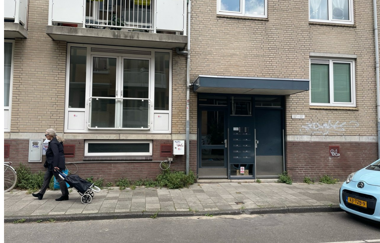
Hoogte Kadijk 69A

In rood Alliantie-complexen. Het complex waar nu uit wordt verkocht telt 21 woningen waarvan nog 12 in corpo-bezit. U ziet, het complex bevindt zich luttele meters van het Entrepotdok waar de verkoop voorlopig is stilgelegd.