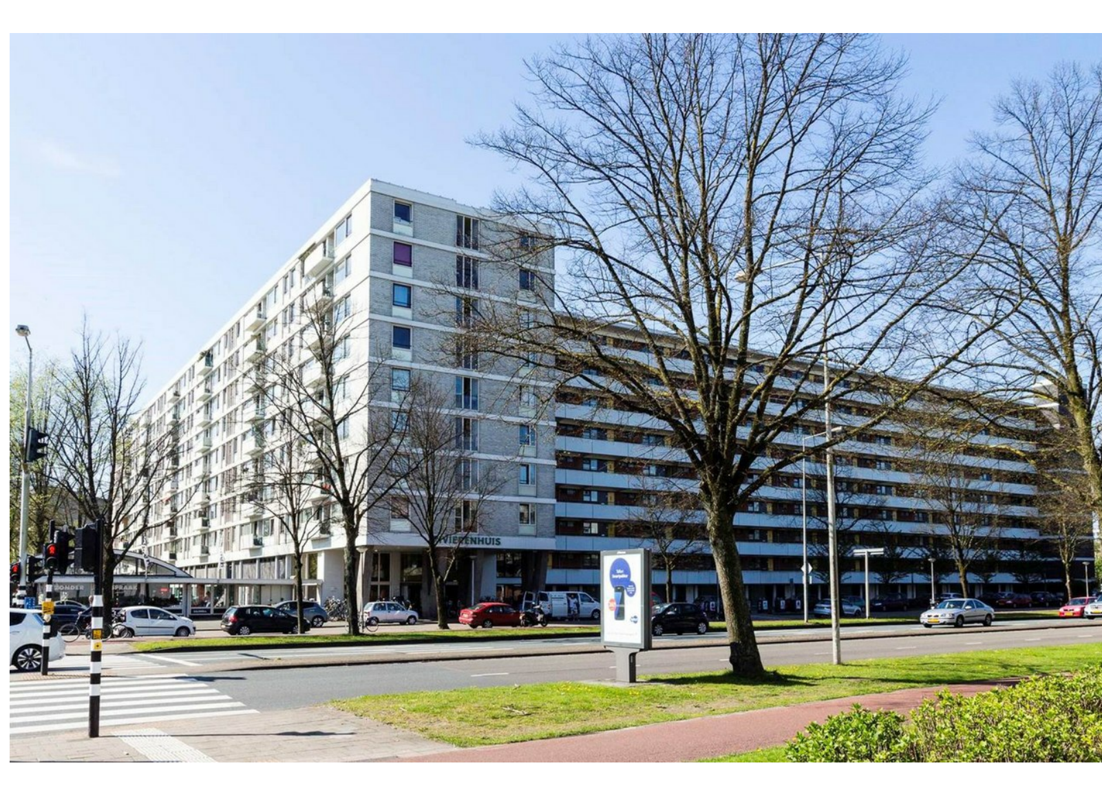
Het Rivierenhuis aan de President Kennedylaan-De Mirandalaan