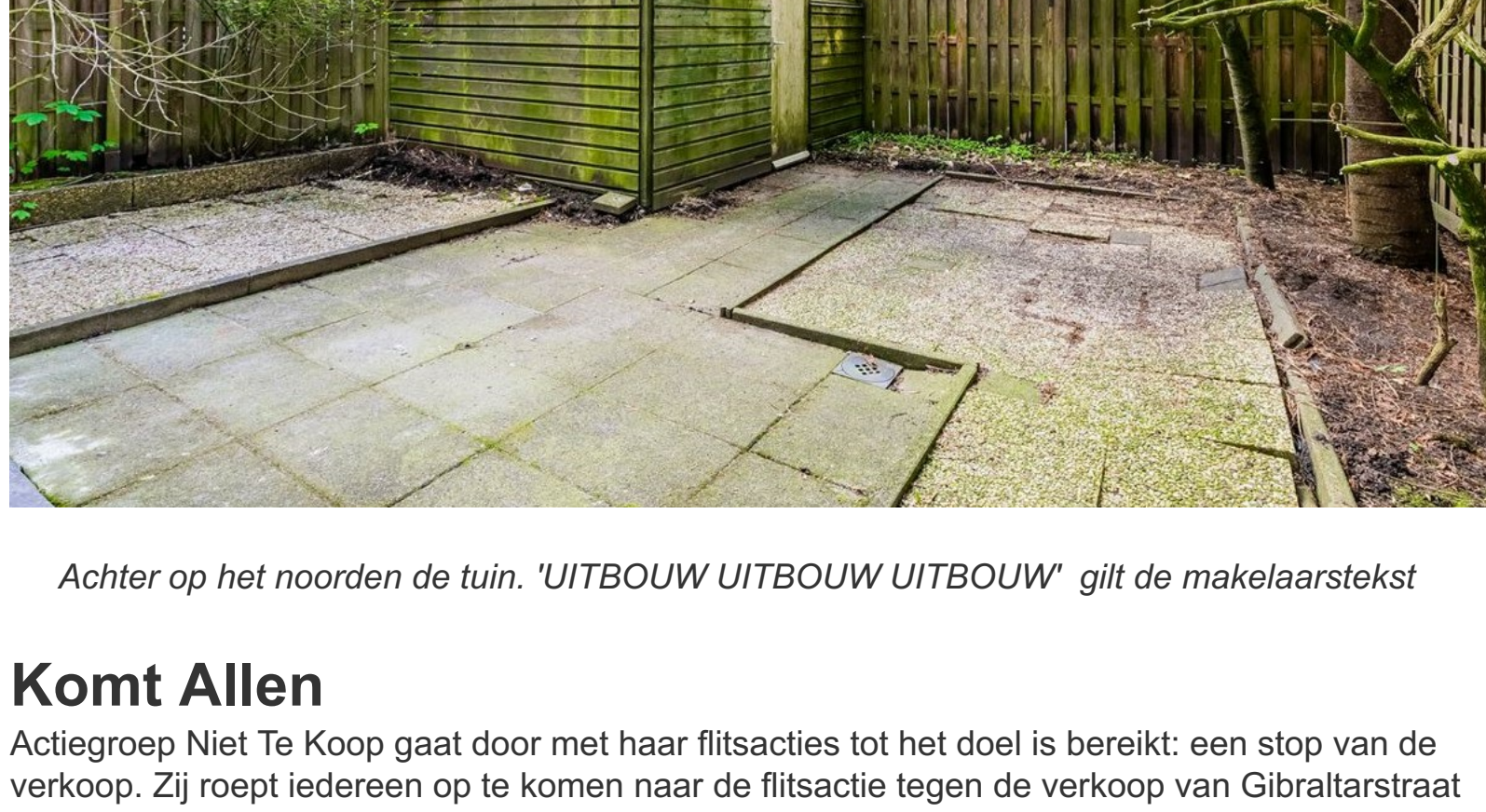
Achter op het noorden de tuin. 'UITBOUW UITBOUW UITBOUW' giilt de makelaarstekst