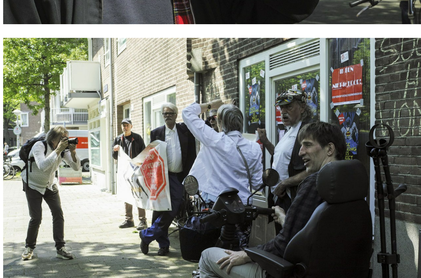
Links een persfotograaf van dagblad Trouw voor een reportage