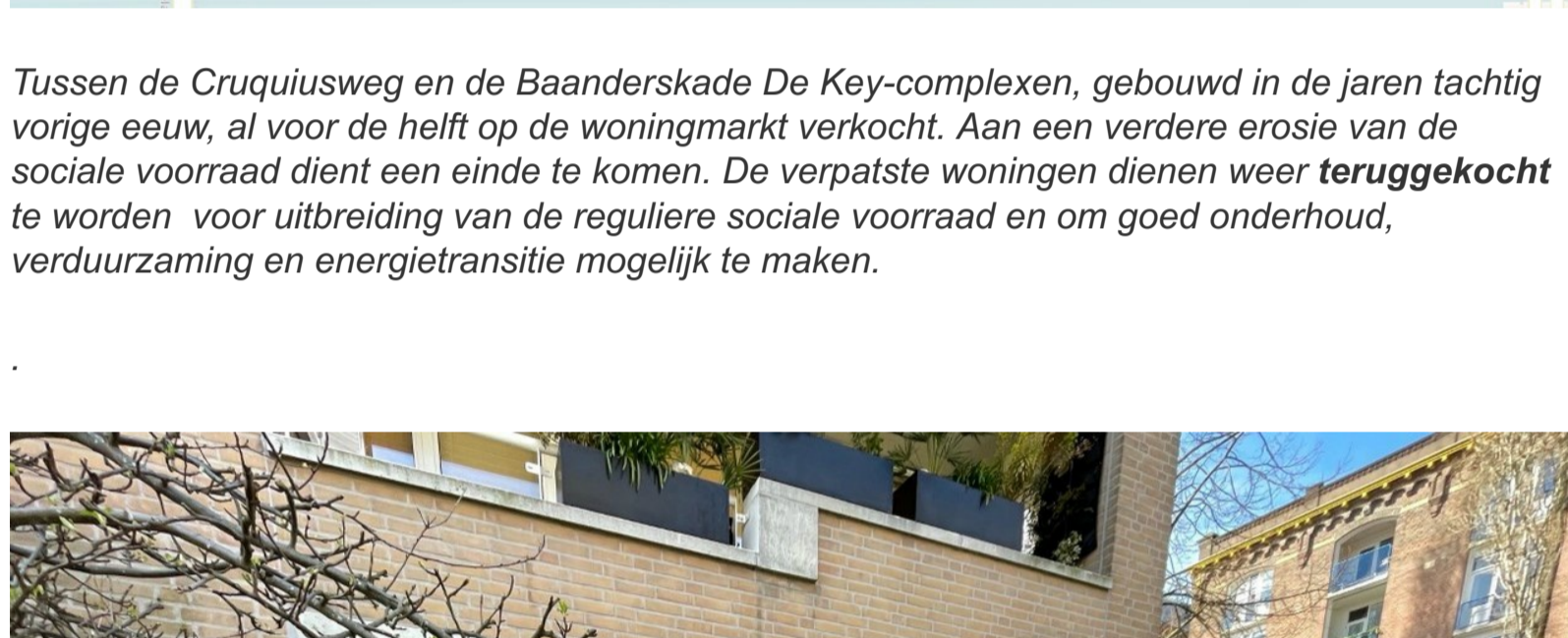
Tussen de Cruquiusweg en de Baanderskade De Key-complexen, gebouwd in de jaren tachtig vorige eeuw, al voor de helft op de woningmarkt verkocht. Aan een verdere erosie van de sociale voorraad dient een einde te komen. De verpatste woningen dienen weer teruggekoft te worden voor uitbreiding van de reguliere sociale voorraad en om goed onderhoud, verduurzaming en energietransitie mogelijk te maken.

Haar 125ste flitsactie (jubileumactie!) voert actiegroep Niet Te Koop naar de zogeheten 'architectenbuurt', Zeeburg, Oost, waar onze geliefde De Key de benedenwoning H.J.M.Walenkampstraat 75-huis te koop heeft aangeboden voor €325.000. De verkoop van sociale woningen moet stoppen. De nieuwbouw schiet zoals beschreven nu al te kort, alle voortekenen wijzen erop dat dat alleen maar erger wordt. Of de Staat moet het heft in eigen hand nemen door zelf de nieuwbouw van sociale woningen te financieren.