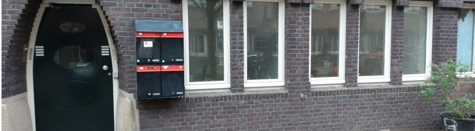
Bestevæerstraat 133-huis. Met invalideparkeerbord!