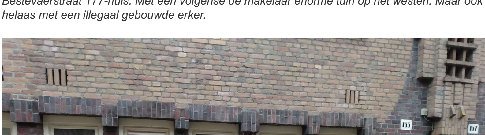
Bestevæerstraat 177-huis. Met een volgnese de makelaar enorme tuin op het westen. Maar ook helaas met een illegaal gebouwde erker.