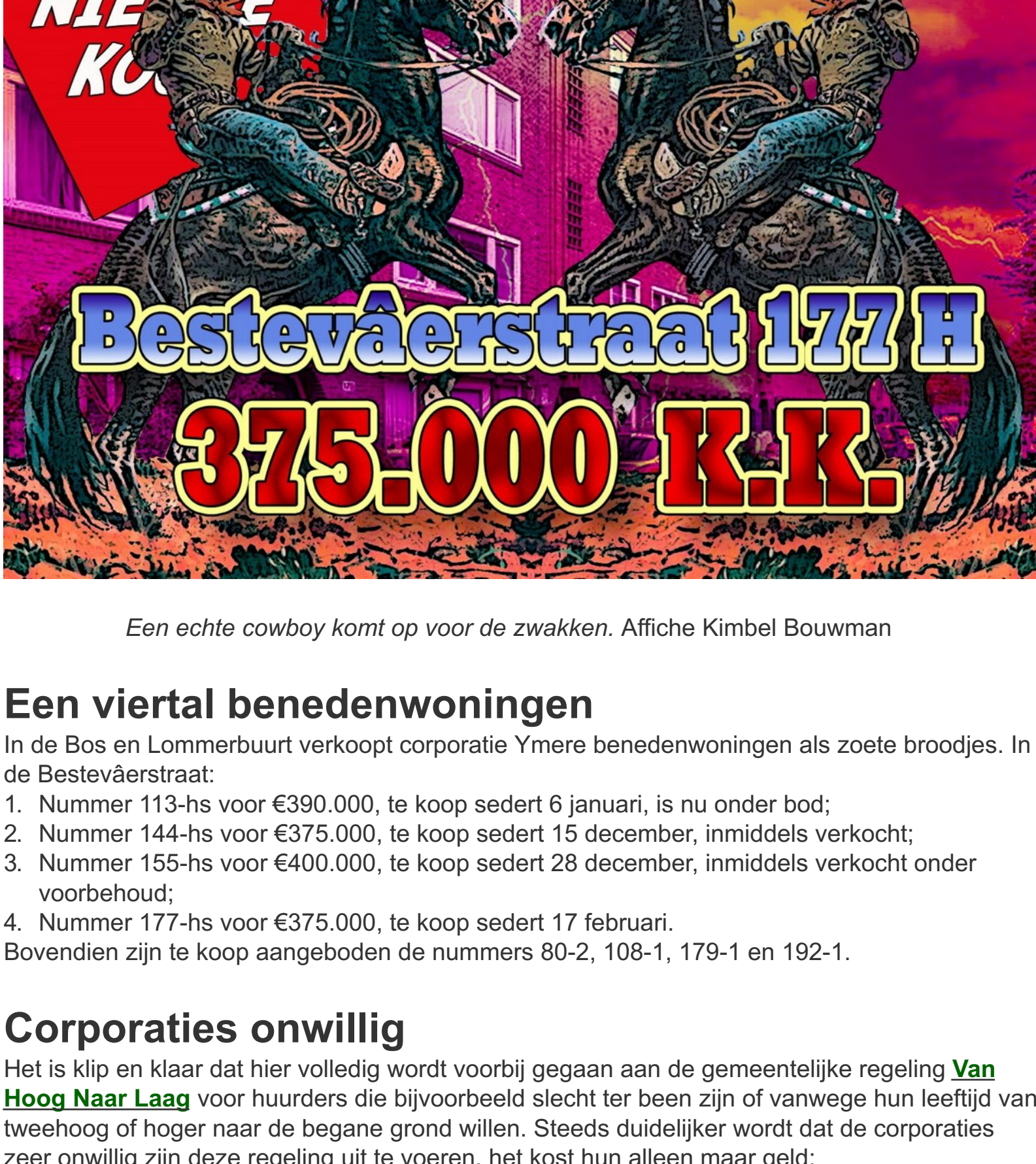
Een echte cowboy komt op voor de zwakken. Affiche Kimbel Bouwman