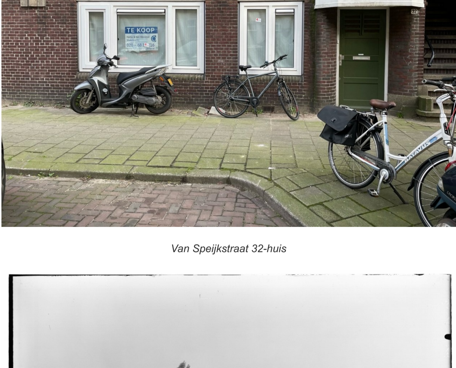
Van Speijkstraat 32-huis

De zogeheten 'Chassébuurt' kent heel veel Ymere-vastgoed (alles in blauw). Maar van het complex waar deze corpo nu nummer 32-huis te koop heeft aangeboden, zijn er al 23 van de 60 verkocht. Moet de rest dan ook weg, vraag je je af.