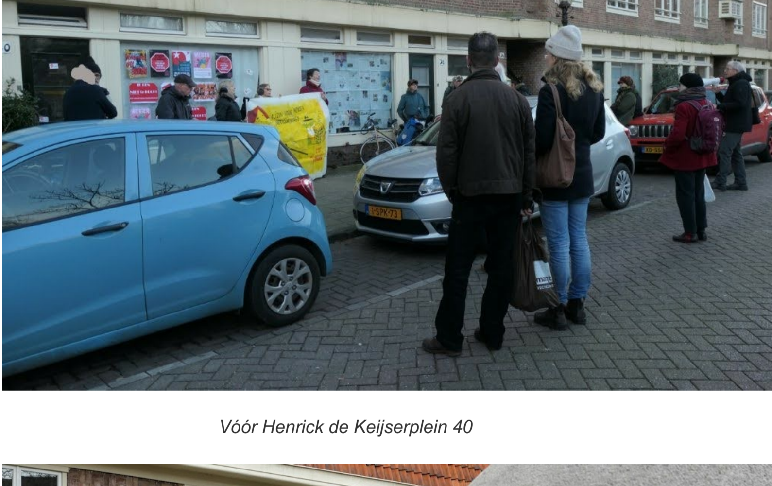
Vóór Henrick de Keijserplein 40