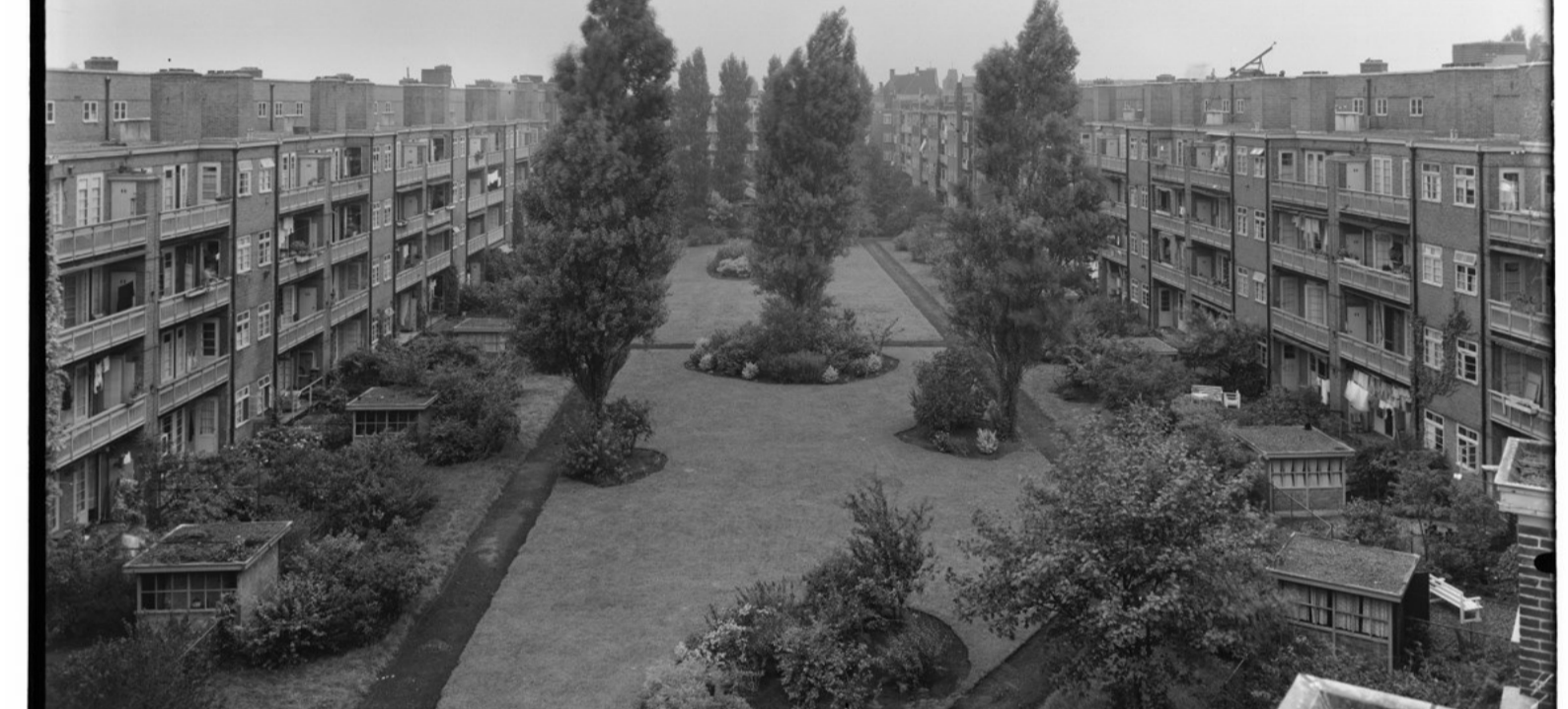
Binnentuin blok Van Speijkstraat-Baarsjesweg-Chasséstraat-Van Kinsbergenstraat Beeldbank Amsterdam, sep 1942