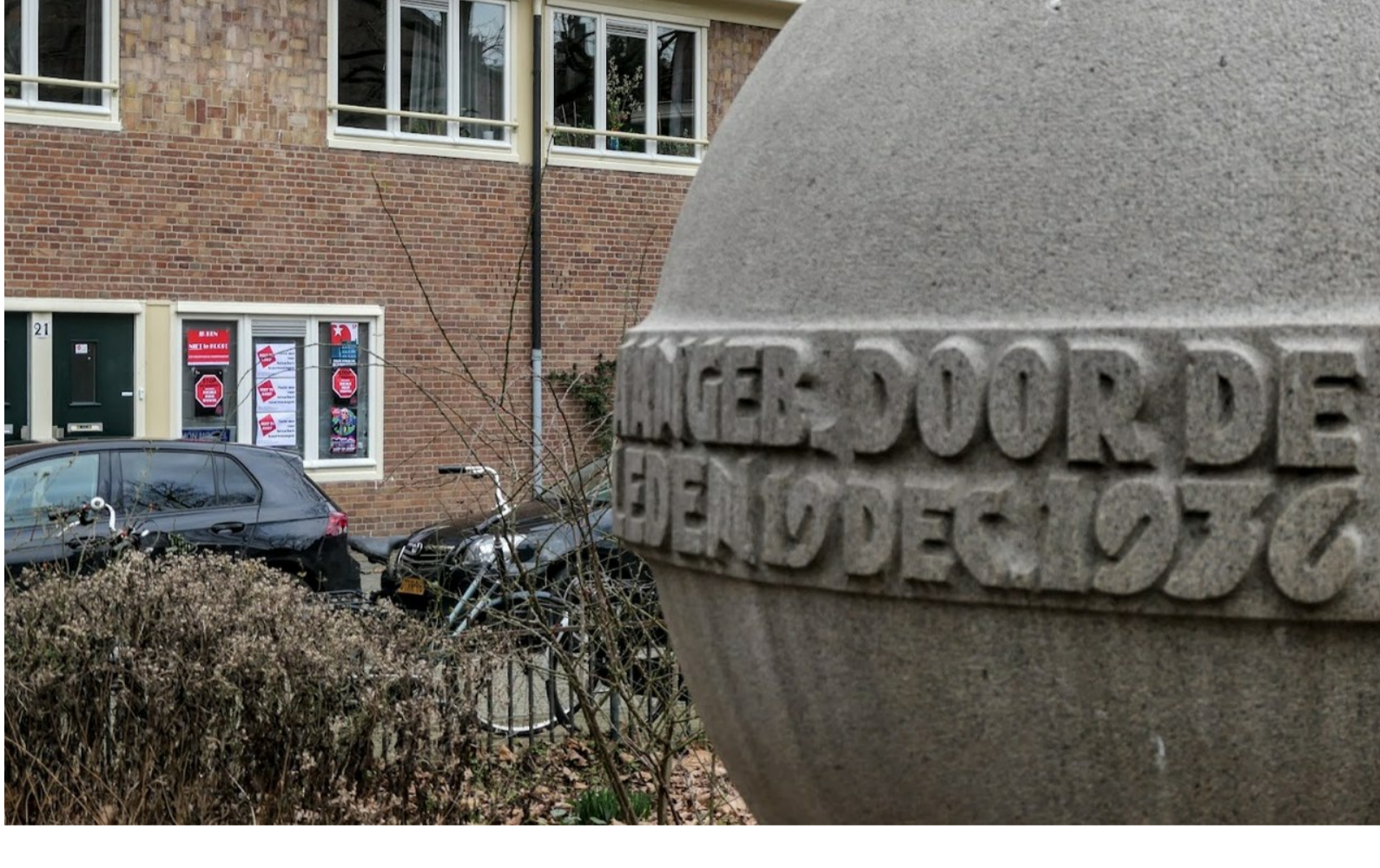
Plakwerk Coöperatiehof 21-huis