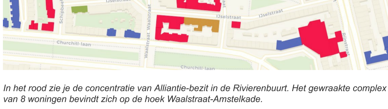
In het rood zie je de concentratie van Alliantie-bezit in de Rivierenbuurt. Het gewraakte complex van 8 woningen bevindt zich op de hoek Waalstraat-Amstelkade.

De corporaties renoveren voor verkoop?! En wat blijft er over voor zittende huurders? Schimmel en zwam in energielabel G woningen.