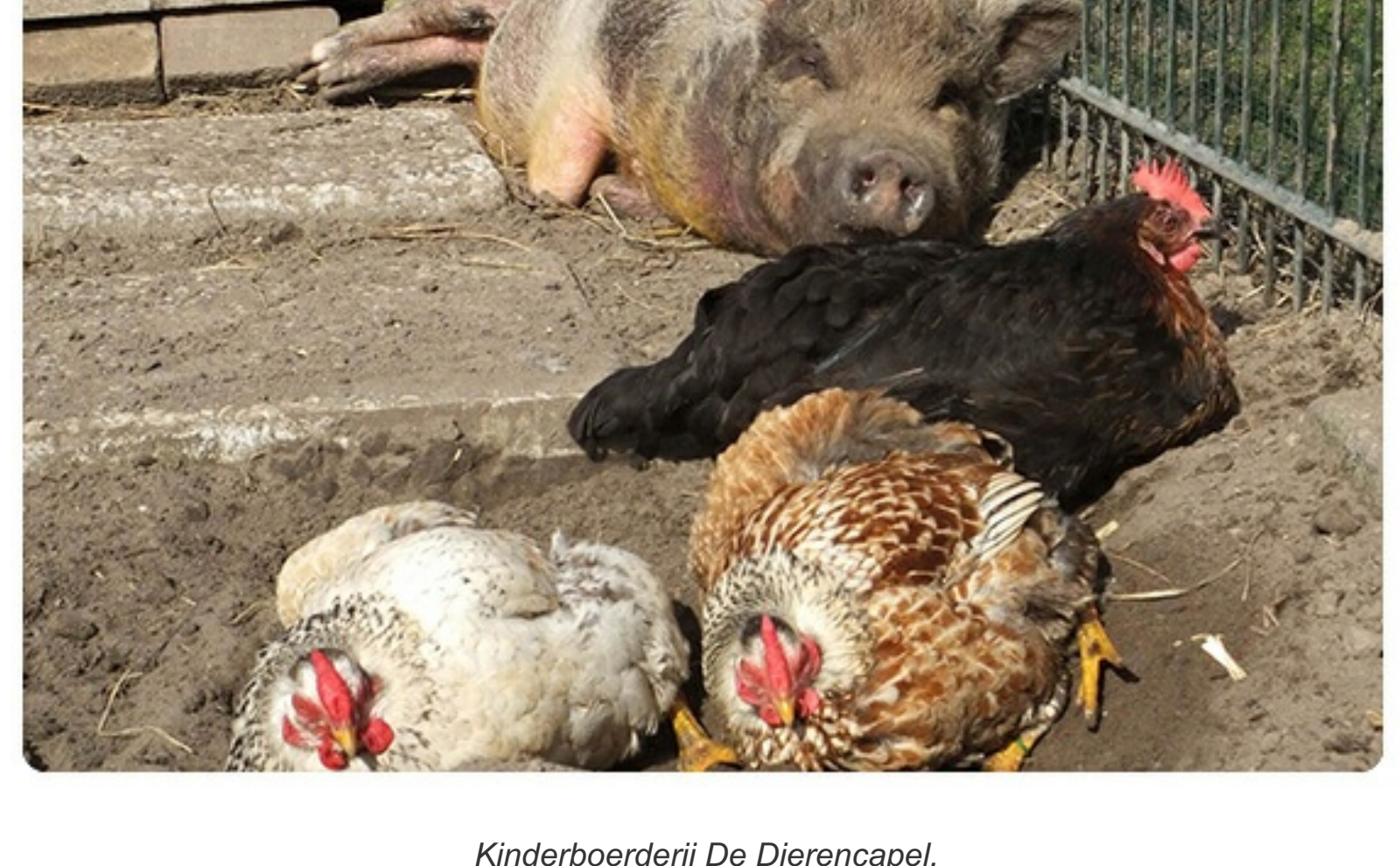
Kinderboerderij De Dierencape.

Het Paul de Ley-complex, opgeleverd in 1982, aan de Hollandse Tuinkant