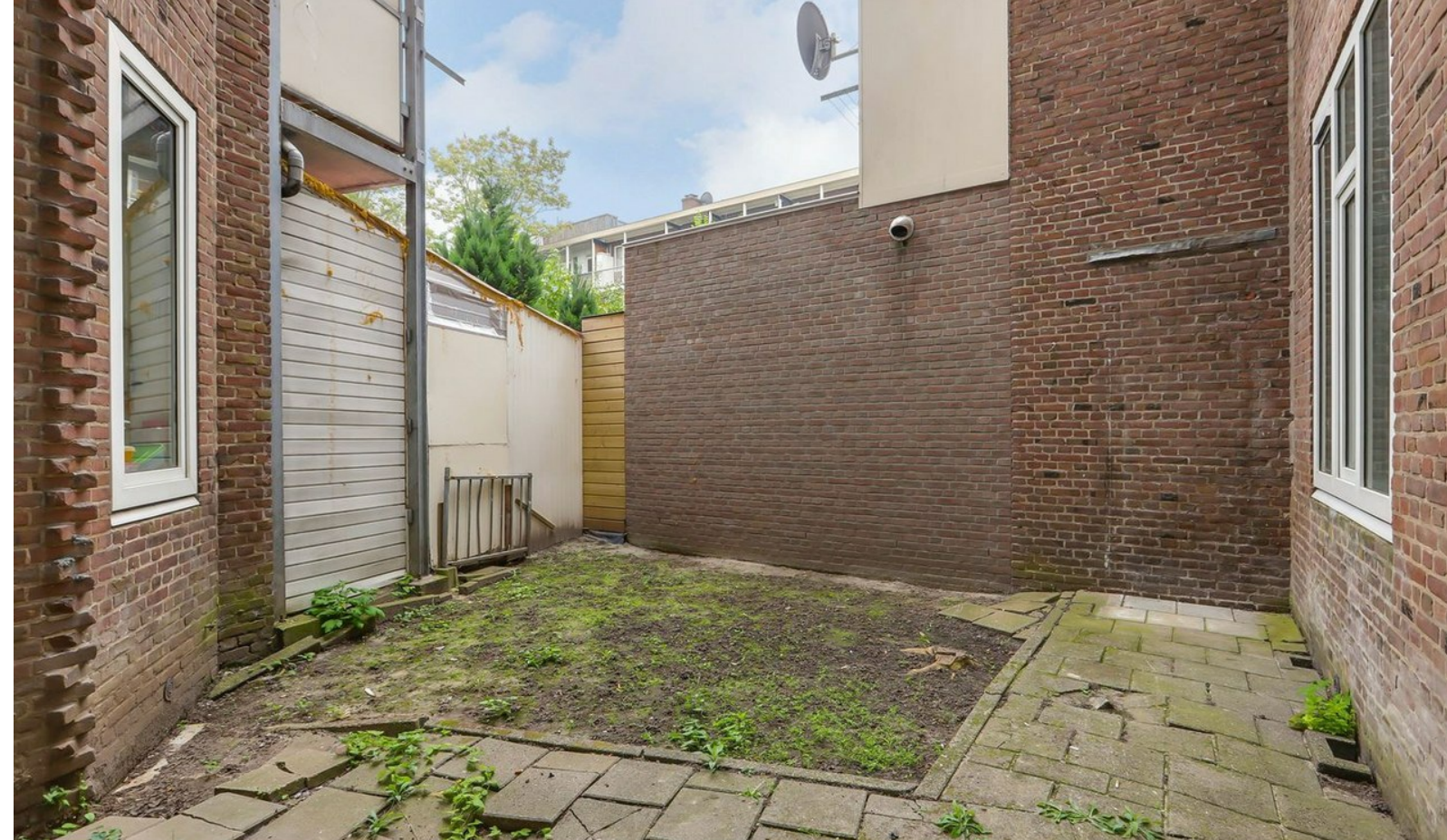
Makelaarstekst: 'Riante tuin gelegen op het Zuiden'.