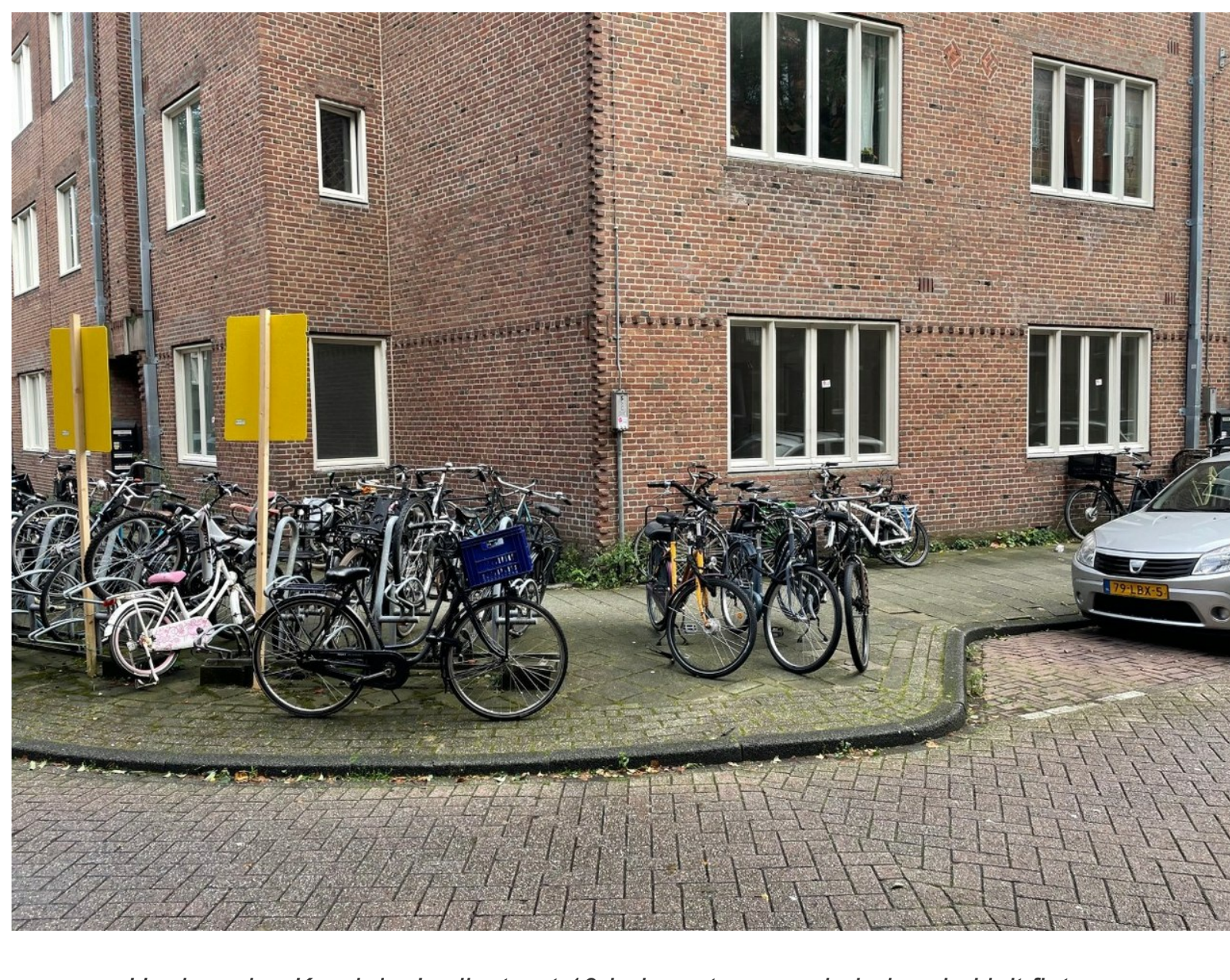
Hoekwoning Karel du Jardinstraat 10-huis met ervoor de bekende kluit fietsen.

In blauw het Ymere-complex, een ware uitpopping vindt plaats. Elk jaar drie à vier woningen. Tabel geeft stand verkoop per 1-1-2021.