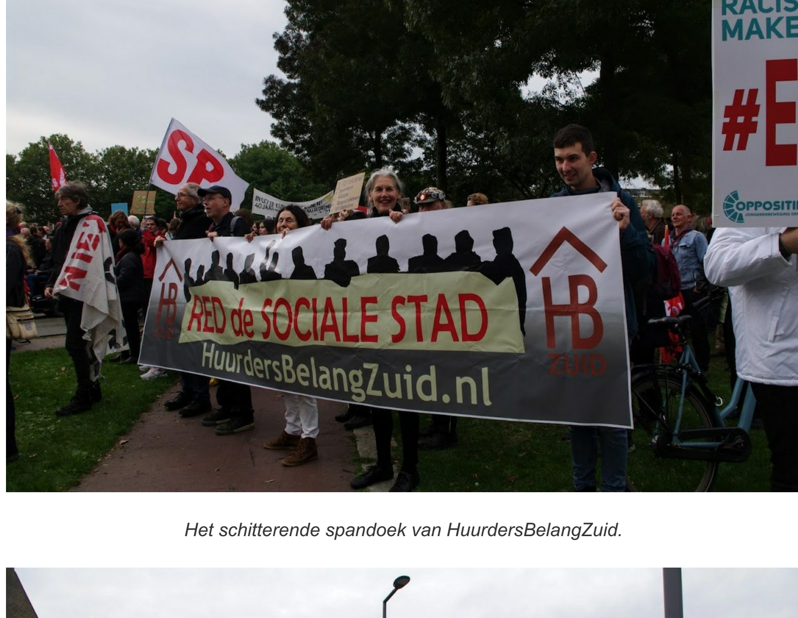
Het schitterende spandoek van HuurdersBelangZuid.