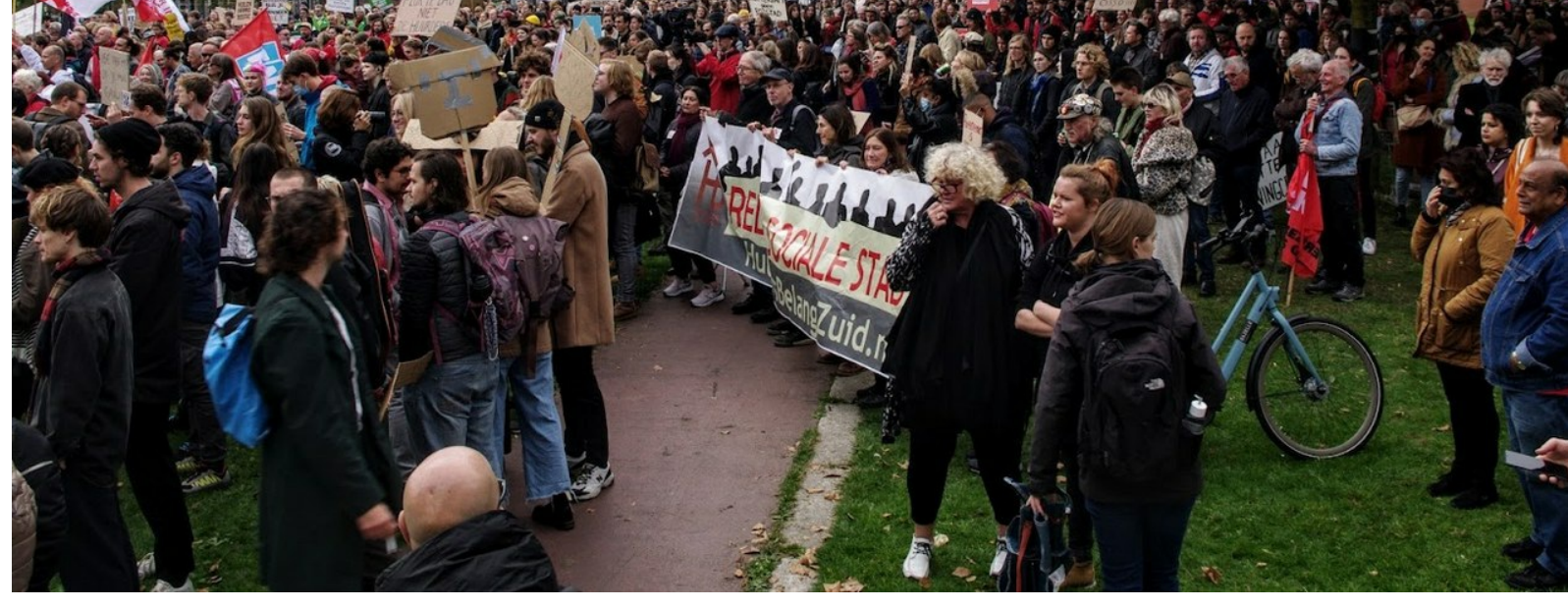
Vanuit het hele land waren er bussen gekomen, gehoopt werd op minimaal 15.000 betogers. Het werden er ongeveer de helft. Jammer, maar de stemming was goed en strijdbaar. Toch lijkt het besef te ontbreken dat met massale acties best wel wat te bereiken valt.