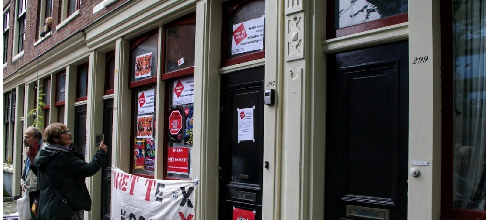
Grote Bickersstraat 297-huis beplakt