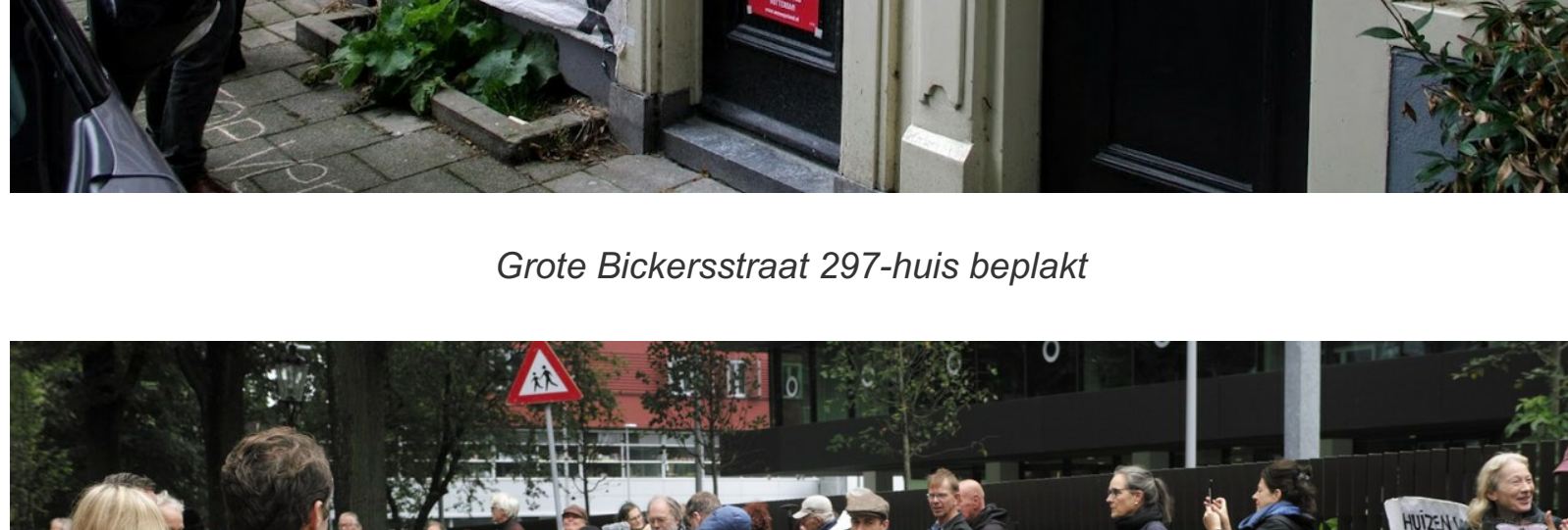
Gentrificatie ten top