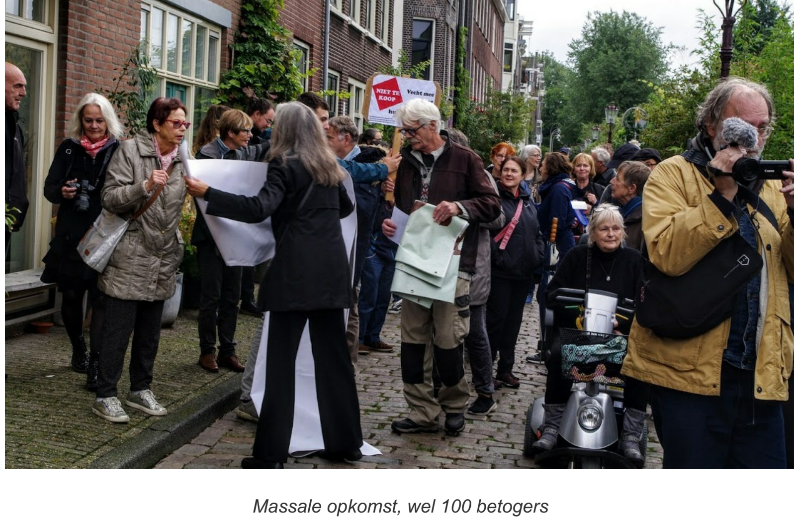
Massale opkomst, wel 100 betogers

Van de flitsactie is een reportage gemaakt door Het Parool . Opnamen zijn gemaakt door Knooppunt TV (film van 10 minuten), Vicky Forster en Allard Lanson . Hieronder een selectie.