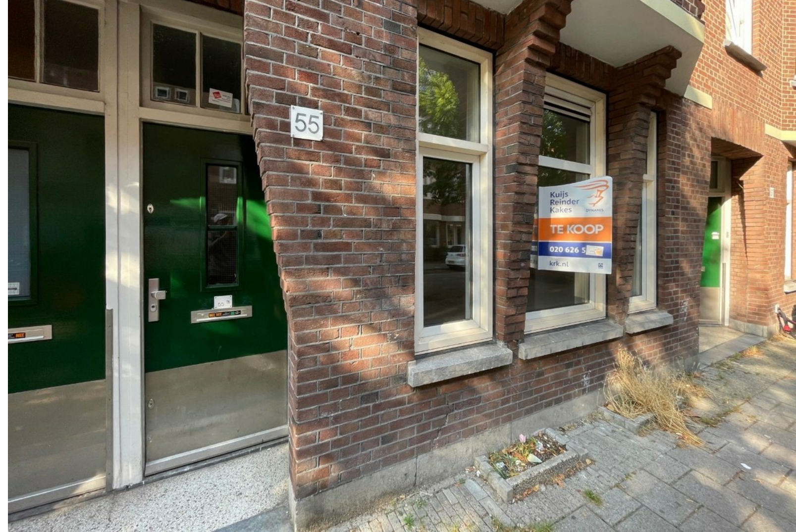
Lutmastraat 55-huis met inmiddels een Niet Te Koop-sticker op het makelaarsbord.