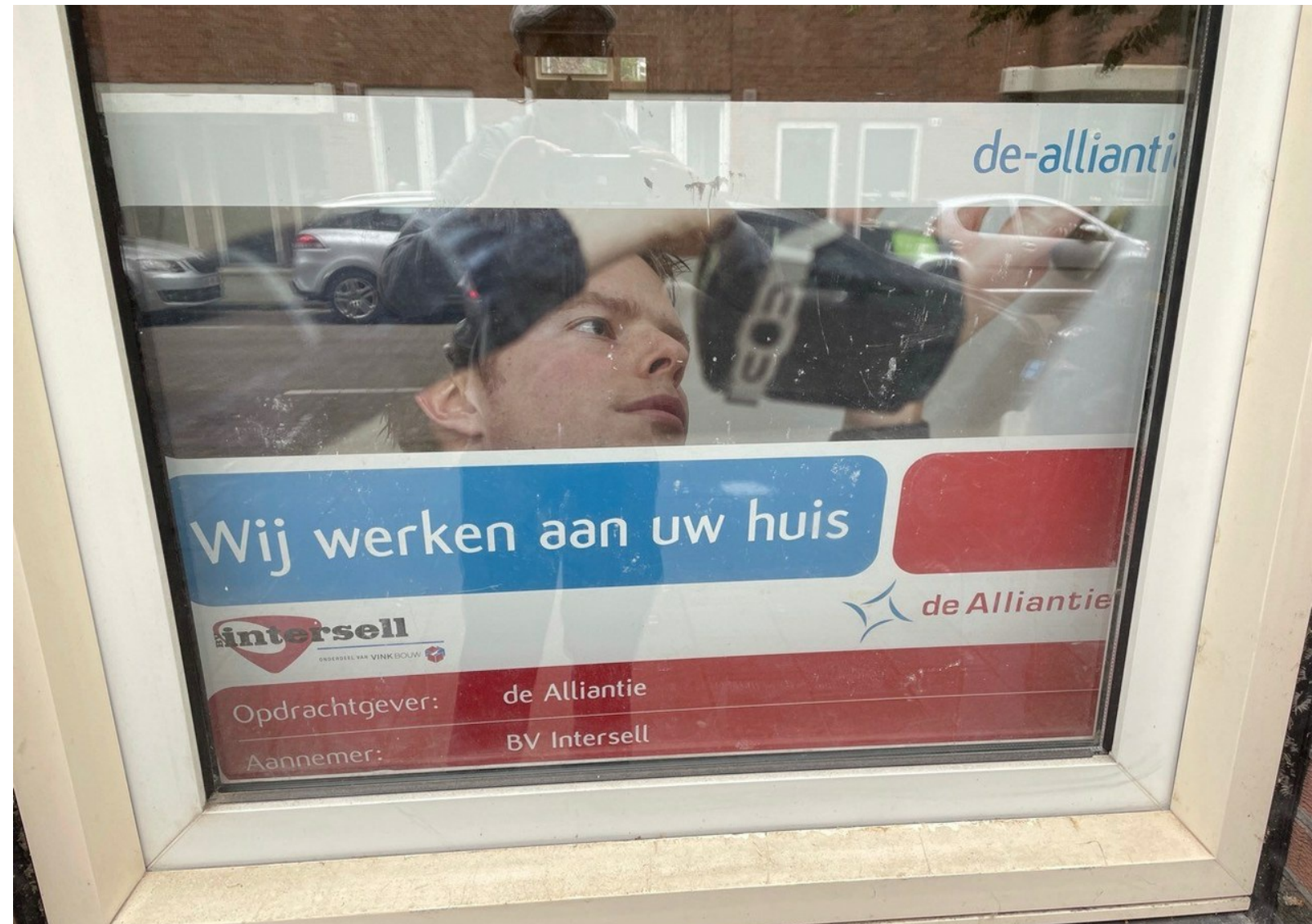
Opname gemaakt toen de Alliantie bezig was Lutmastraat 55-huis verkoopklaar te maken. Op het bord moet volgens ons staan: 'Wij werken aan uw koop huis'.