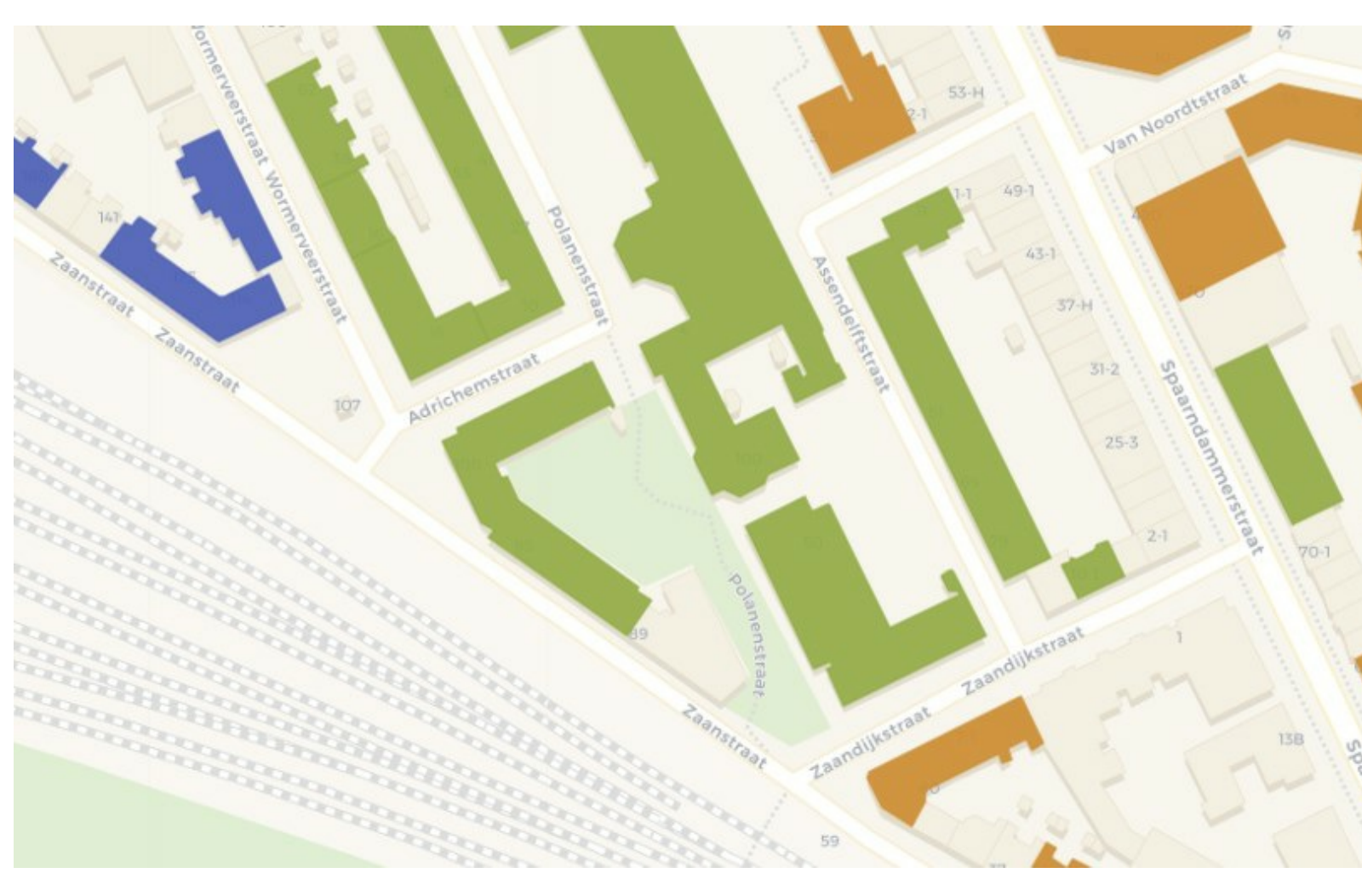
In groen Rochdale-bezit. De corpo heeft er nog niet veel van verkocht, maar het begin is er.

Ook werken de gemeente en woningcorporaties er hard aan om een goed beeld te krijgen van de voorraad rolstoelwoningen. Daarnaast hebben ze een afspraak gemaakt om in principe geen rolstoelwoningen meer te verkopen. En gaan ze kijken naar de nieuwbouwopgave voor rolstoelwoningen.'