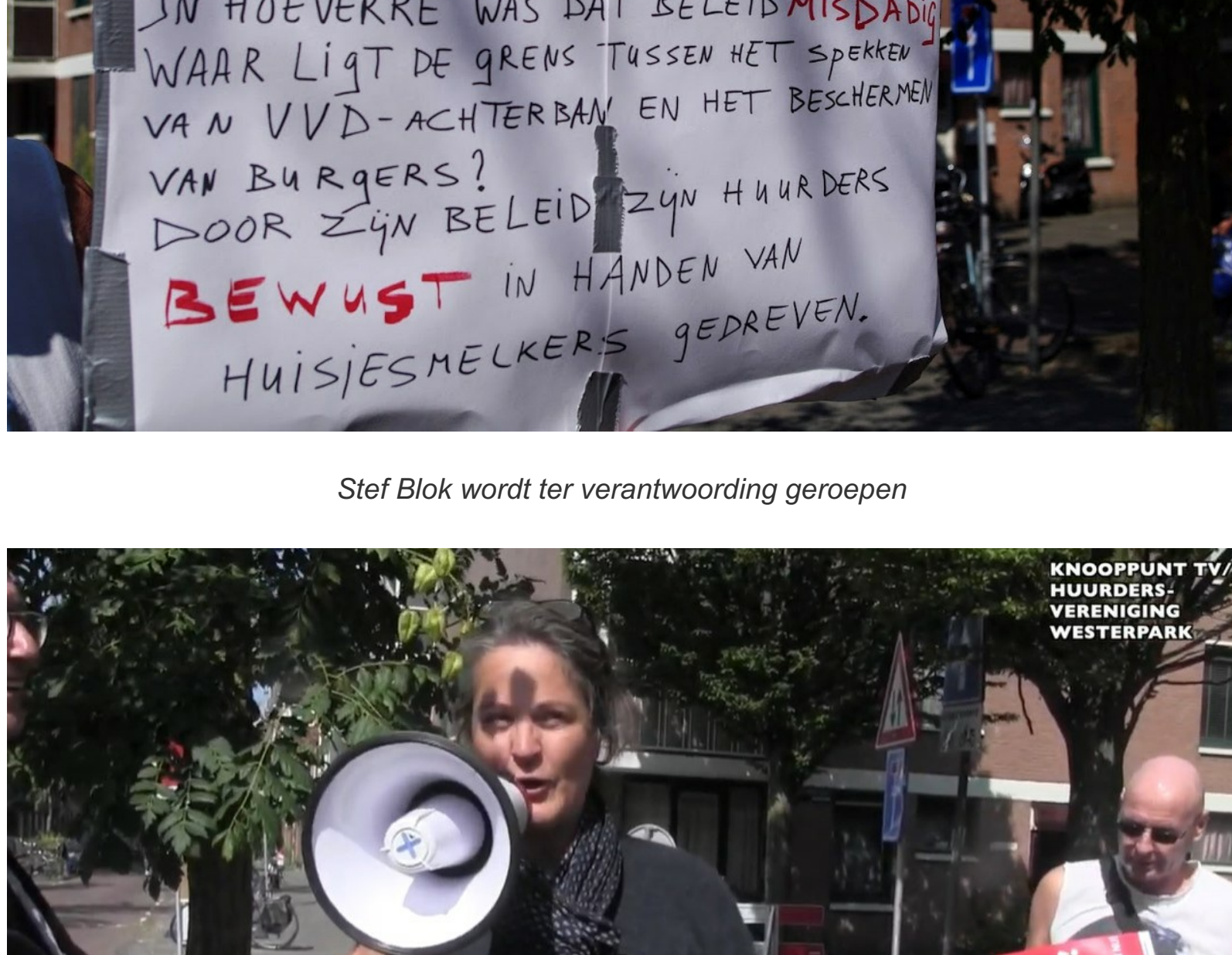
Stef Blok wordt ter verantwoording geroepen