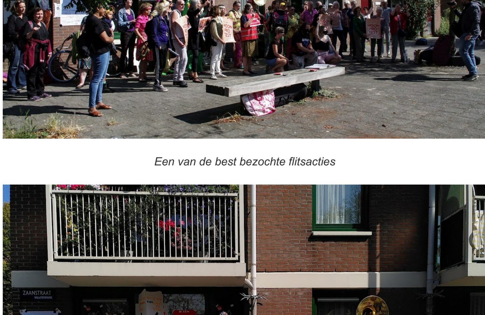
Een van de best bezochte flitsacties

Meer dan 40 mensen deden dit keer mee aan de actie. Het was razendgezellig. Opvallend was weer de grote bijval van burens. AT5 maakte een reportage , Herman Melkman, Allard Lason en Knooppunt TV maakten opnamen. Hier een impressie: