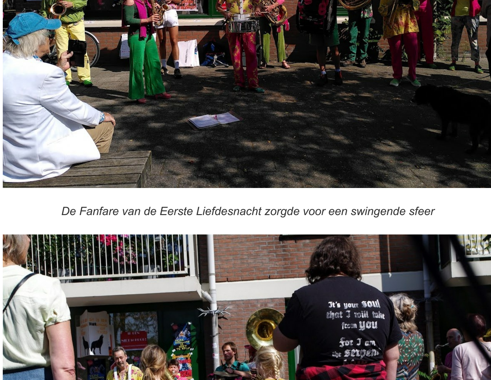
De Fanfare van de Eerste Liefdesnacht zorgde voor een swingende sfeer