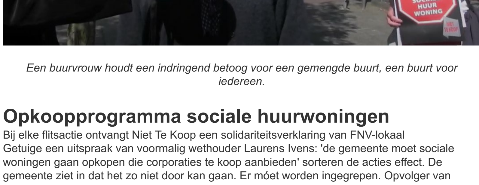
Een buurvrouw houdt een indringend betoog voor een gemengde buurt, een buurt voor iedereen.