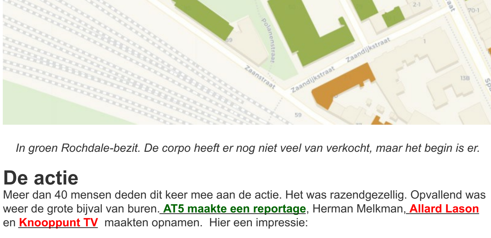
In groen Rochdale-bezit. De corpo heeft er nog niet veel van verkocht, maar het begin is er.

Ook werken de gemeente en woningcorporaties er hard aan om een goed beeld te krijgen van de voorraad rolstoelwoningen. Daarnaast hebben ze een afspraak gemaakt om in principe geen rolstoelwoningen meer te verkopen. En gaan ze kijken naar de nieuwbouwoopgave voor rolstoelwoningen.'