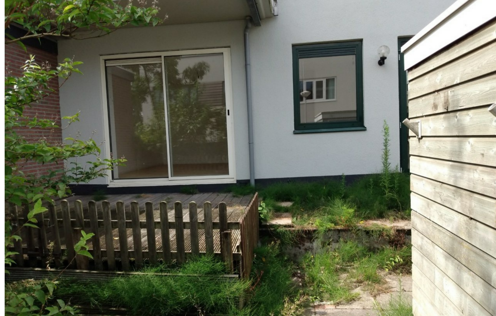
De andere kant van de woning geeft de mogelijkheid van uitbouw en zodoende waardevermeerdering.