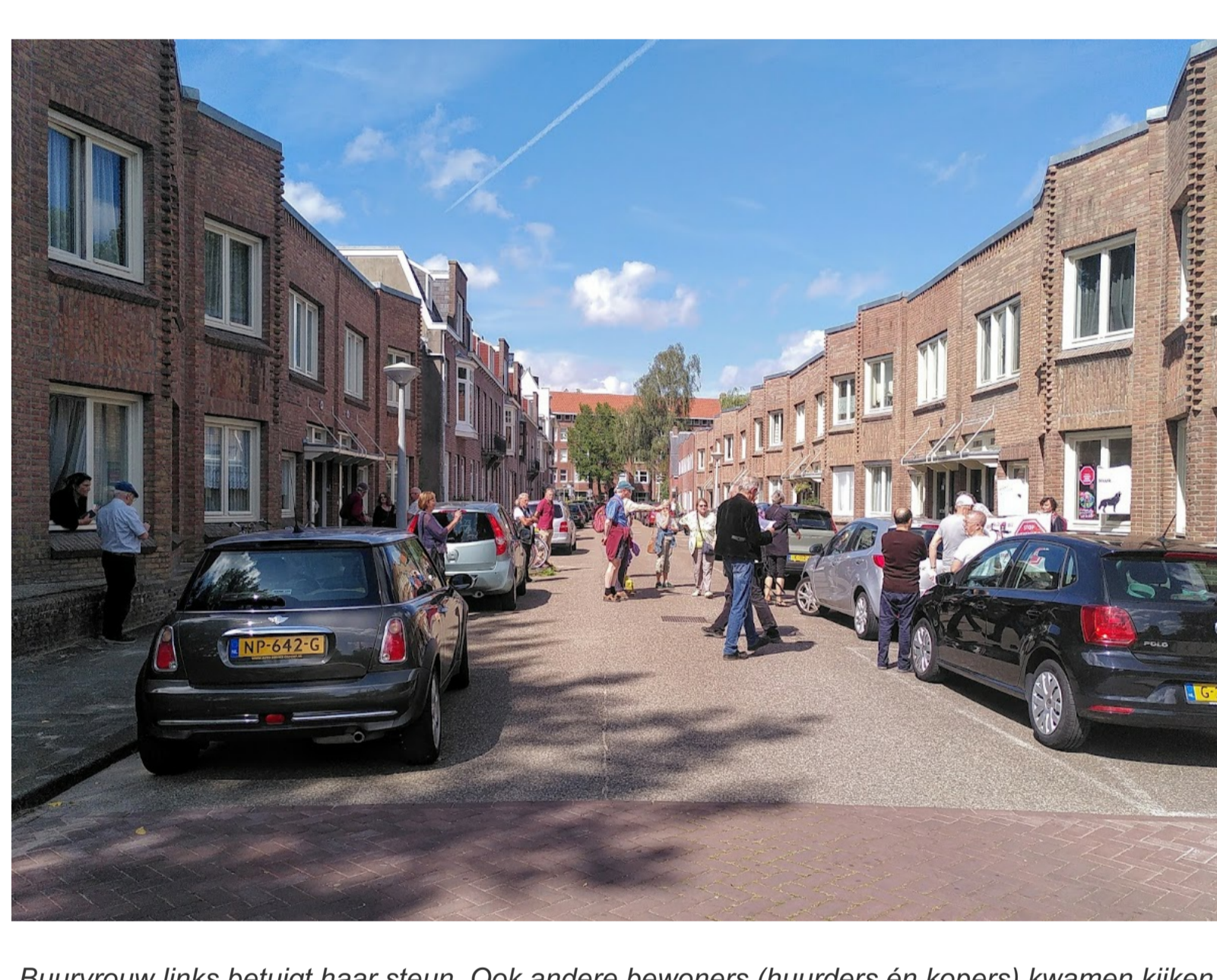
Buurvrouw links betuigt haar steun. Ook andere bewoners (huurders én kopers) kwamen kijken en stonden sympathiek tegenover onze actie.