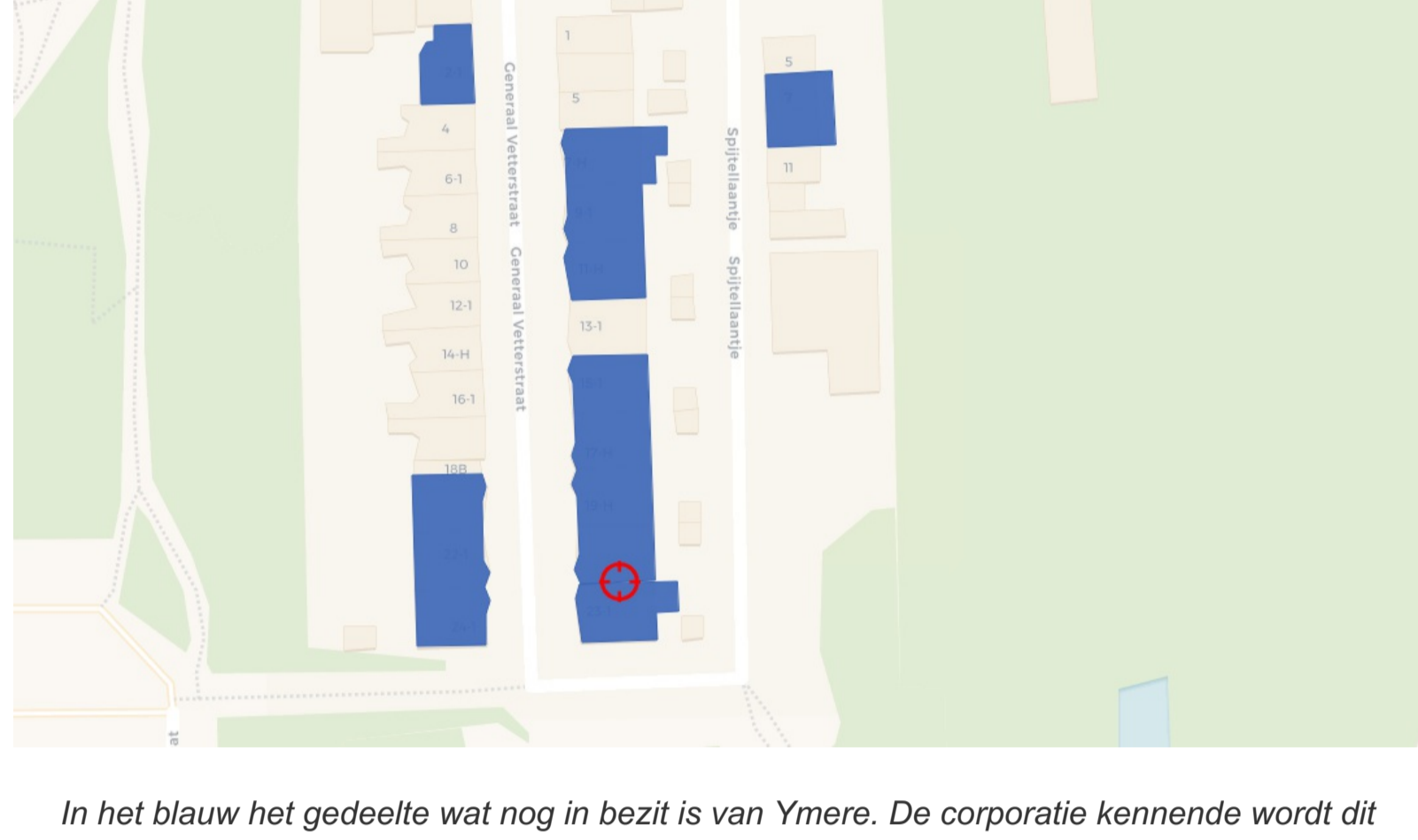
In het blauw het gedeelte wat nog in bezit is van Ymere. De corporatie kennende wordt dit publieke bezit in de nabije toekomst allemaal verkocht aan de hoogste private bidder.

Het geld gaat in ieder geval niet naar nieuwbouw in Zuid. In 2020 is geen enkele sociale huurwoning door corporaties opgeleverd, zo blijkt uit cijfers. Door corporaties zijn wel 93 sociale huurwoningen verkocht en 2 gekocht. Zie het Jaarbericht van de Amsterdamse Federatie Woning Corporaties. Gezien deze disbalans alleen al eist actiegroep Niet Te Koop dat het afgelopen moet zijn met dat verkopen. Eerst moet ervoor worden gezorgd dat de sociale voorraad op peil blijft.