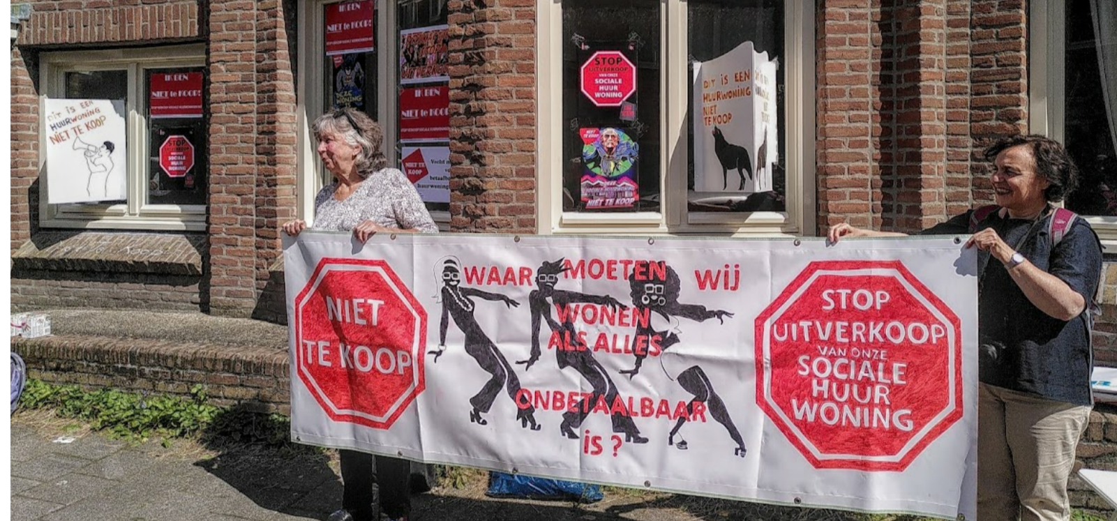
Het plakwerk en spandoek