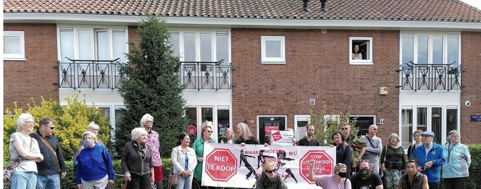
Grote opkomst, ook van de burens