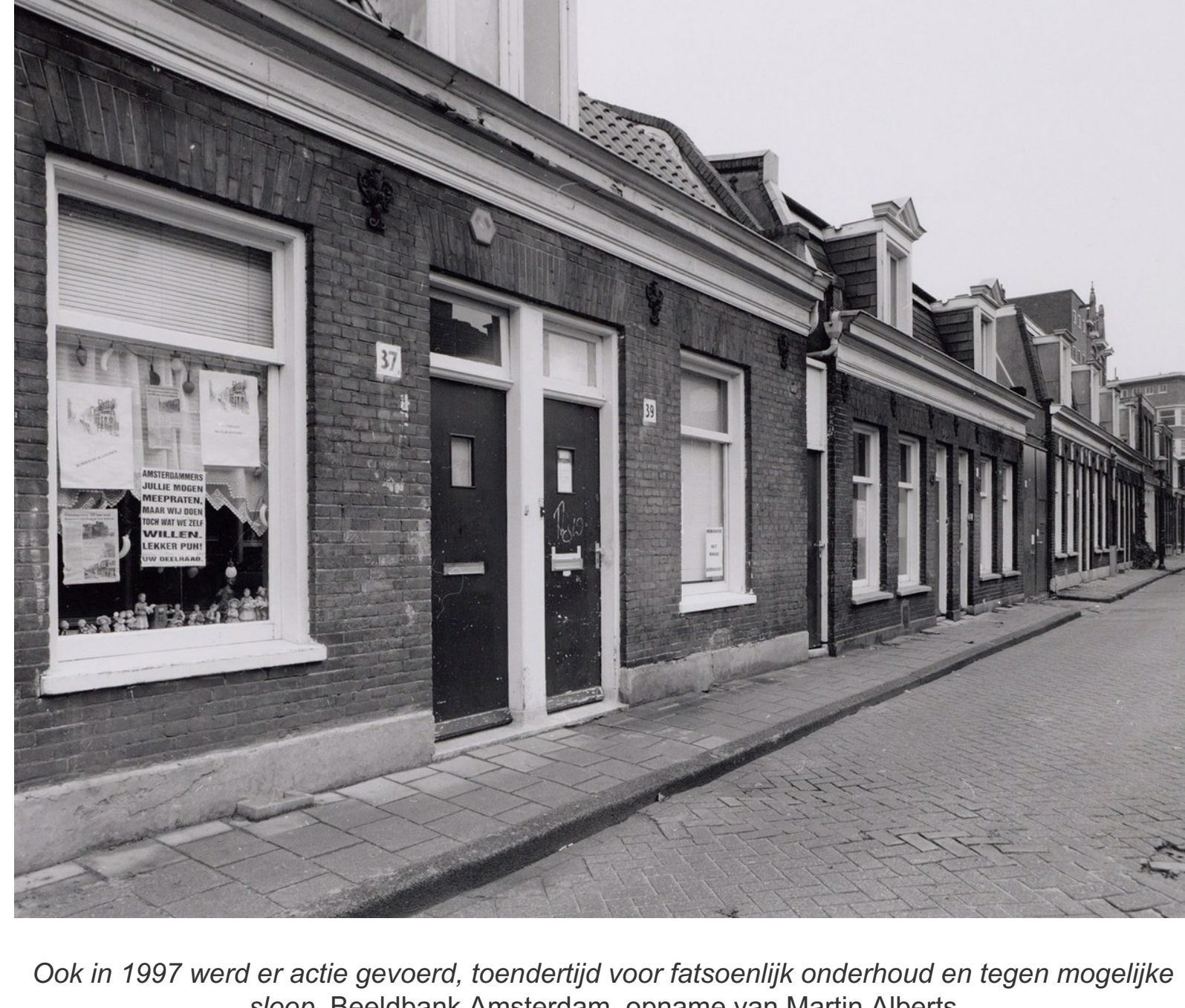
Ook in 1997 werd er actie gevoerd, toentertijd voor fatsoenlijk onderhoud en tegen mogelijke sloop. Beeldbank Amsterdam, opname van Martin Alberts