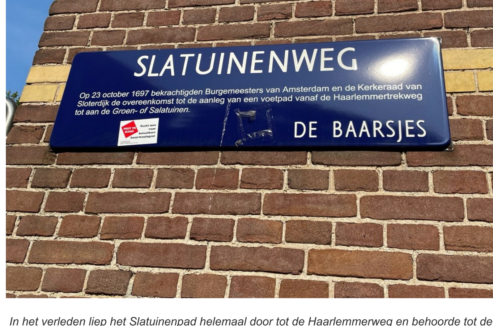
In het verleden liep het Slatuinenpad helemaal door tot de Haarlemmertrekweg en behoorde tot de gemeente Sloten, in 1921 geannexeerd.