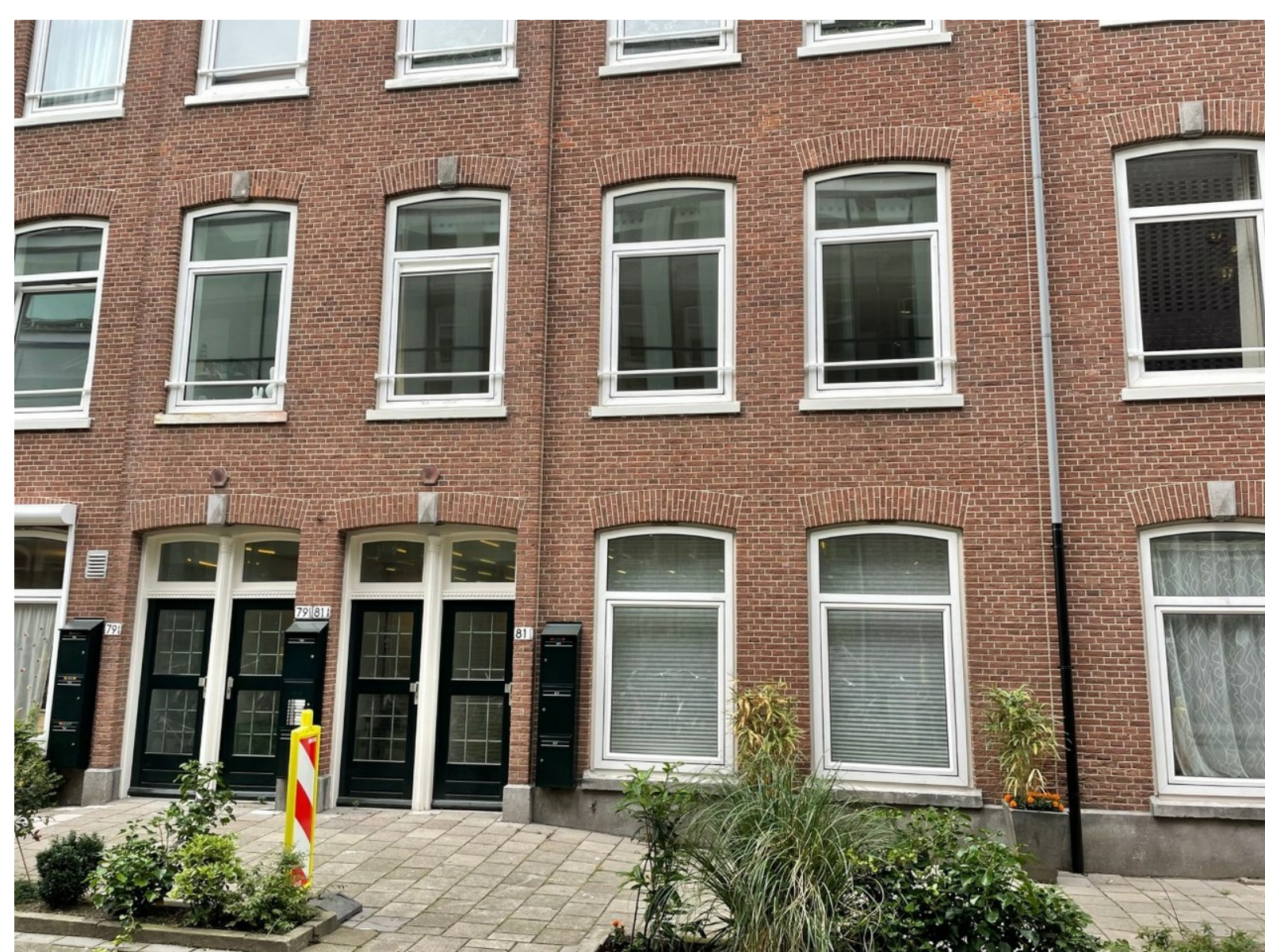
Plantage Muidergracht 81D (is éénhoog).