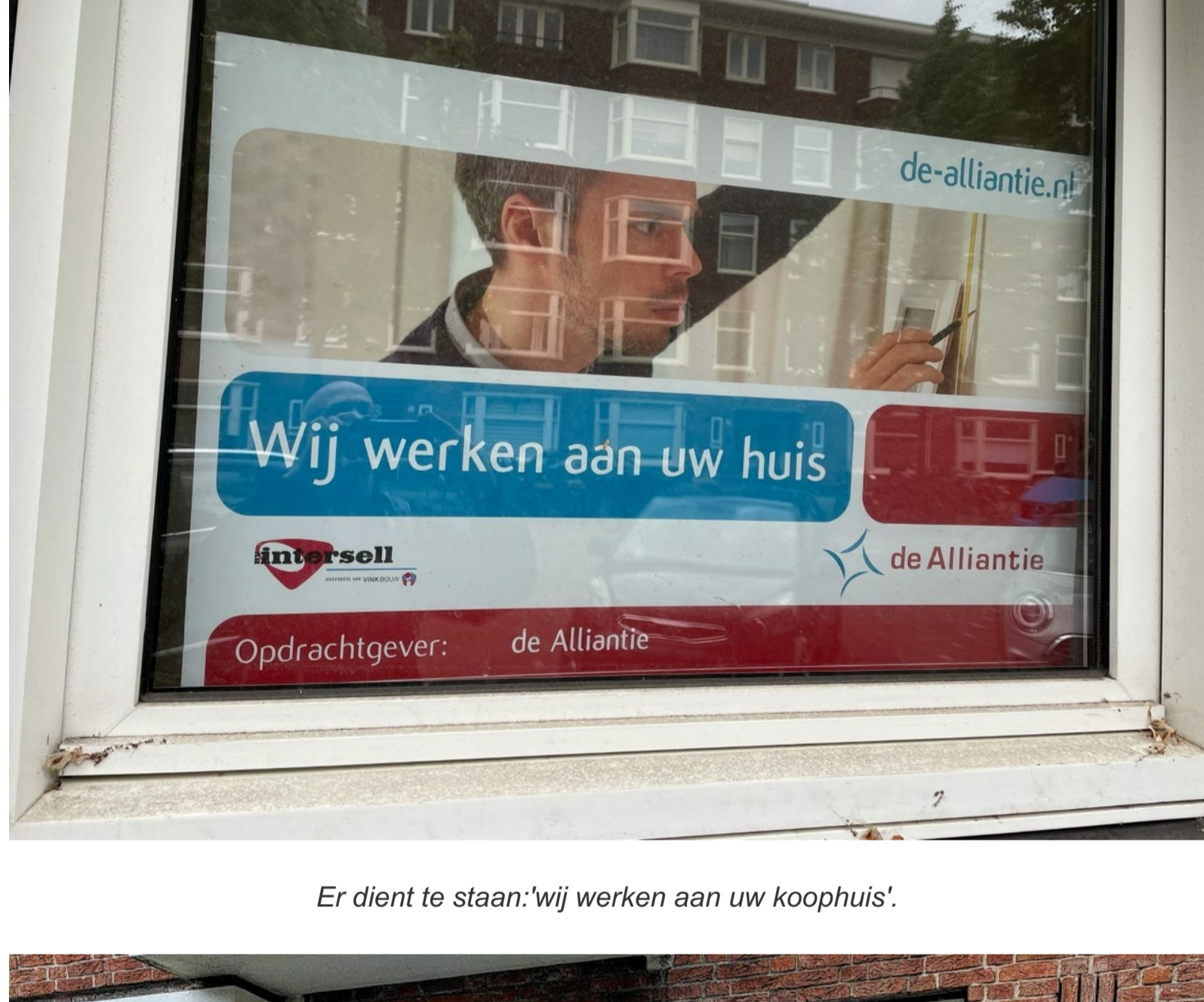
Er dient te staan: 'wij werken aan uw koophuis'.