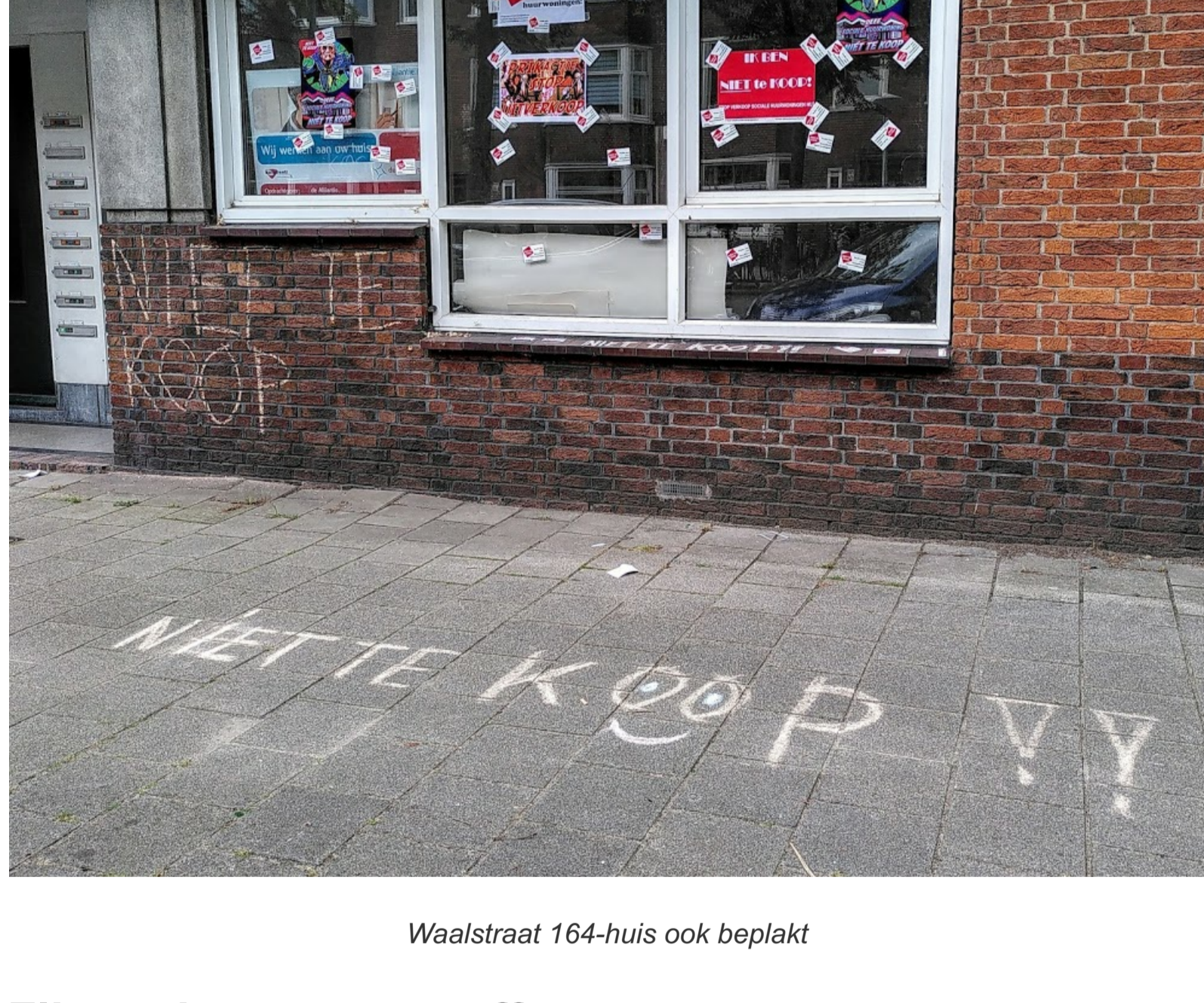
Waalstraat 164-huis ook beplakt