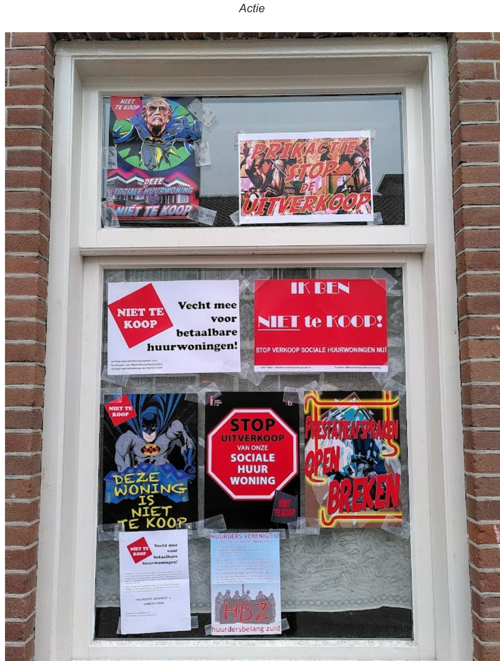
Er was slechts één raam te beplakken, zo smal is de woning