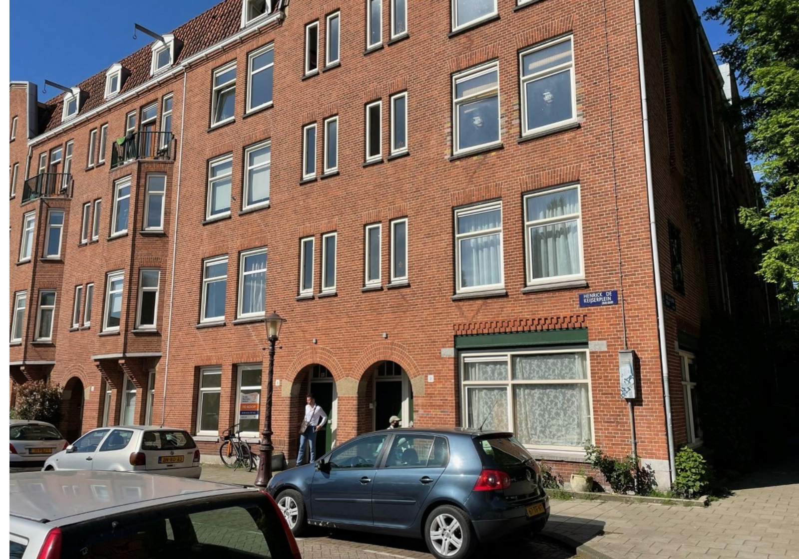
Henrick de Keijserplein 4 bevindt zich achter de lantaarnpaal.

In rood het complex van de Alliantie. Meer dan de helft is al verkocht. Wordt er geen stokje voor gestoken dan zal de rest volgen.