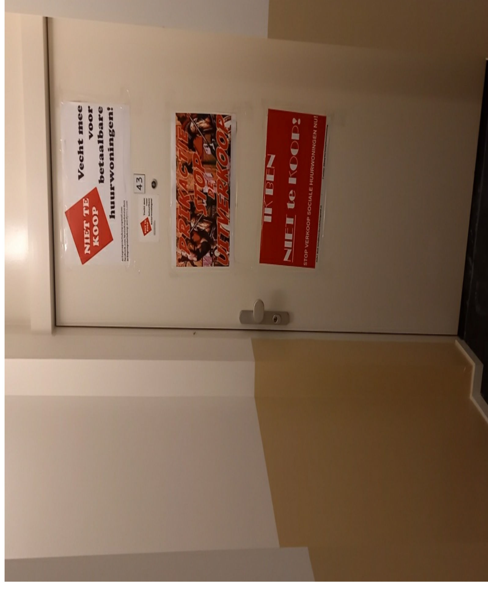
Posters in het trappenhuis

Tegen de 40 personen bij de actie was een mooi resultaat. Niet Te Koop groeit. We hopen dat bij de komende actie, zaterdag a.s. in de Marnixstraat er nog meer mensen zijn! Van de actie zijn opnames gemaakt door Herman Melkman en Allard Lanson. Hieronder nog wat foto's.