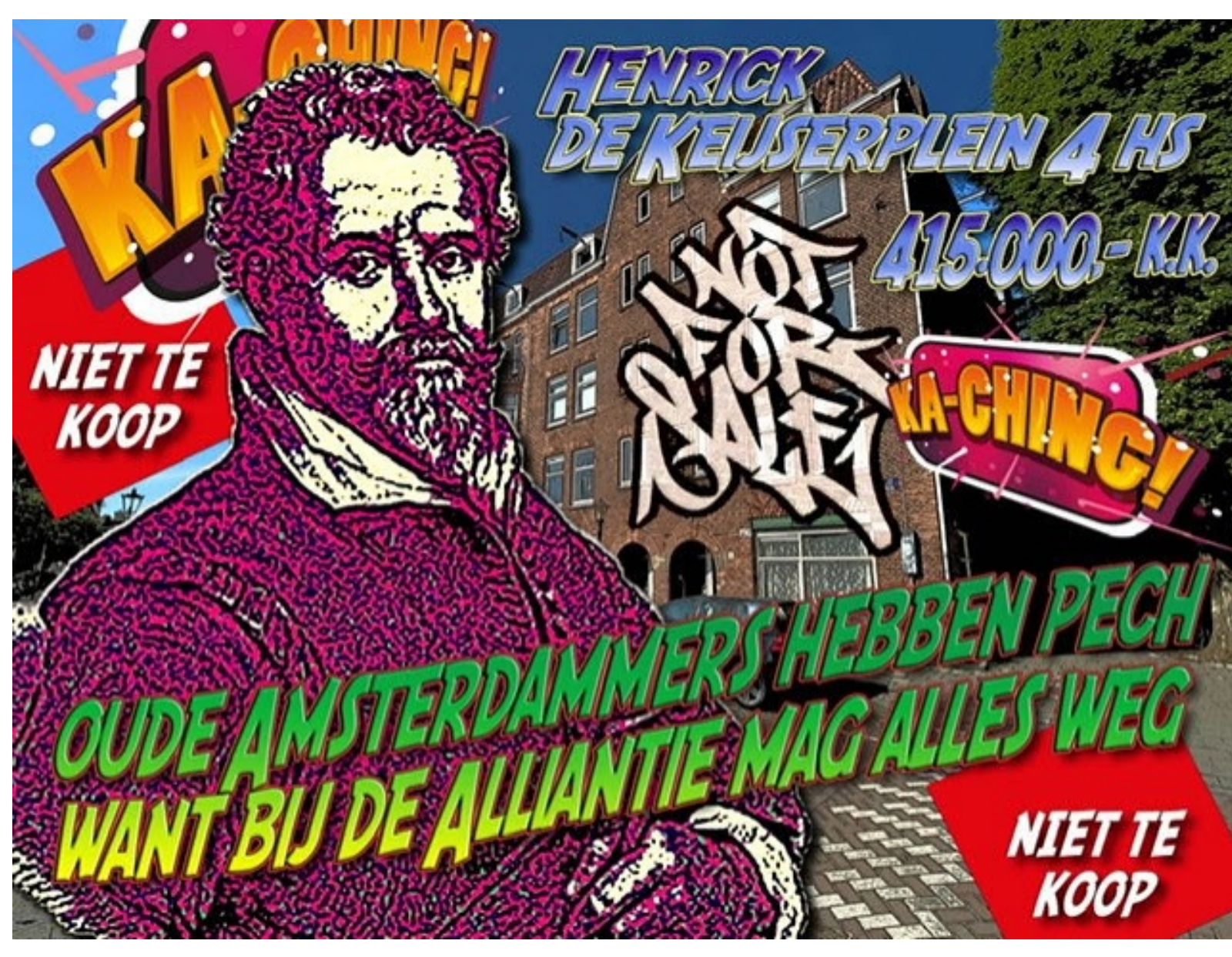
Affiche Kimbel Bouwman

Zaterdag 5 juni was de 37ste flitsactie van actiegroep Niet Te Koop tegen de verkoop door corporaties van sociale huurwoningen. Doelwit was deze maal Henrick de Keijserplein 4-huis , door vastgoedcorporatie de Alliantie voor €415.000 te koop gezet. Waarmee dit de 23ste verkochte sociale huurwoning van deze corpo in Zuid zou worden.