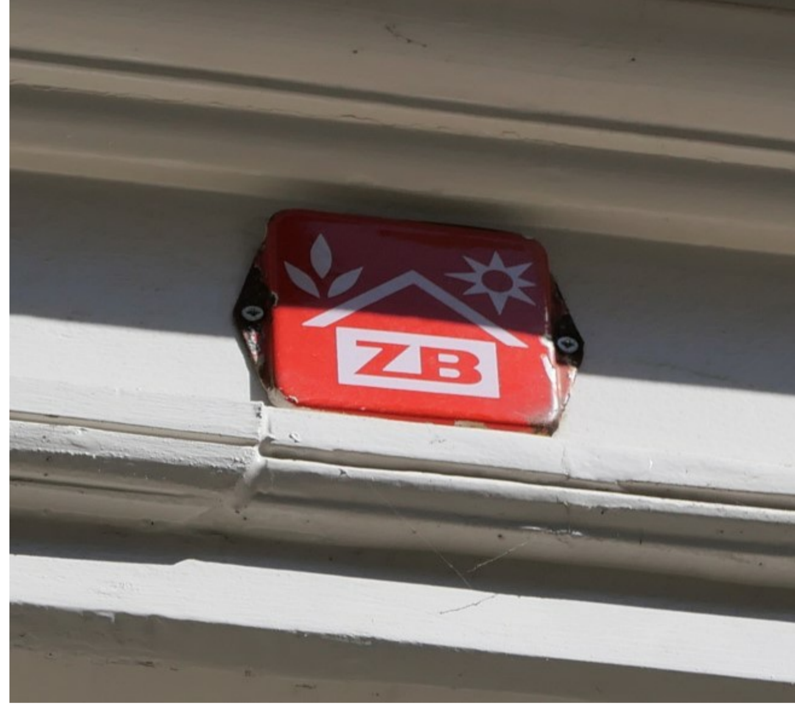
Eens was het pand van de stichting 'Zomers Buiten' getuige dit logo op de pui. Door een fusie kwam het begin deze eeuw van Ymere. Het sociale wordt nu uitgepond.