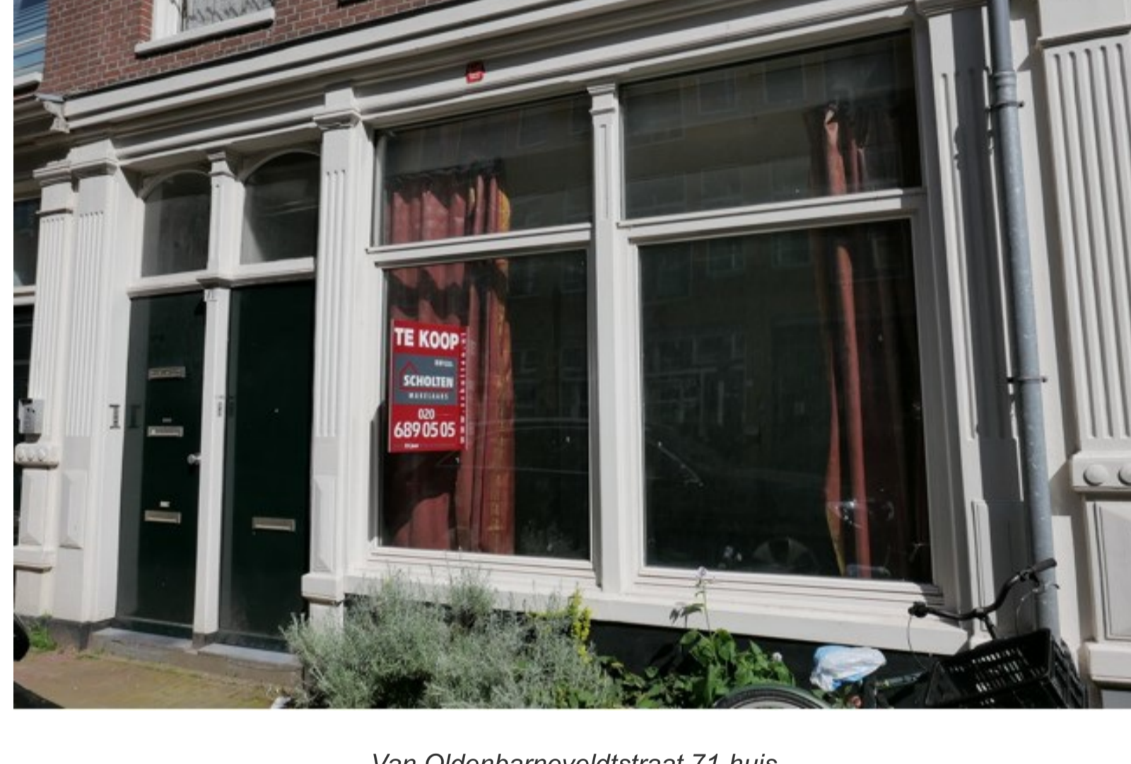
Van Oldenbarneveldtstraat 71-huis