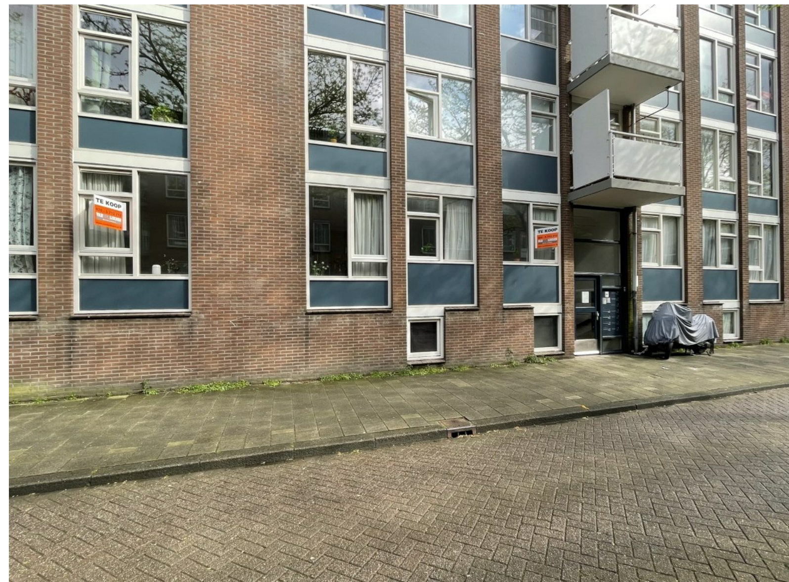
Van Beuningenstraat 61

In lichtgroen complexen van Rochdale. De Staatsliedenbuurt is vergeven van Rochdalebezit. Maar ook hier is alom sprake van erosie door verkoop. Het gentrificatiemonster vreet steeds meer sociale voorraad op.