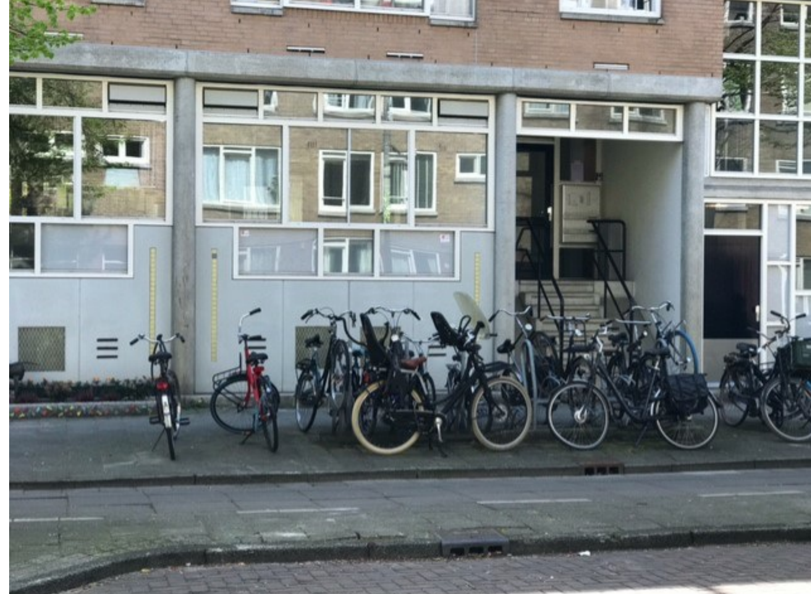
Lutmastraat 34A met de bekende bende fietsen ervoor.

In rood de complexen van De Alliantie. De twee blokken in het midden, omgeven door de Ferdinand Bol, de Lutmastraat en de Lizzy Ansinghstraat bestaan uit in totaal 286 woningen waarvan inmiddels ruim 60 zijn verkocht. Praktijk is dat als eenmaal begonnen is met verkoop, de corporatie van het hele complex af wil.