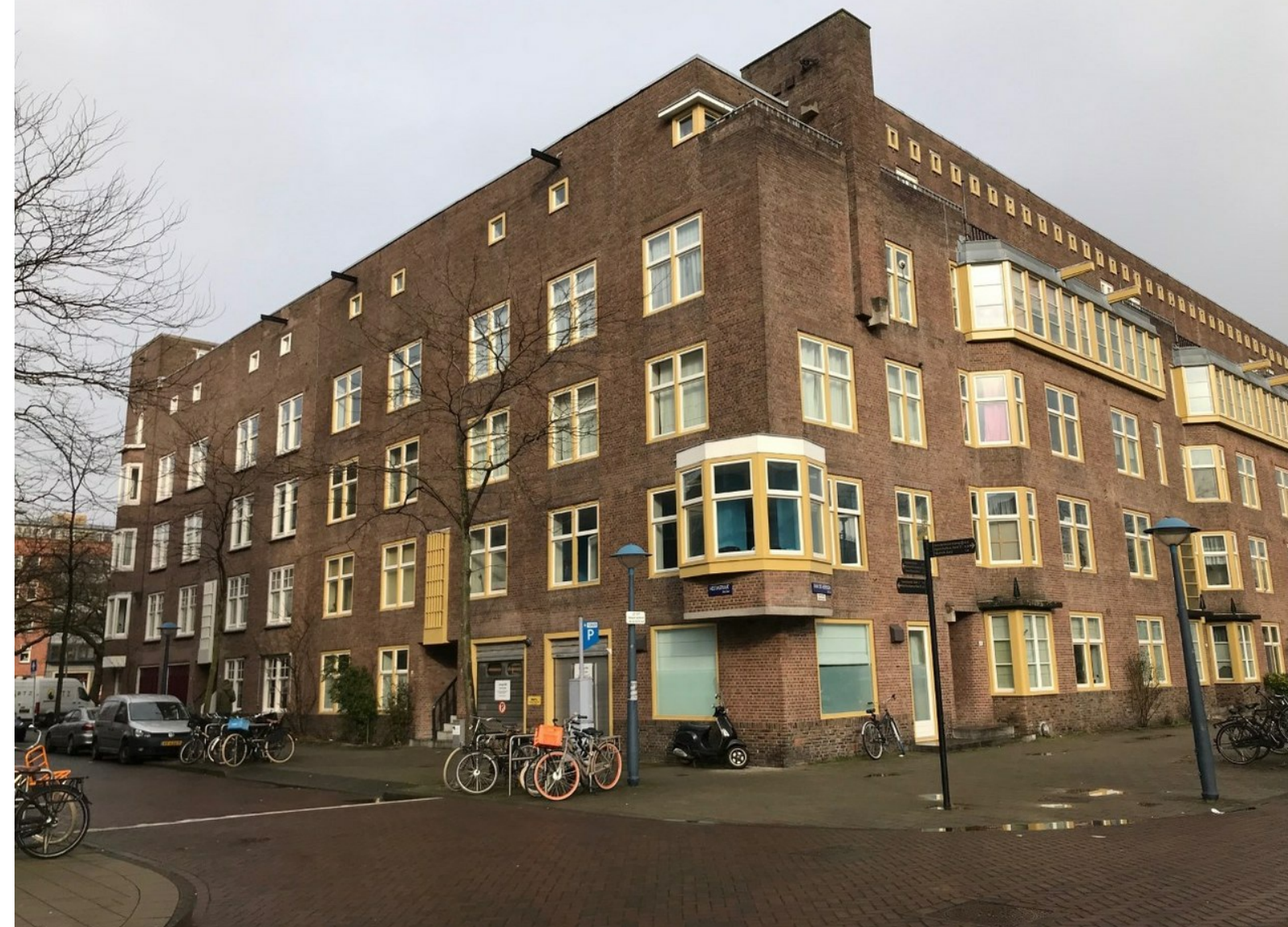
Hestia 81-1 is de hoekwoning met het opvallende erker.