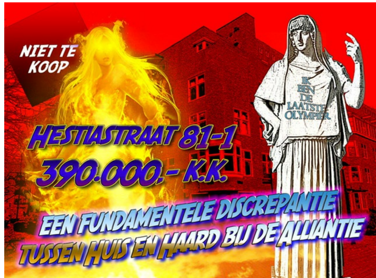
Godin Hestia lijkt nog de enige die de verkoop kan verhinderen. Affiche Kimbel Bouwman

Actiegroep Niet Te Koop gaat onverdroten door met haar zaterdagse flitsacties! Als de dwaze moeders van Argentinië voert de groep elke zaterdag een plakactie uit bij een door een woningcorporatie te koop gezette sociale huurwoning. Als de dwaze huurders van Amsterdam.