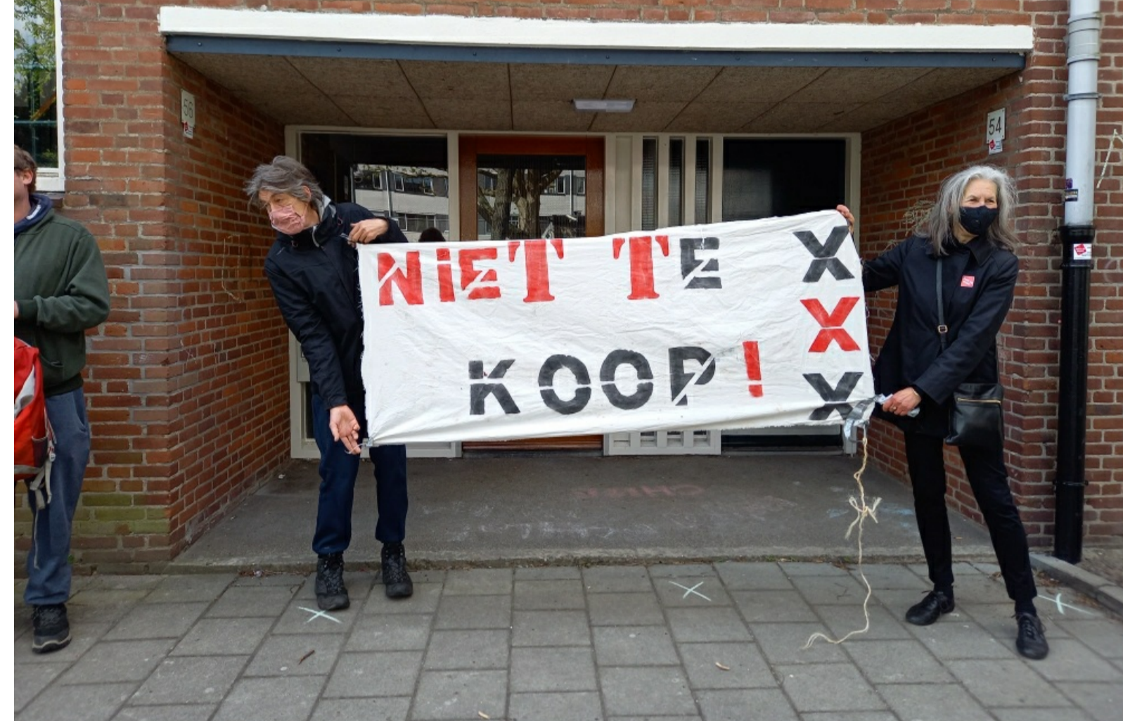
Geen plakwerk dit keer, de woning bleek al definitief verkocht, de eigenaars waren zelfs aanwezig! Dan maar spandoeken.