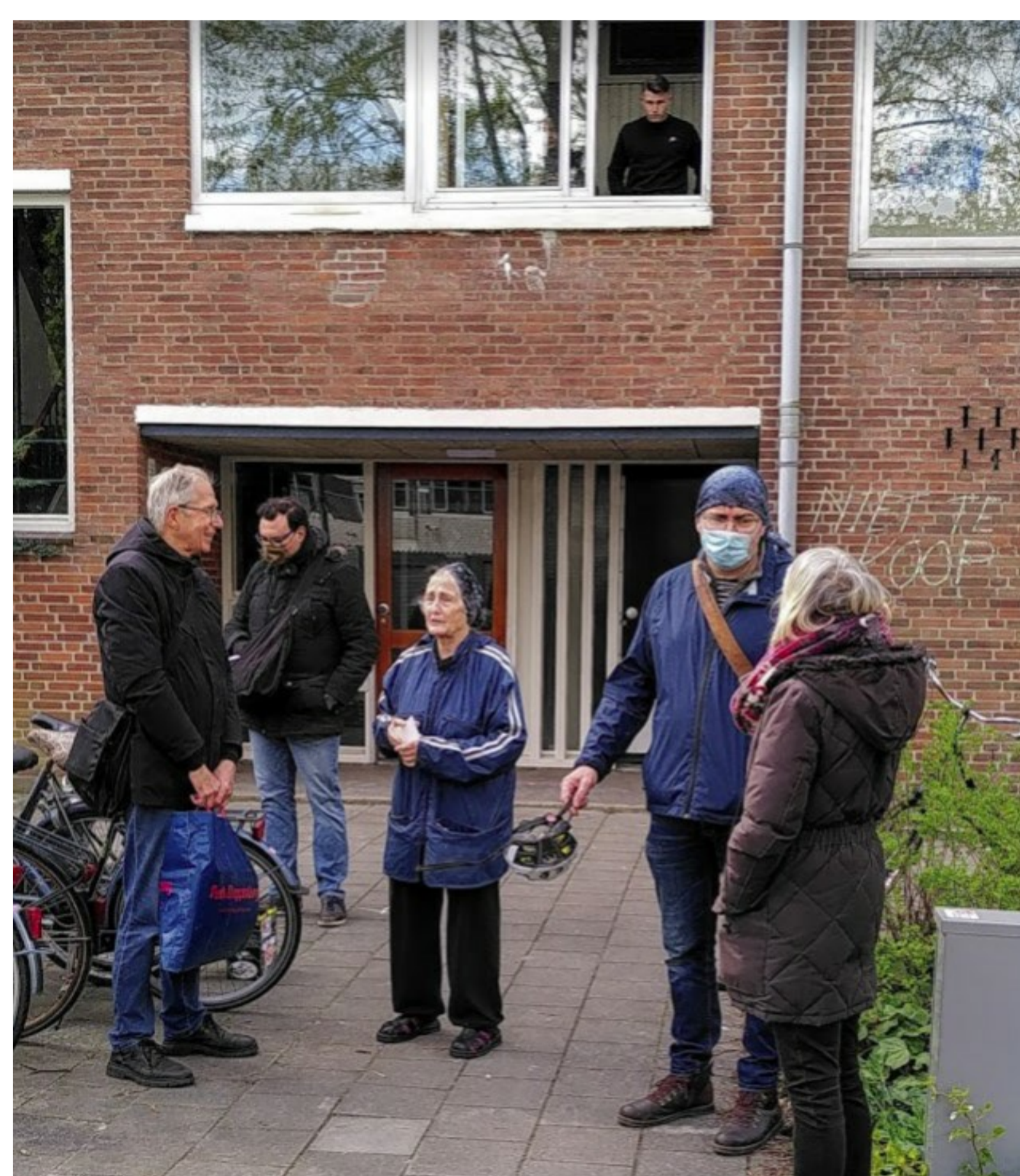
De koper van Zeelandstraat 54-1 kijkt sceptisch naar de actievoerders met wie bij tijd en wijle een pittige discussie werd gevoerd.