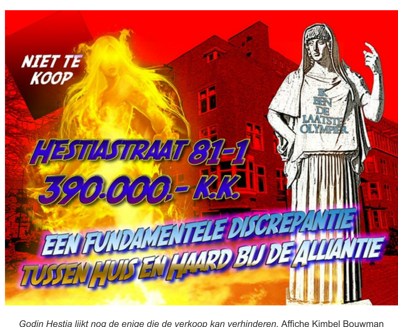
Godin Hestia lijkt nog de enige die de verkoop kan verhinderen. Affiche Kimbel Bouwman

Zaterdag 8 mei was de 34ste flitsactie van actiegroep Niet Te Koop tegen de verkoop door corporaties van sociale huurwoningen in Zuid. Doelwit was Hestiastraat 82-1 welk door vastgoedcorporatie De Alliantie 28 april voor €390.000 in de verkoop is gezet.