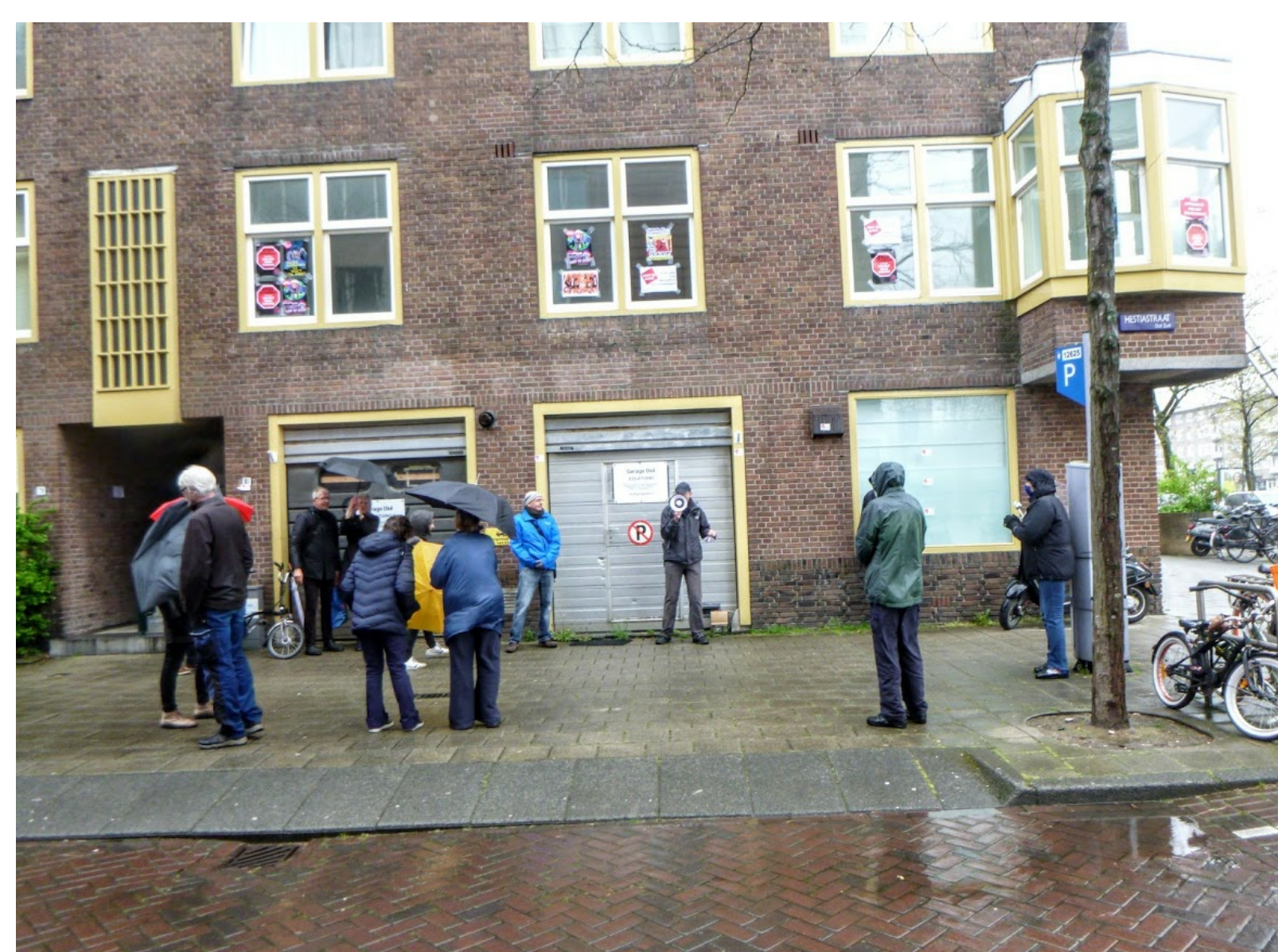
Praatje Boudewijn. Vanwege het winderige en kletsnatte weer dit keer geen spandoeken.

Ondanks kou en regen was de harde kern weer present. Heel gezellig. Hulde voor jullie volhardendheid! Van de actie zijn opnames gemaakt door Allard Lanson , en Herman Melkman.