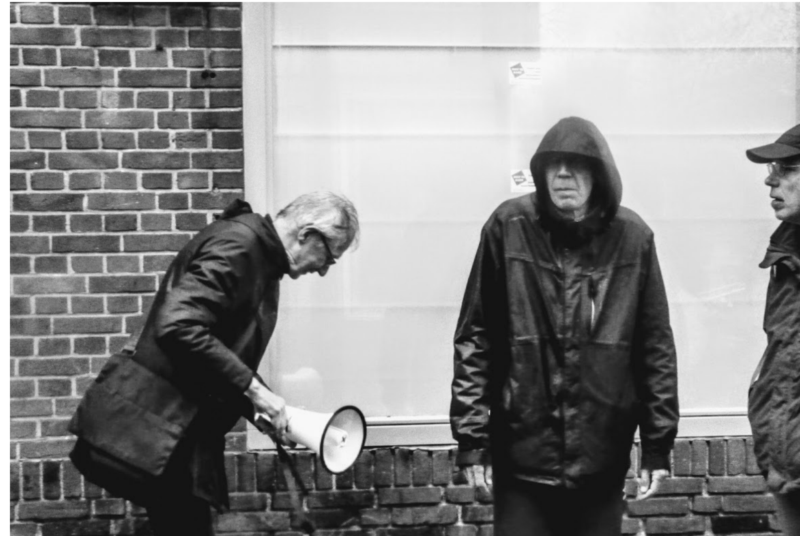
Het regende en woei steeds harder