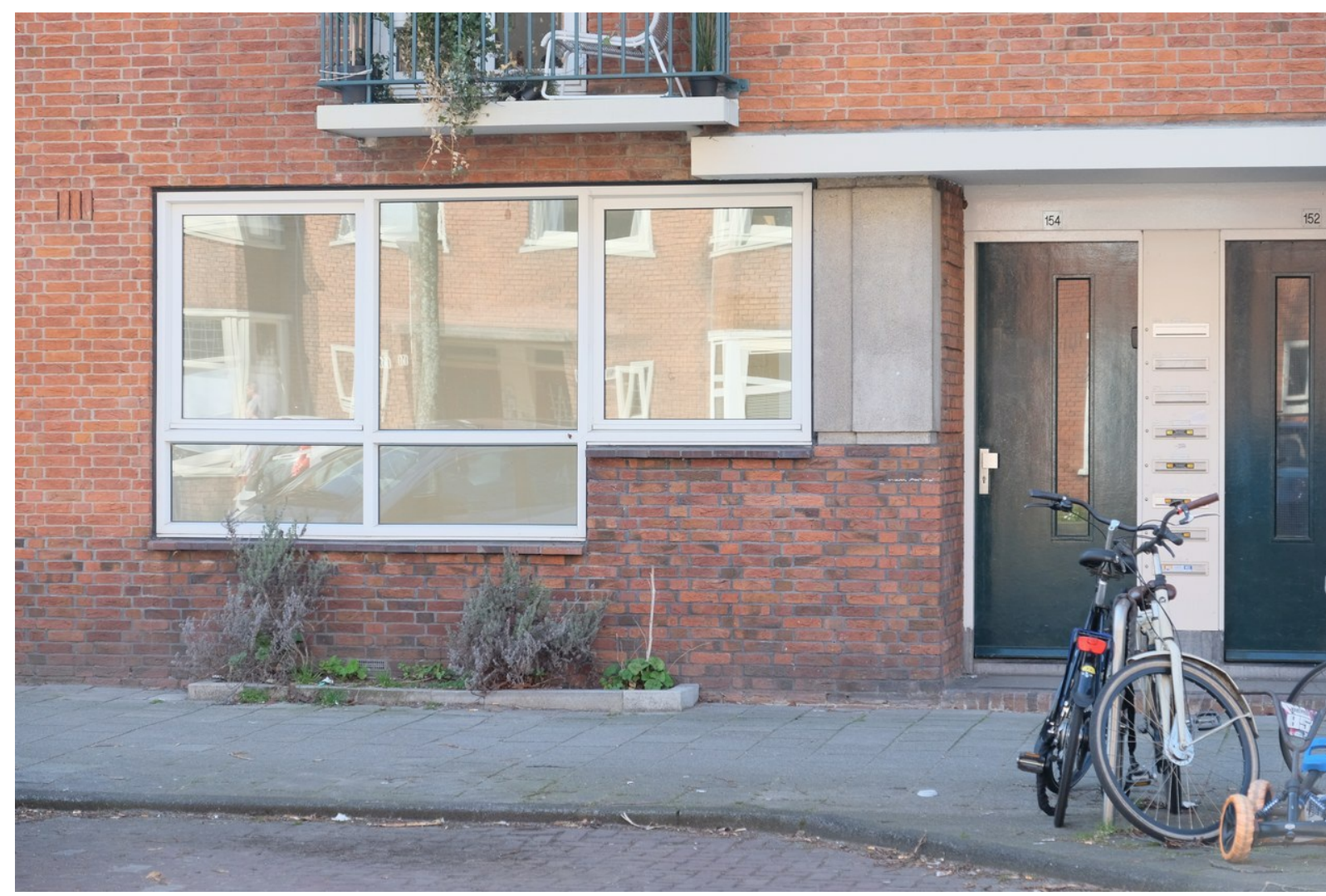
Waalstraat 154-huis. Een uitstekende woning voor een ouder of slecht ter been zijnd iemand.

De woning die we zaterdag op de korrel nemen is begin vorige week te koop gezet voor €400.000 en meet 51 m 2 . Uitstekend geschikt voor de regeling Van Hoog Naar Laag die als voorwaarde stelt dat de te betrekken woning niet groter mag zijn dan 60 m 2 . De woningmarkt is zo overspannen dat al na één dag de site meldt dat '.....wegens de grote belangstelling het NIET meer mogelijk is voor deze woning afspraken in te plannen.' Funda meldt nu zelfs dat de woning al definitief is verkocht . Wie weet aan de hoogst biedende, veel meer dan de vraagprijs. Overbieden is de normaalste zaak van de wereld geworden.