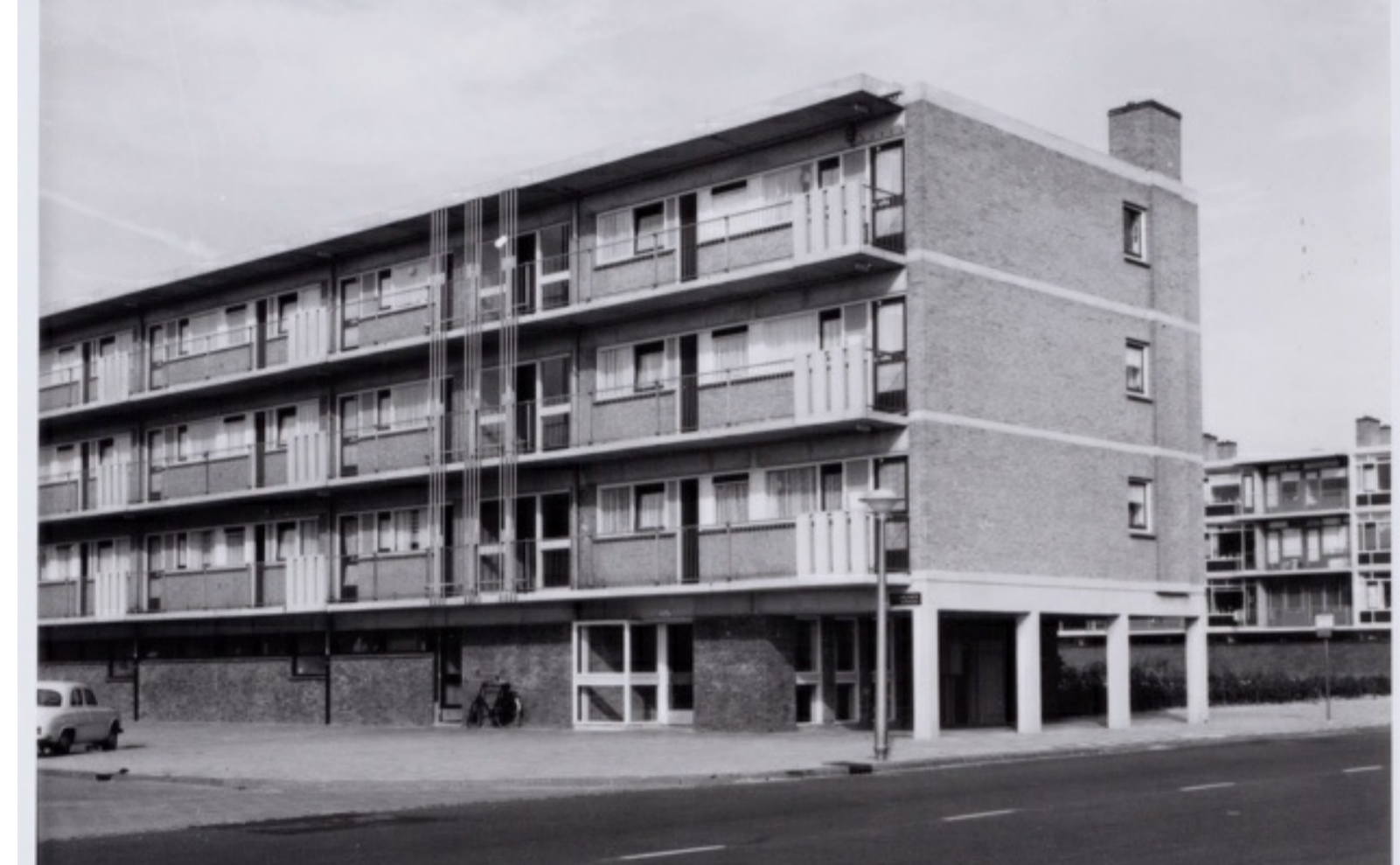
Valkhof jaren zestig vorige eeuw.