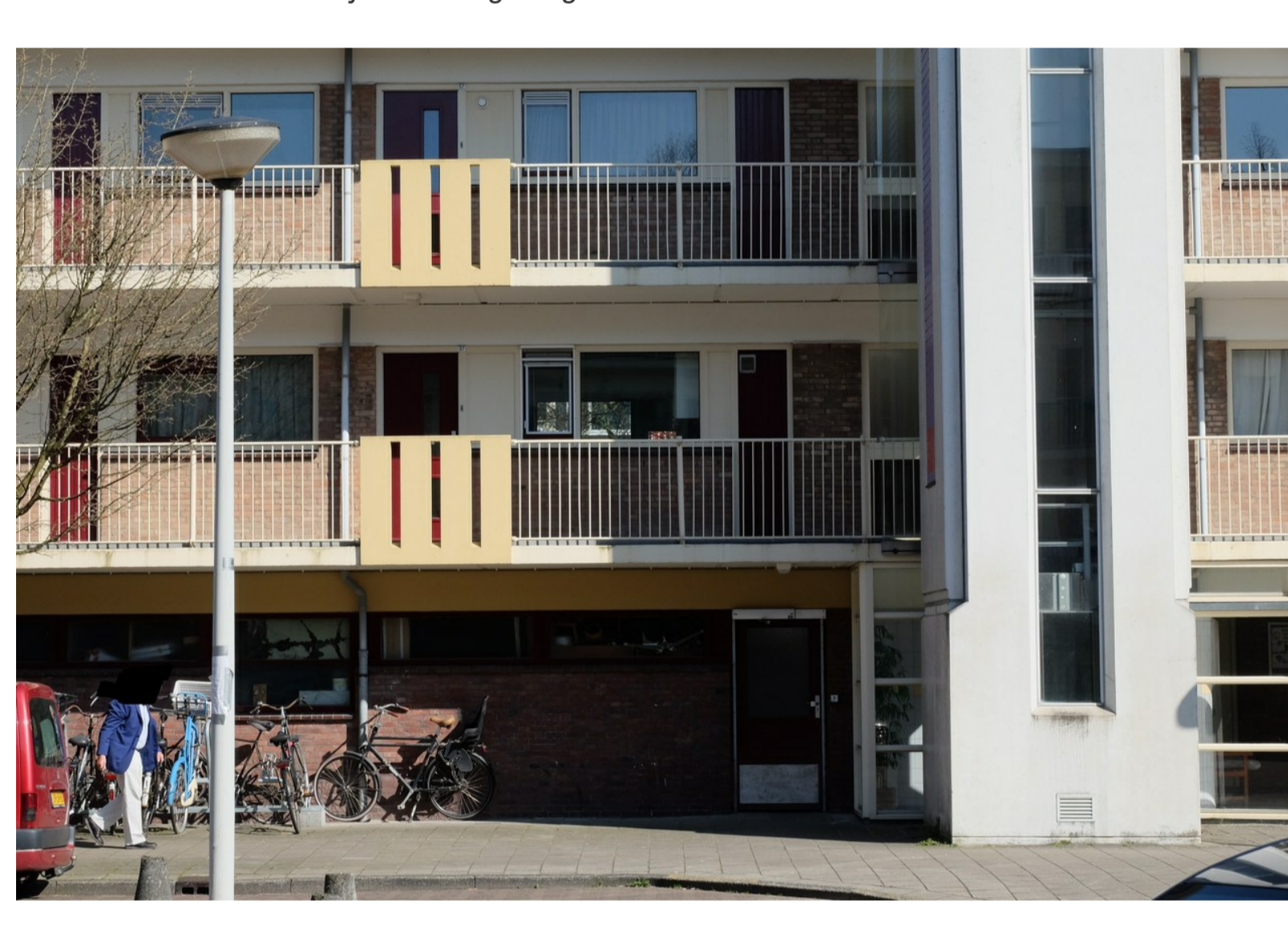
Valkhof 37 (in het midden van de foto, pal naast de lift) is twee weken geleden door de Key te koop gezet voor €325.000 en is nu al onder voorbehoud verkocht. Vorig jaar zijn vijf woningen verkocht, de nummers 3, 9, 12, 21 en 58.