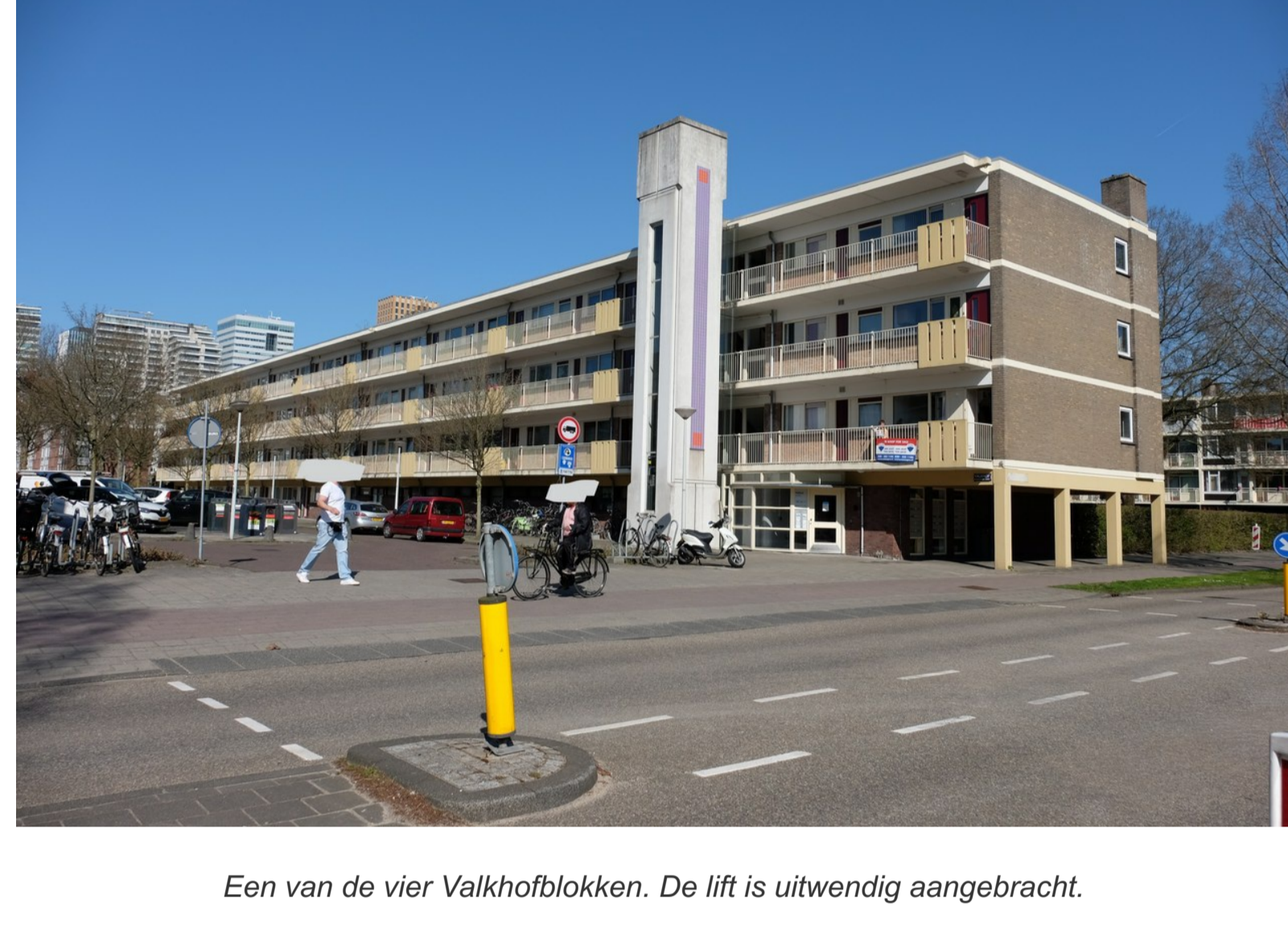
Een van de vier Valkhofblokken. De lift is uitwendig aangebracht.