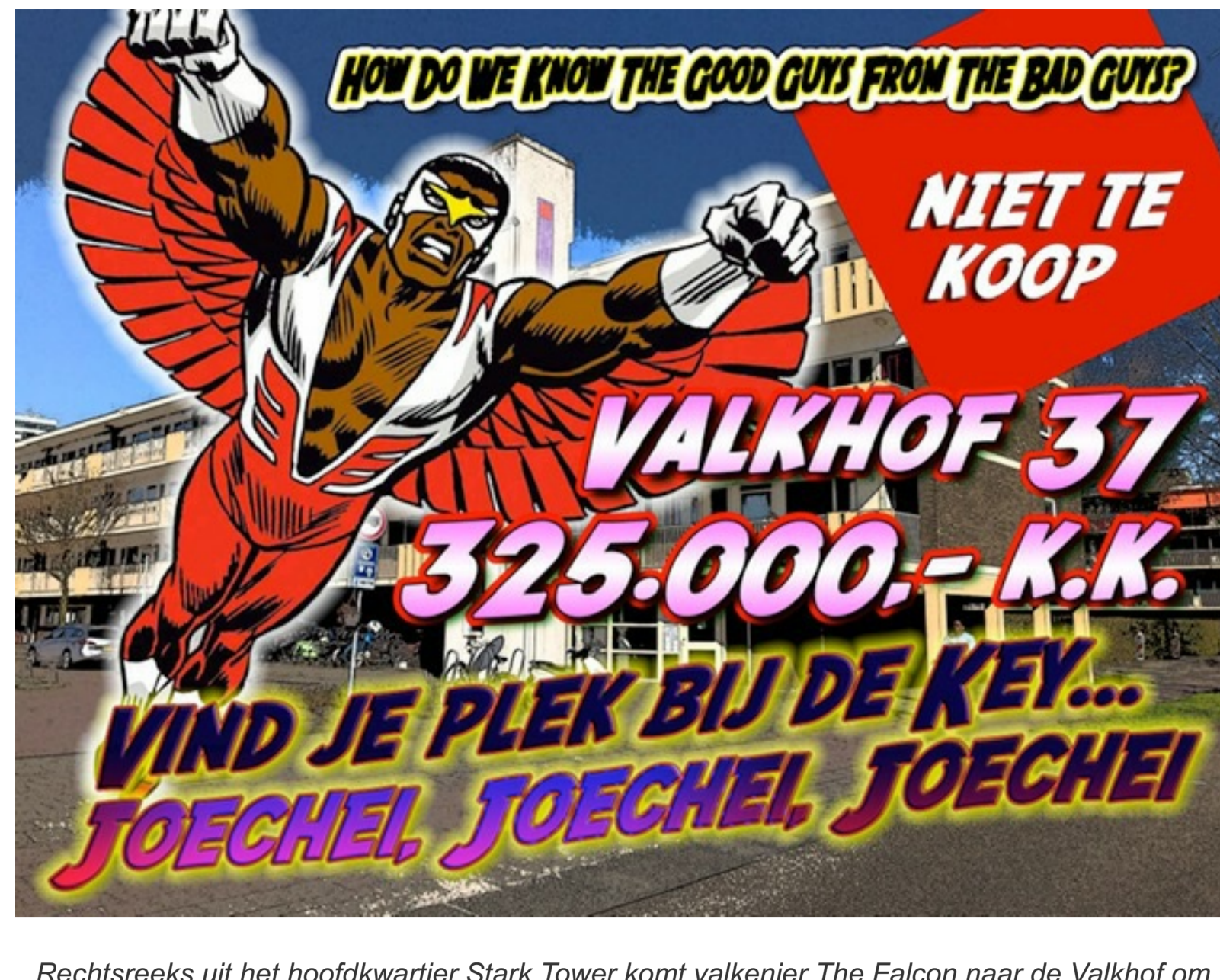
Rechtsreeks uit het hoofdkwartier Stark Tower komt valkenier The Falcon naar de Valkhof om de Key een lesje te leren. Affiche Kimbel Bouwman.

Zaterdag viert actiegroep Niet Te Koop haar jubileum: zij organiseert de 30ste achtereenvolgende actie tegen verkoop door een vastgoedcorporatie van een sociale huurwoning. Niet Te Koop roept iedereen op massaal te komen. Leden van de huurdersverenigingen HuurdersBelangZuid, van De Pijp, van West, van Centrum, van Noord en leden van andere huurdersverenigingen, gemeenteraadsleden, pers, FNV-leden, belangstellenden: iedereen die van mening is dat er betaalbare woningen in Amsterdam moeten blijven. De jubileumactie is toegespitst op het behoud van woningen die zeer geschikt zijn voor ouderen en mensen die slecht tot geen trappen kunnen lopen.