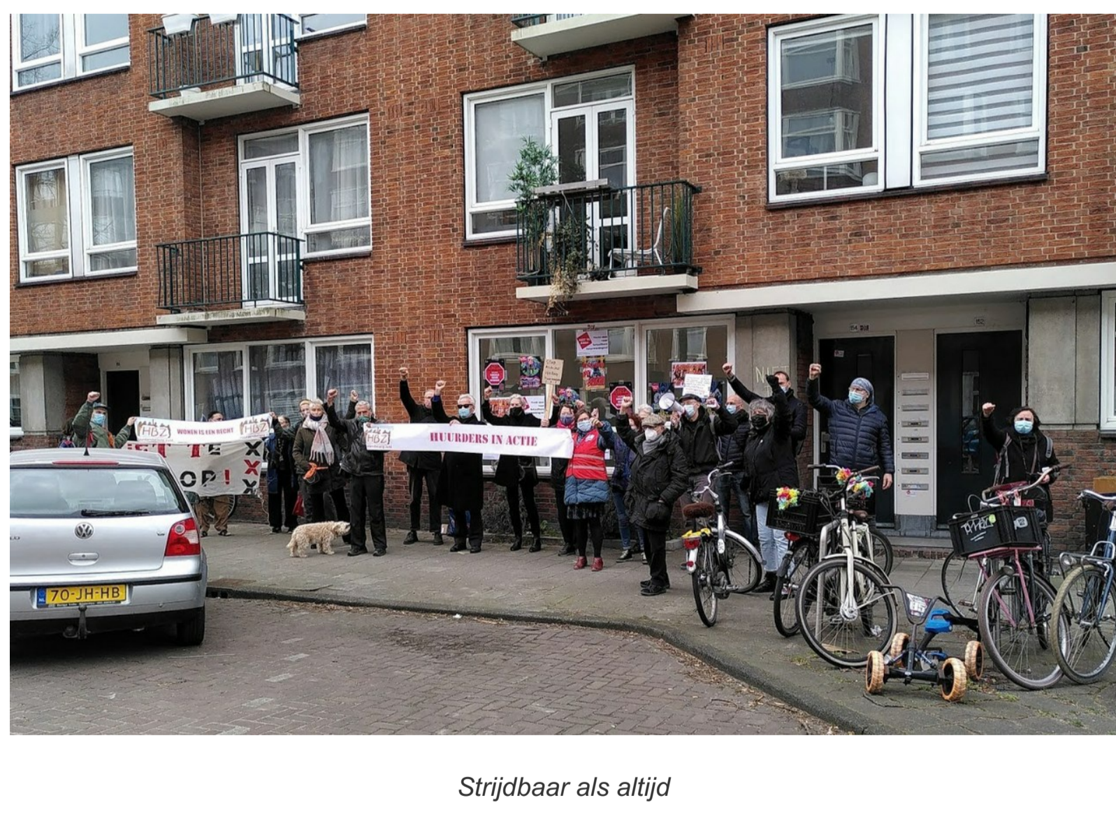
Strijdbaar als altijd