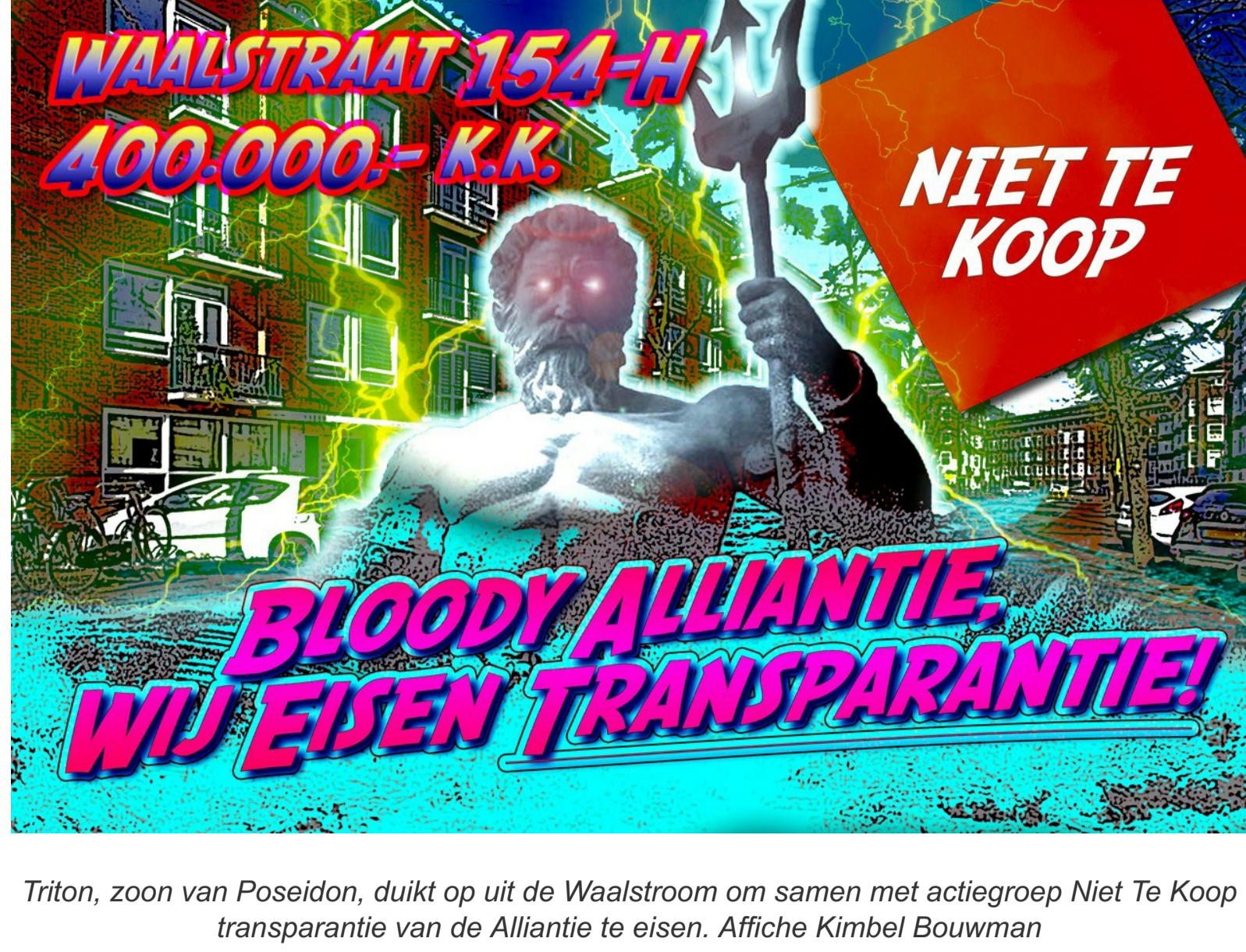
Triton, zoon van Poseidon, duikt op uit de Waalstroom om samen met actiegroep Niet Te Koop transparantie van de Alliantie te eisen. Affiche Kimbel Bouwman

Zaterdag 3 april was de 29ste flitsactie van actiegroep Niet Te Koop tegen de verkoop door corporaties van sociale huurwoningen in Zuid. Vastgoedcorporatie was de Alliantie die Waalstraat 154-hs voor €400.000 in de verkoop had gezet. Voor deze corporatie de dertiende dit jaar!