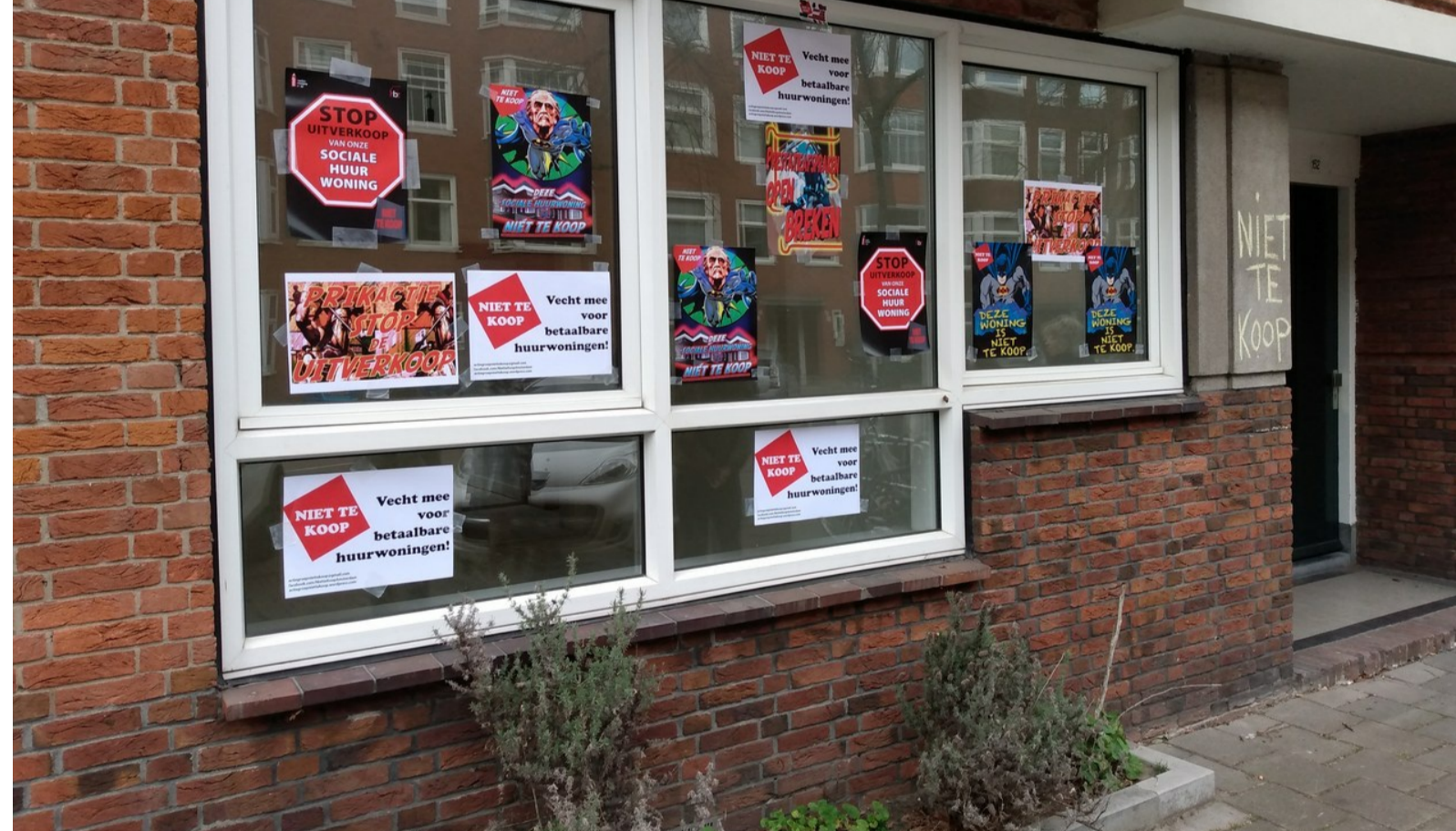
Het plakwerk. Met dank aan de drukker en aan huisontwerper Kimbel Bouwman.