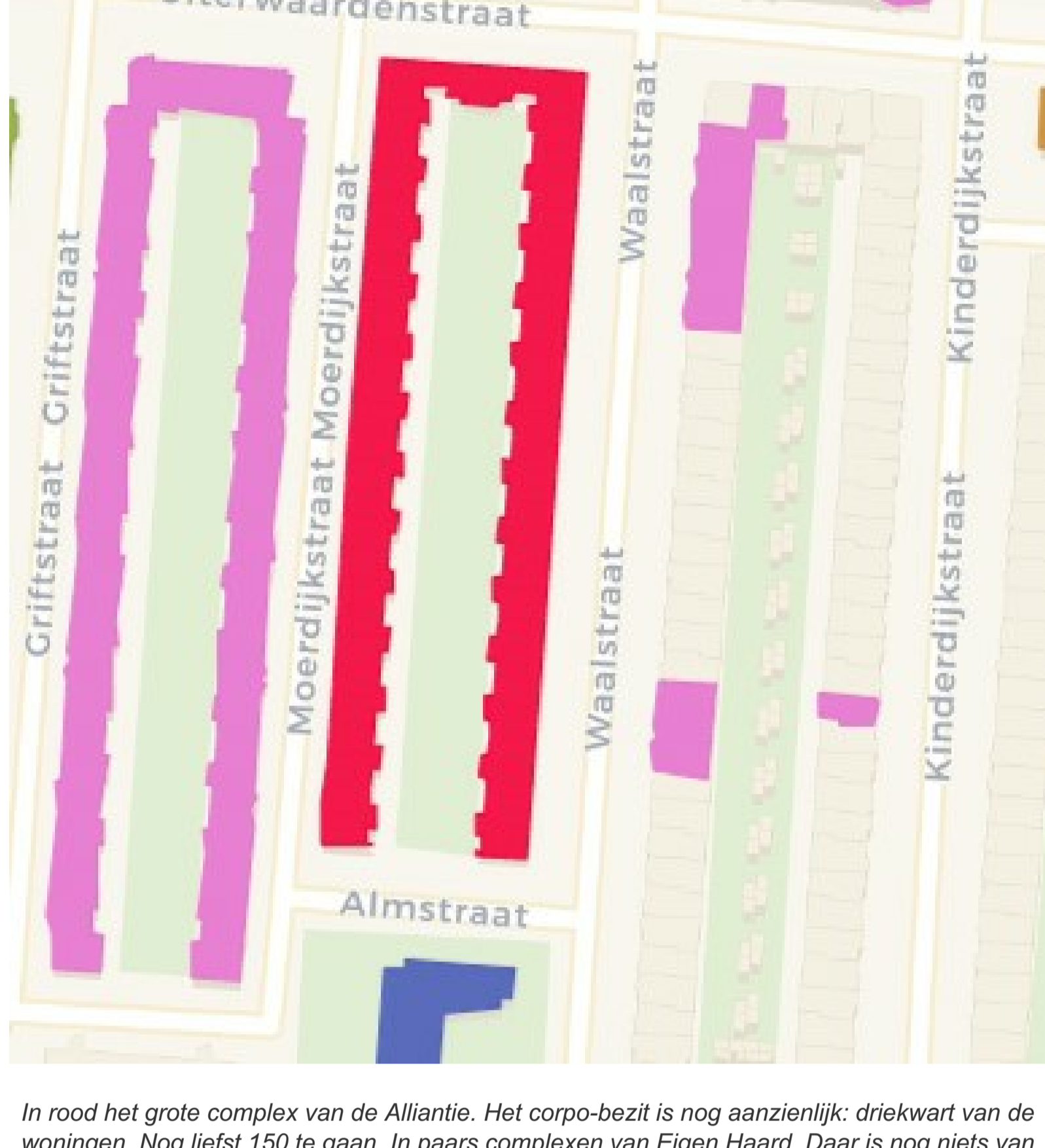
In rood het grote complex van de Alliantie. Het corpo-bezit is nog aanzienlijk: driekwart van de woningen. Nog liefst 150 te gaan. In paars complexen van Eigen Haard. Daar is nog niets van verkocht.

De ervaring leert dat dit soort woningen wordt gekocht door tweeverdieners, expats of door ouders voor de kinderen. Wordt er verhuurd, wat vaak al snel het geval is (gezinsuitbreiding, ander werk) dan wordt de woning of in de vrije sector verhuurd voor rond de €1500, €2.000 p.m., of met tonnen winst verkocht. Mensen met een gewoon inkomen hebben het nakijken. Het gentrificatieproces.