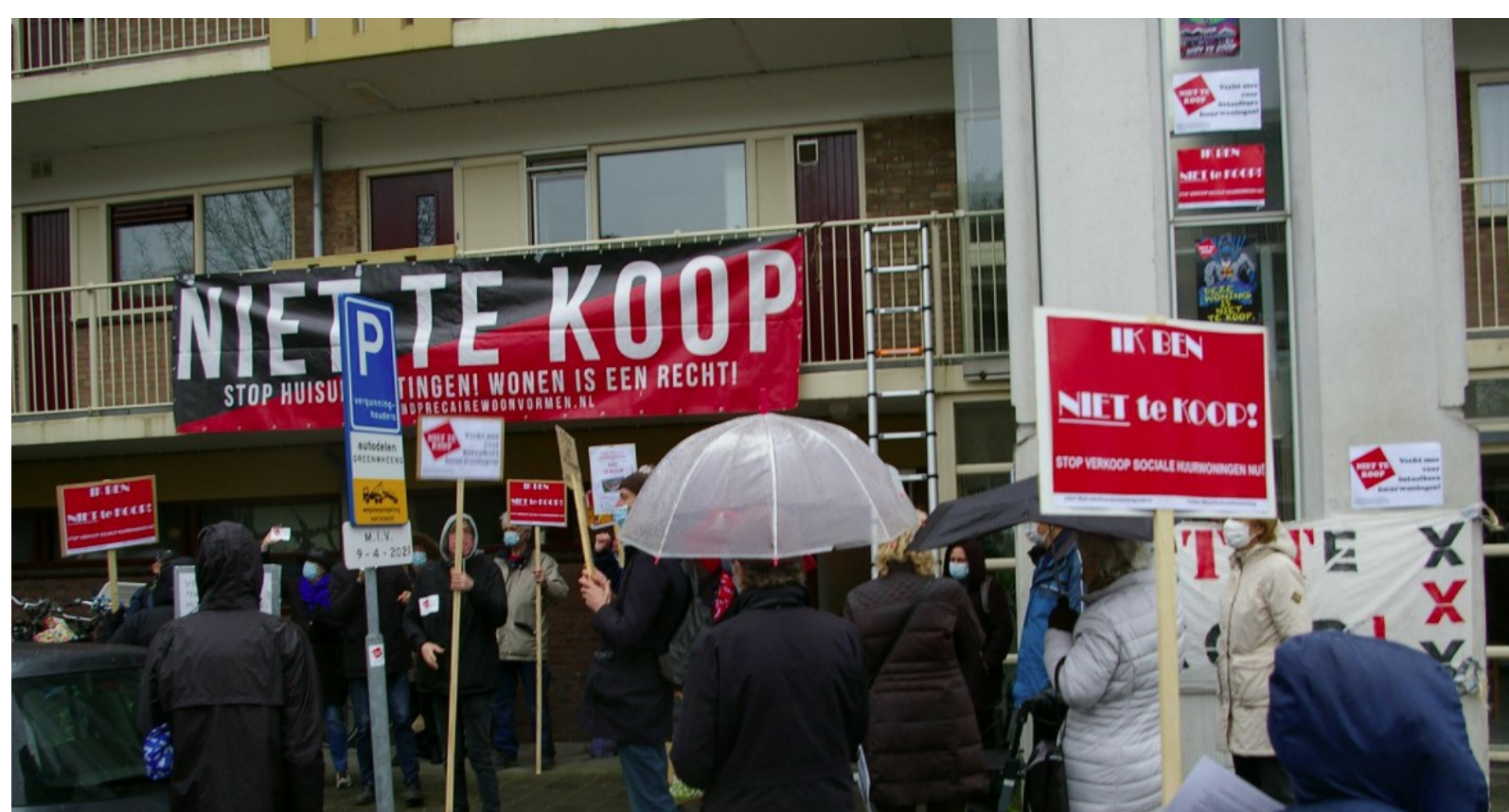
Tijdens de actie hielden we het niet droog