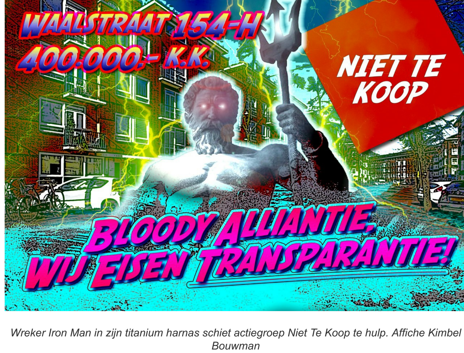
Wreker Iron Man in zijn titanium harnas schiet actiegroep Niet Te Koop te hulp. Affiche Kimbel Bouwman

Zaterdag 17 april was de 31ste flitsactie van actiegroep Niet Te Koop tegen de verkoop door corporaties van sociale huurwoningen in Zuid. Doelwit was Coöperatiehof 18-huis welk door vastgoedcorporatie de Key voor €450.000 in de verkoop is gezet.