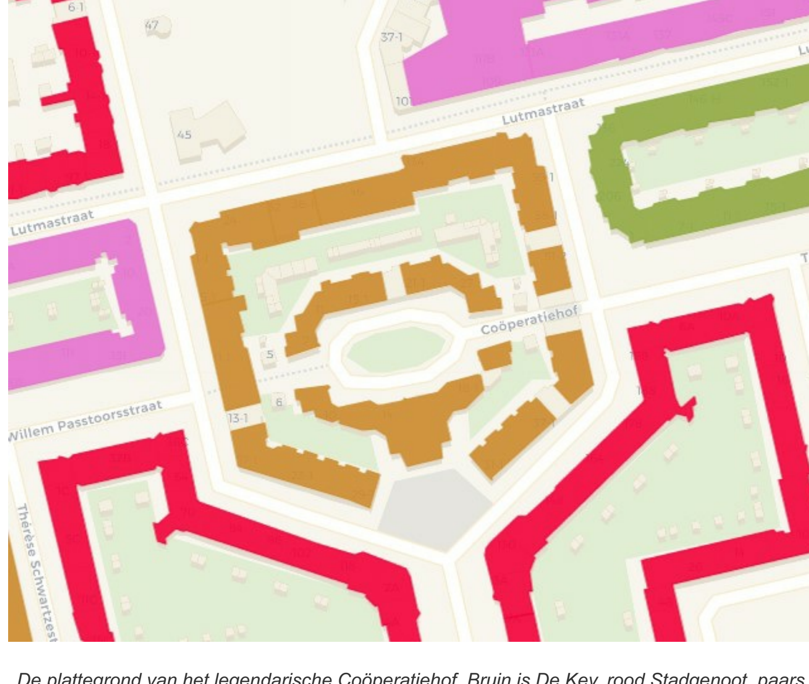
De plattegrond van het legendarische Coöperatiehof. Bruin is De Key, rood Stadgenoot, paars Eigen Haard, groen Rochdale. Alleen De Key flinkt het om deze heilige grond op de particuliere markt te gooien.