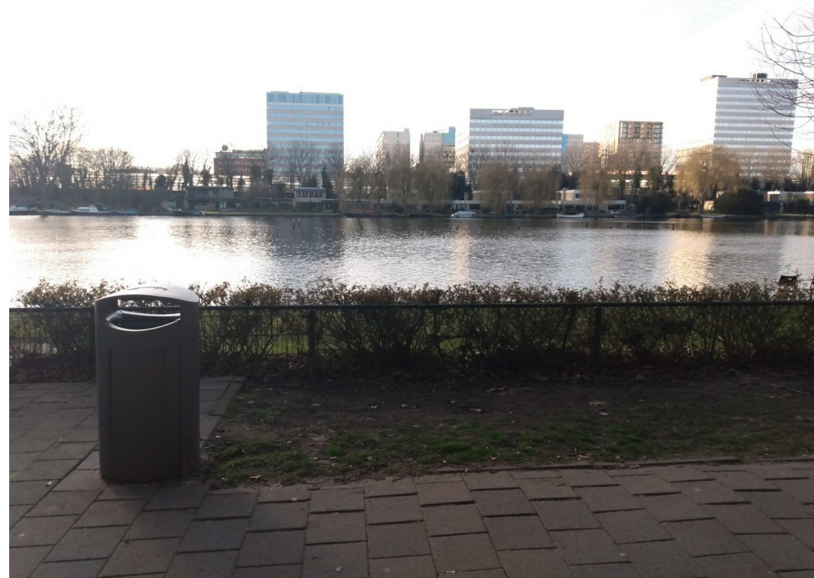
Schitterend uitzicht over de Westlandplas