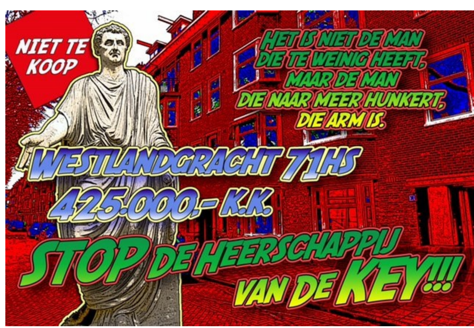
Affiche Kimbel Bouwman

Deze zaterdag een flitsactie in de Hoofddorppleinbuurt, gericht tegen een verkoop van een woning door corporatie De Key. Niet Te Koop roept iedereen op te komen naar de 26ste flitsactie tegen deze verkoop. Leden van de huurdersverenigingen HuurdersBelangZuid, van De Pijp, van West, van Centrum en leden van andere huurdersverenigingen, gemeenteraadsleden, pers, FNV-leden, belangstellenden: iedereen die van mening is dat er betaalbare woningen in Amsterdam moeten blijven. De actie vindt als vanouds plaats op de zaterdag, aanvang 15.00, dit keer dus zaterdag 13 maart. Lokatie: Westlandgracht 71-huis .