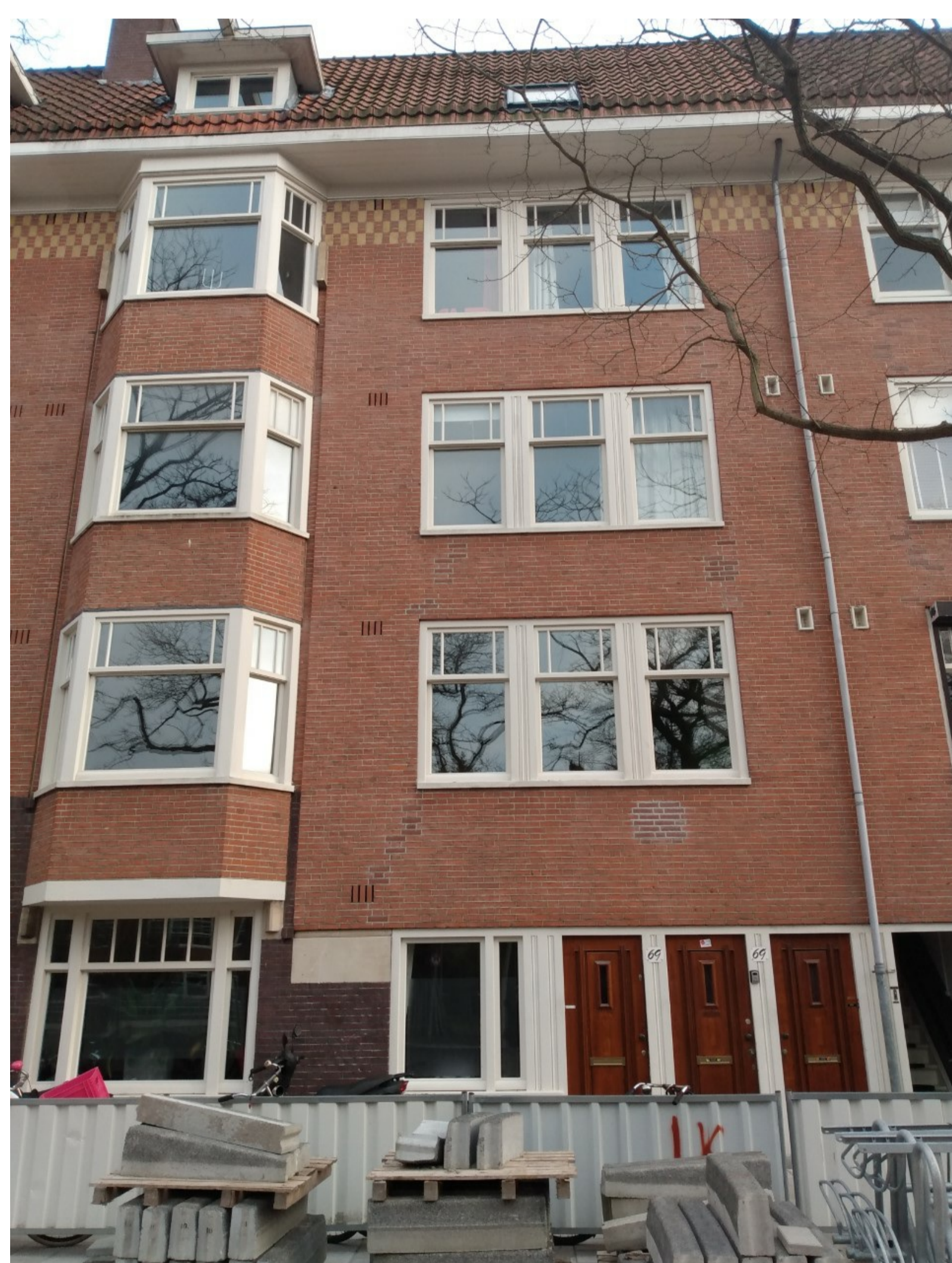
Jekerstraat 69-1. De gemeente heeft de straat rigoreus onder handen genomen en is daar nu bijna mee klaar.

Stadgenoot is trouwens aardig aan het cashen. Als een ware projectontwikkelaar heeft het 61 woningen laten bouwen in Noord , welke nu voor gemiddeld een half miljoen worden aangeboden.