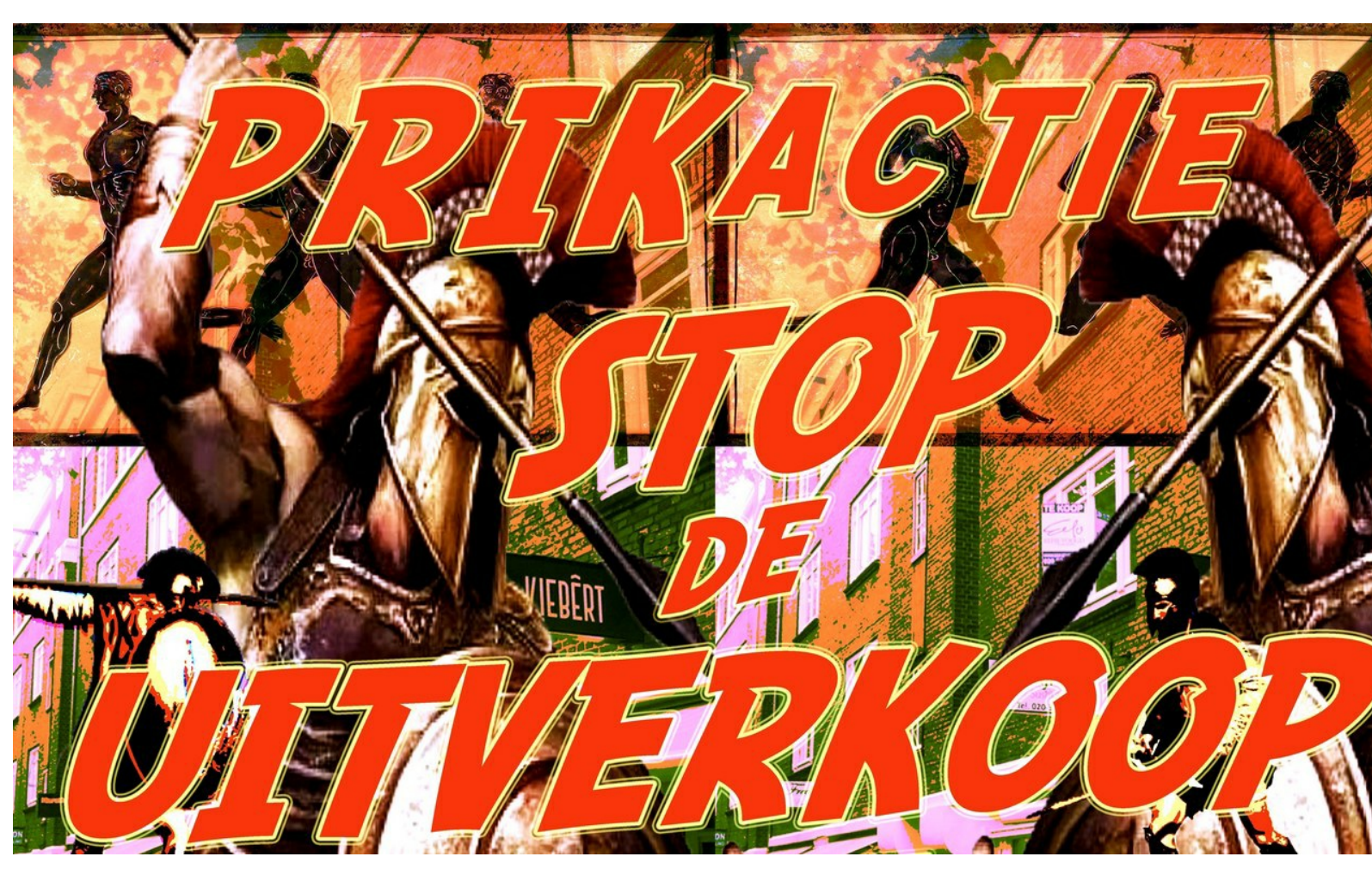
Affiche Kimbel Bouwman

Actiegroep Niet Te Koop roept iedereen op te komen naar de 27ste flitsactie tegen de verkoop van sociale huurwoningen door woningcorporaties. Leden van de huurdersverenigingen HuurdersBelangZuid, van De Pijp, van West, van Centrum en leden van andere huurdersverenigingen, gemeenteraadsleden, pers, FNV-leden, belangstellenden: iedereen die van mening is dat er betaalbare woningen in Amsterdam moeten blijven. Deze zaterdag is de flitsactie in de Dintelstraat, nr 106, Rivierenbuurt , aanvang 15.00.