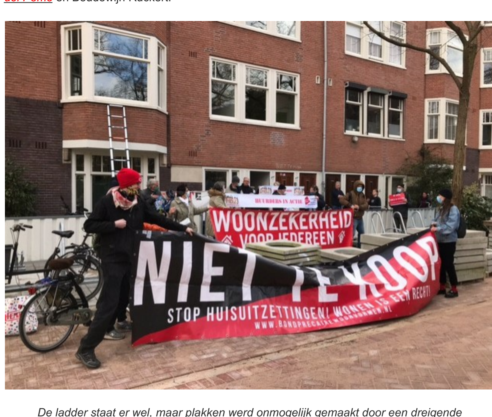
De ladder staat er wel, maar plakken werd onmogelijk gemaakt door een dreigende benedenbuurman die zijn woning al in 2003 van de corporatie had gekocht voor iets meer dan drie ton . De waarde zal nu tegen de één miljoen zijn. We hopen voor hem dat er boven hem fiks verbouwd gaat worden voor een gezin met kleine kinderen.

Er was weer een prima opkomst van de harde kern. Tegen de dertig man. Ook heel gezellig, ondanks de confrontatie met de buurman. Opnames van de flitsactie zijn gemaakt door Flavio del Pomo en Boudewijn Rückert.