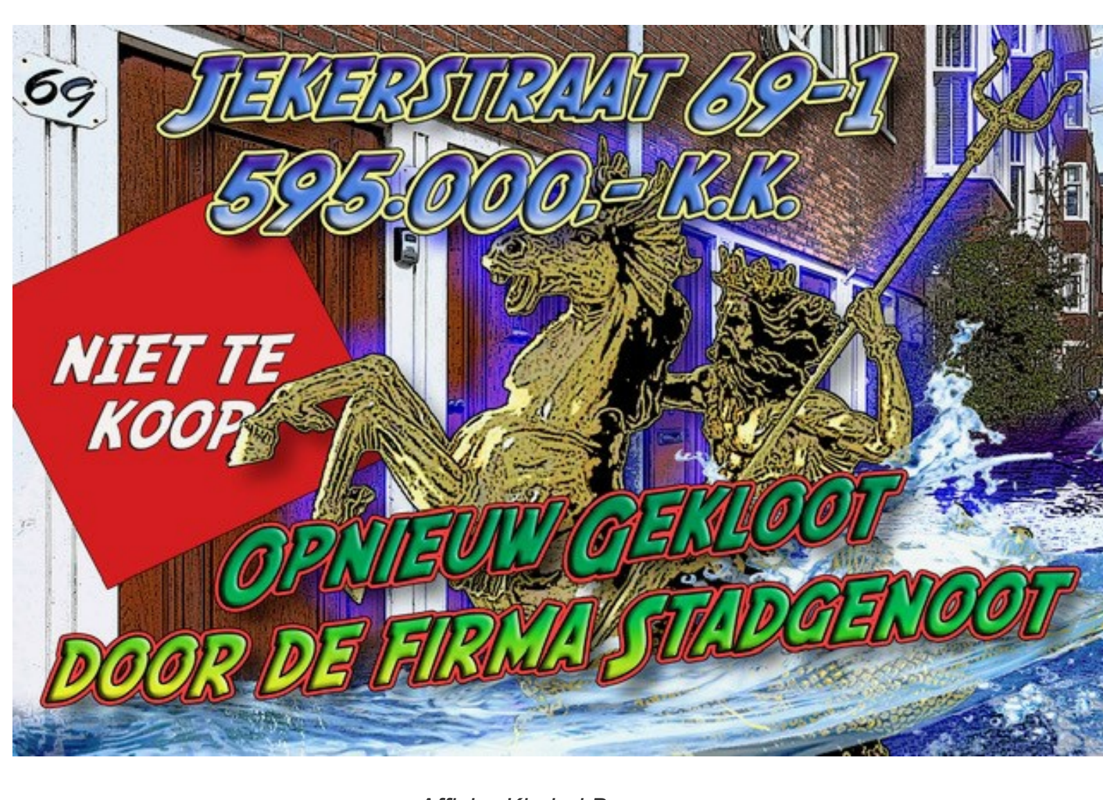
Affiche Kimbel Bouwman

Zaterdag 27 maart was de 28ste flitsactie van actiegroep Niet Te Koop tegen de verkoop door corporaties van sociale huurwoningen in Zuid. Vastgoedcorporatie was dit keer Stadgenoot die Jekerstraat 69-1 voor liefst €595.000 in de verkoopetalage had gezet.