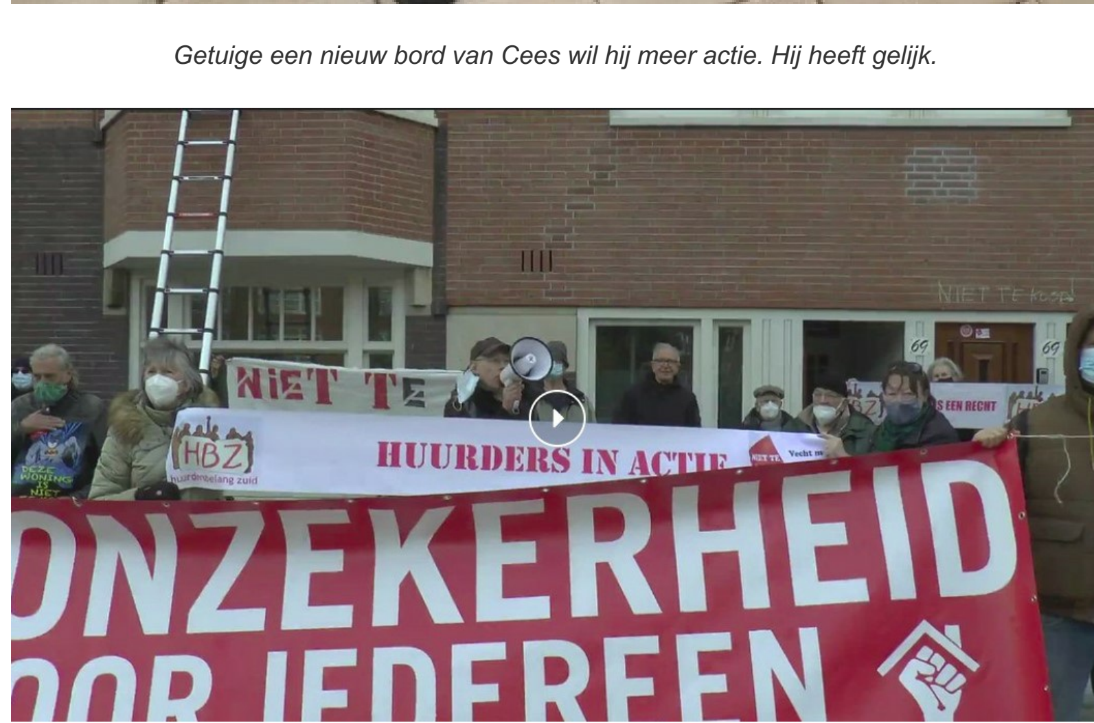
Bij gebrek aan plakwerk kwam het spandoek van de Bond Precaire Woonvormen goed van pas.