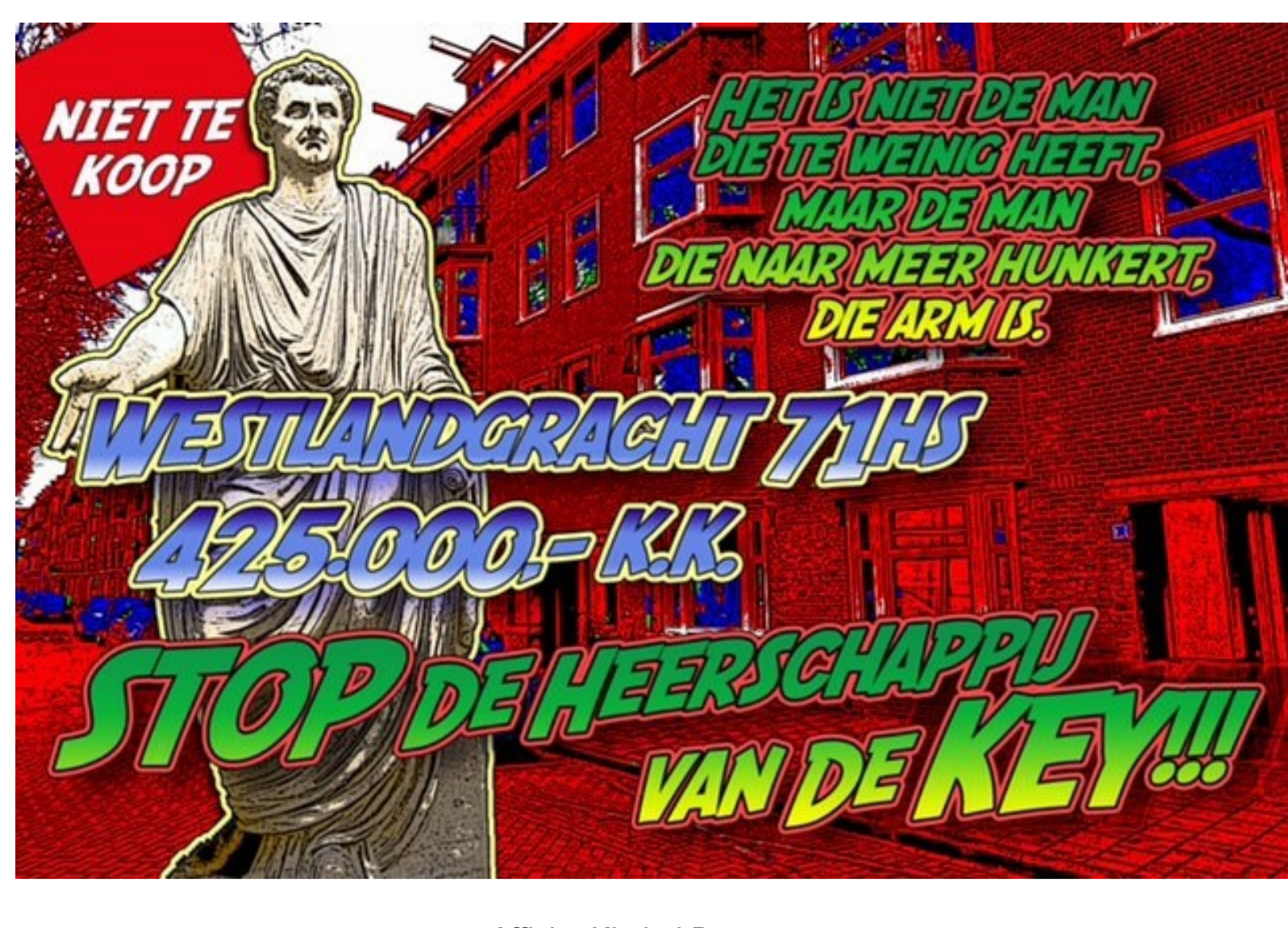
Affiche Kimbel Bouwman

Ondanks het barre weer, ijskoud, veel wind, nat, kwamen zaterdag 13 maart toch 15 personen naar de 26ste flitsactie van actiegroep Niet Te Koop tegen de verkoop door corporaties van sociale huurwoningen in Zuid. Vastgoedcorporatie was dit keer de Key die Westlandgracht 71-huis voor €425.000 in de verkoopetalage had gezet. Ik zeg 'had', want de woning is al definitief bezit van nieuwe eigenaars. Binnen 13 dagen.