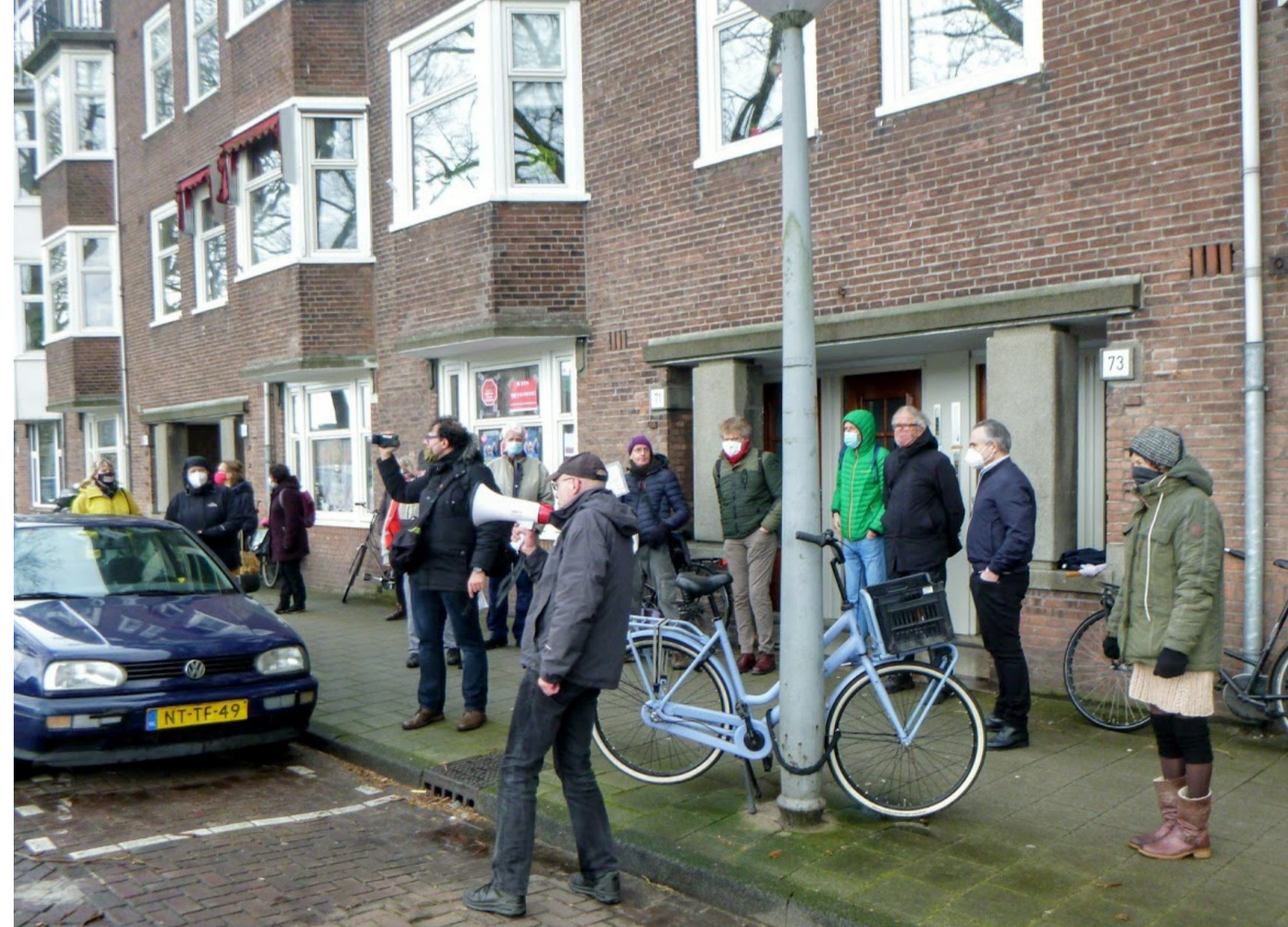
Aan de houding van iedereen is te zien hoe koud het was. Zo koud dat vergeten is de spandoeken tevoorschijn te halen voor deze foto.