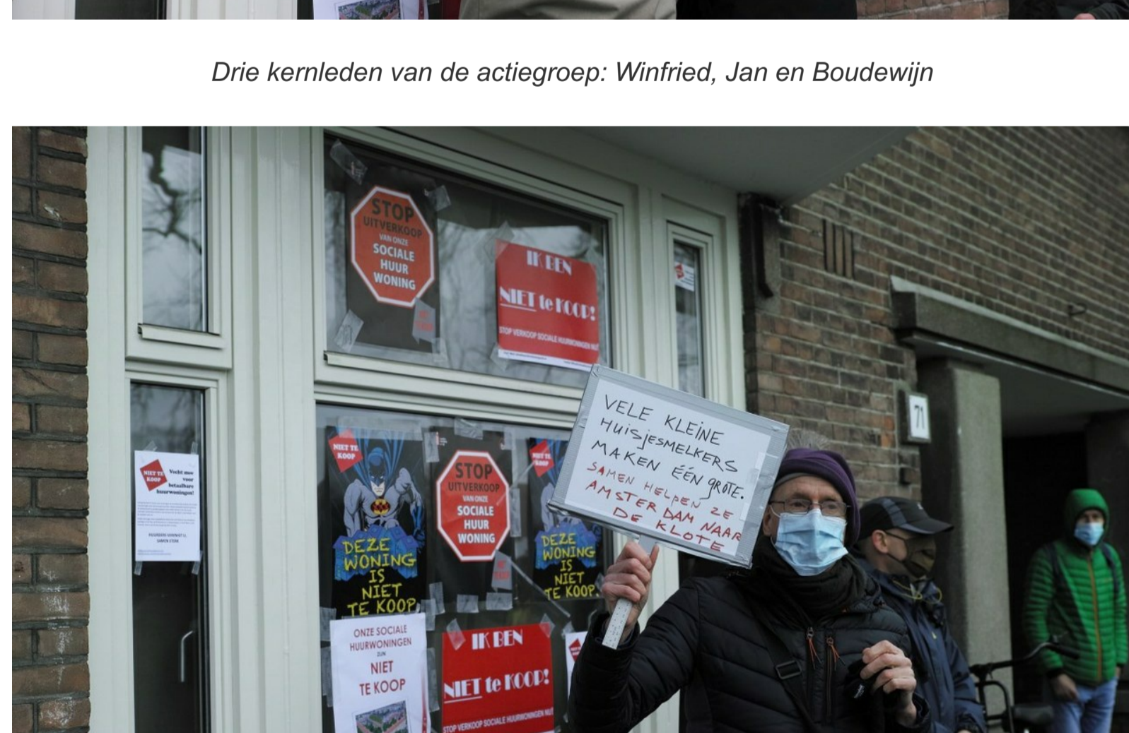
Cees met bord. Hij roept iedereen op zelf actiemateriaal te vervaardigen.

De verkopen zijn in 2021 voortvarend van start gegaan, de teller staat nu al op achtien woningen, alleen in Zuid, terwijl we in een harde lockdown zitten. Actiegroep Niet Te Koop wil af van die boterzachte afspraken tussen gemeente, corporaties en huurkoopels. Weg met die boterzachte termen als 'terughoudendheid' en 'inspanningverplichting'. De weg met die stop op de verkoop. Voor de verkoop krijgt de buurt niets terug, Zuid verwordt tot een enclave voor de rijken.