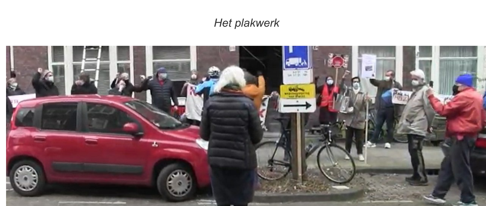
Een deel van de strijdbare actievoerders