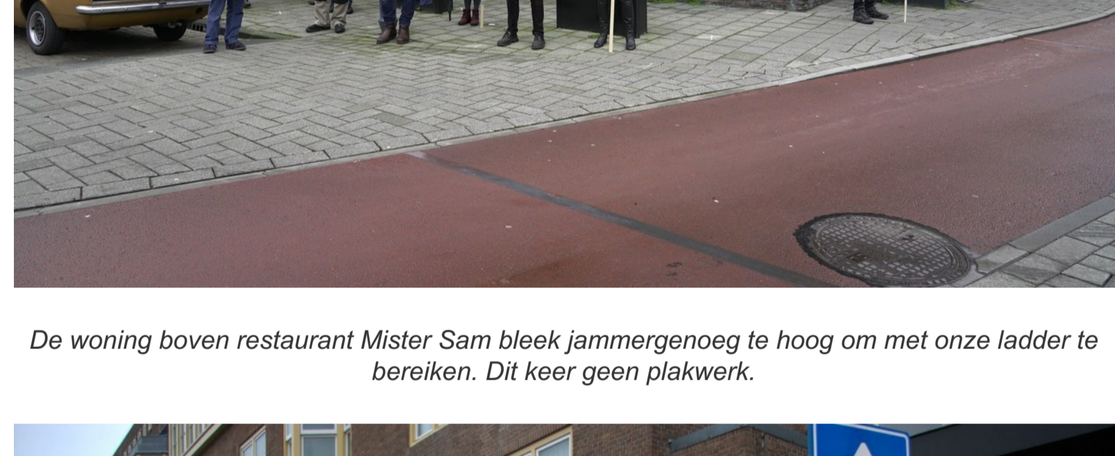
De woning boven restaurant Mister Sam bleek jammergenoeg te hoog om met onze ladder te bereiken. Dit keer geen plakwerk.

Er zijn opnamen gemaakt door Flavio F.Del.Pomo en Seppe Malfait. Hieronder een selectie.