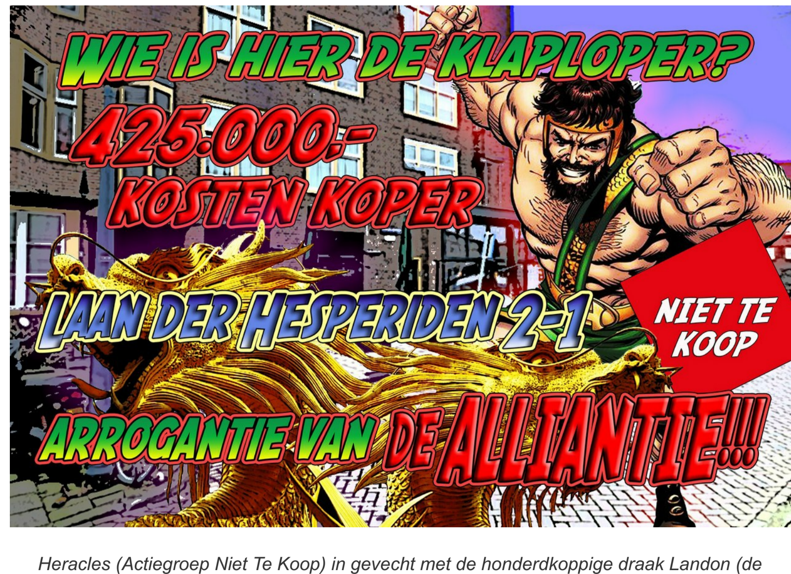
Hercules (Actiegroep Niet Te Koop) in gevecht met de honderdkoppige draak Landon (de wooncrisis). Affiche van Kimbel Bouwman.

De weergoden waren dit keer de actievoerders goedgezind al stond er een ijzige, straffe wind. Zij hebben één dag gewacht met hun ijskoude, alles verlamdende sneeuwjacht. We hebben geluk gehad. Deze zaterdag 6 februari was de 22ste flitsactie van actiegroep Niet Te Koop tegen de verkoop door corporaties van sociale huurwoningen in Zuid.