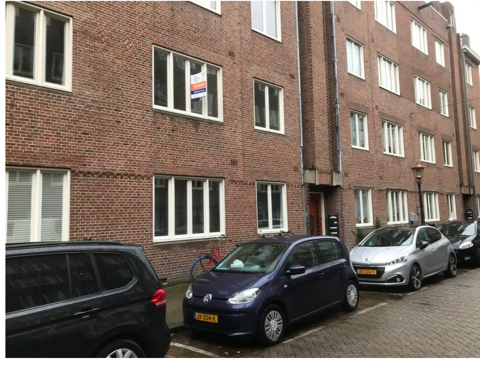
Karel du Jardinstraat 16-1

Behoeft modernisatie wil zeggen: de corporatie heeft jarenlang niets aan onderhoud gedaan Naar eigen smaak inrichten wil zeggen: voor winstmaximalisatie moet je een kookeiland maken en een visgraatparketje op de vloer leggen.